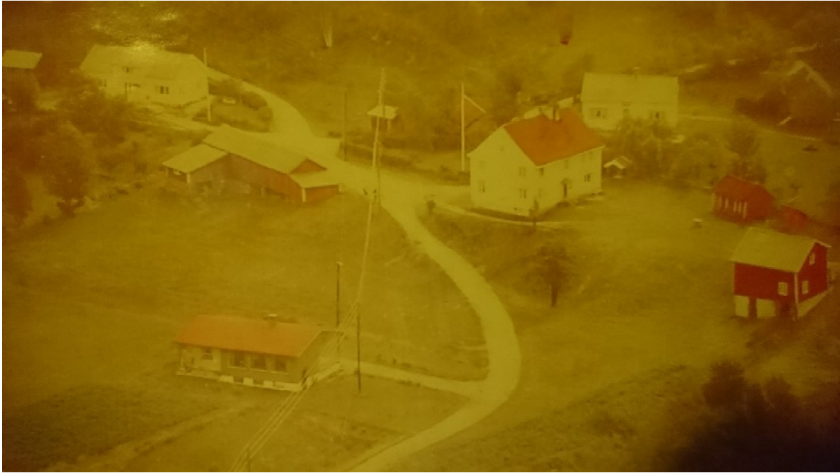
Dette fotoet fra 1972 viser Bakke lensmannsgård med en låve, et uthus og en utedo. Låven ble revet på slutten av 1970- tallet, mens uthuset og utedoen ble revet på midten av 1980- tallet.