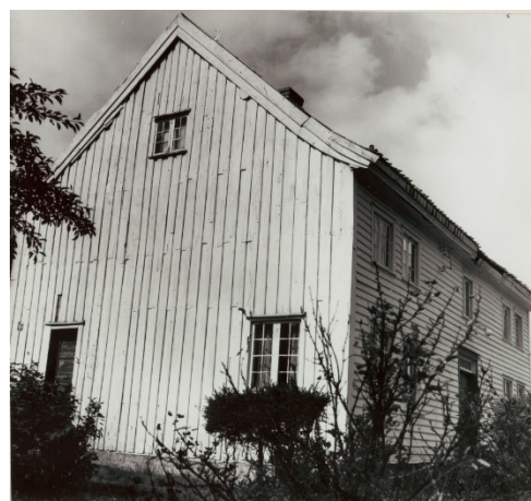
Bilder tatt av Bakke lensmannsgård i 1971.