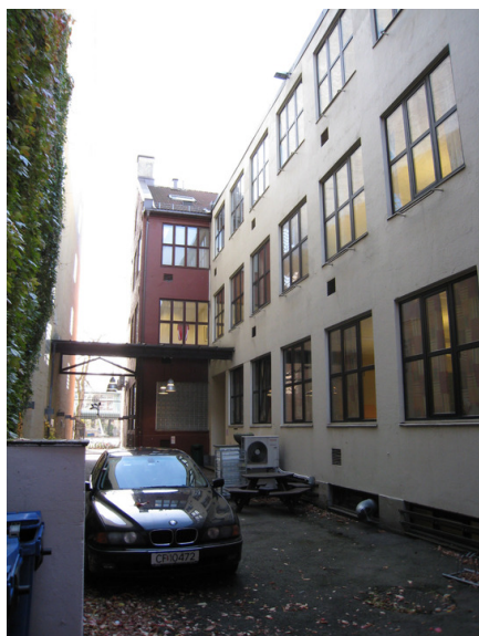
Bakgård med tilbygg og frontbygningens bakside.

Kompleks 13683001 Kristian Augusts gate 21, Oslo