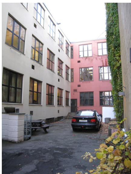
Tilbygg bakgård Foto: Anne Sætren, NIKU 2008.