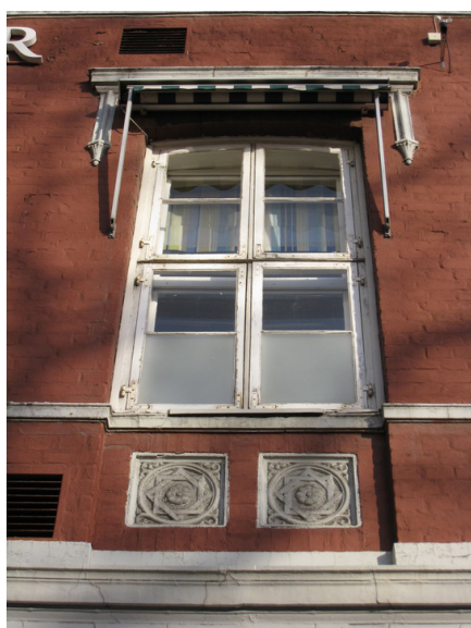
Detalj gatefasade.