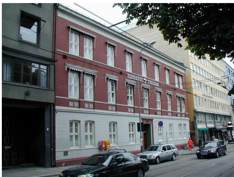
OTTO TREIDERS HANDELSSKOLE