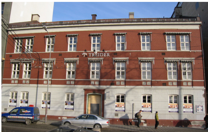
Frontbygningens gatefasade. Foto: Anne Sætren, NIKU 2008.

Kompleks 13683001 Kristian Augusts gate 21, Oslo