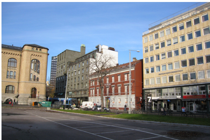
Kristian Augusts gate 21 sett fra Tullinløkka. Foto: NIKU v/Anne Sætren 2008