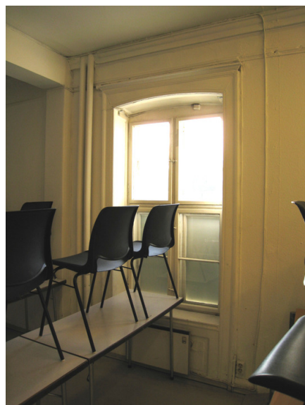
Pantegning 1.etasje. Opphavsrett: Entra