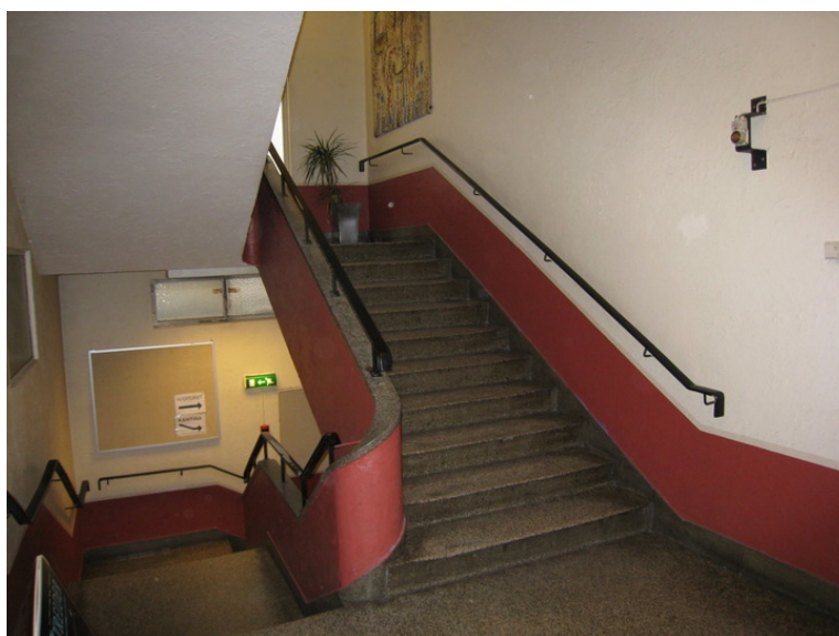
Trappeløp i tilbyggets inngangsparti.