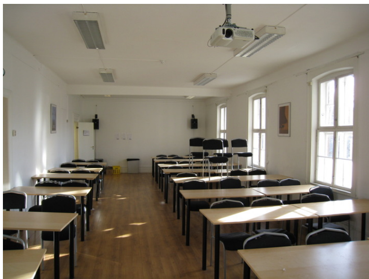
Undervisningsrom mot gate i 1.etasje