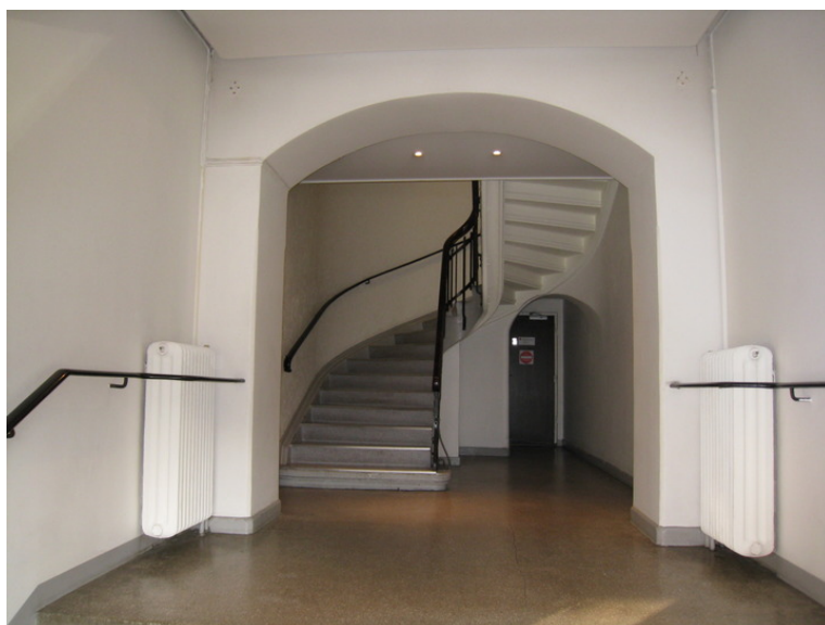
Trapperom 1.etasje Foto: NIKU v/Anne Sætren 2008