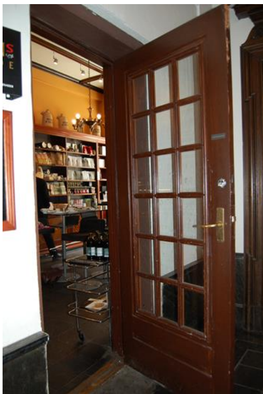
Dør fra butikklokalet til trappehallen