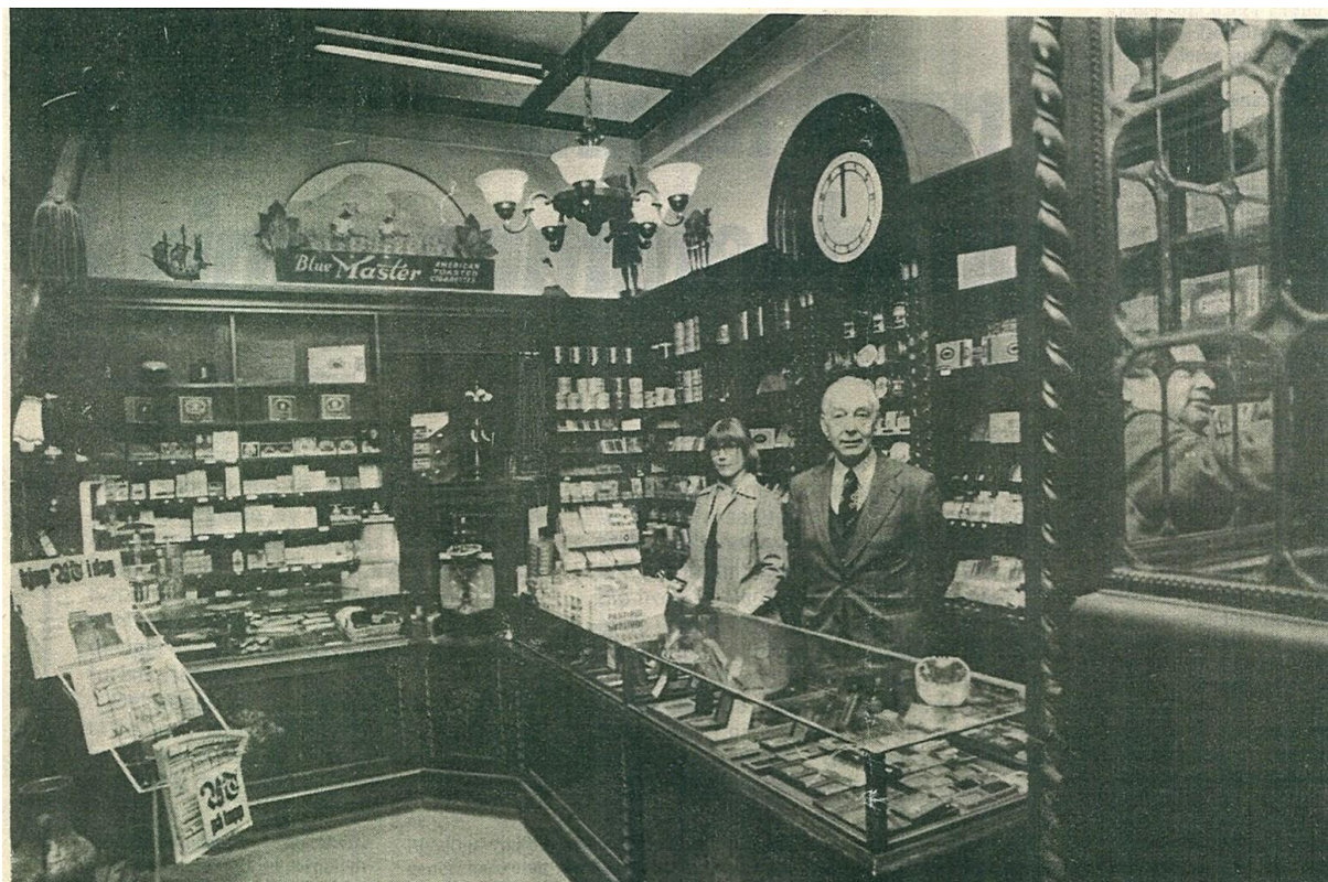
Interiøret i 1979 (frå reportasje i Morgenavisen 2.1.1979, fotograf Tor Skillestad)