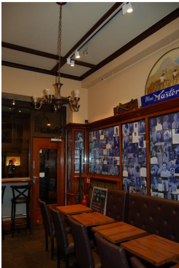
Interiøret sett mot sør