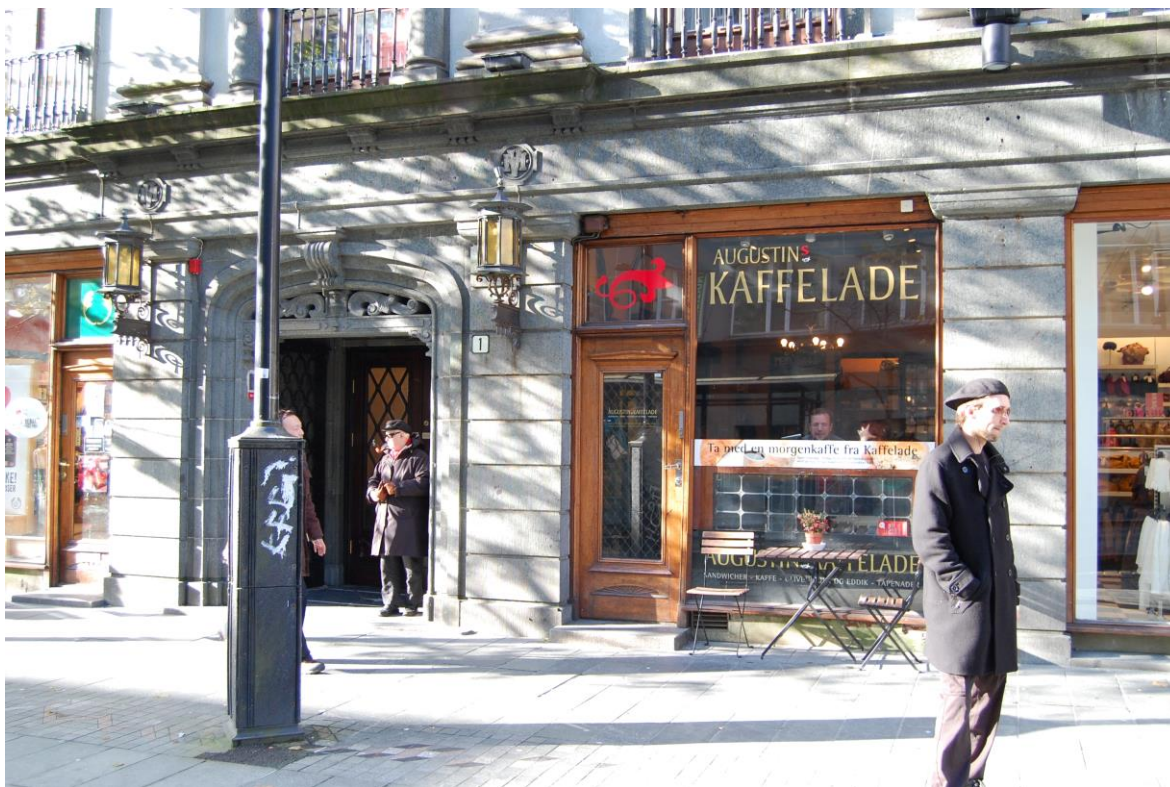
Detalj av fasaden mot Olav Kyrres gate (hovudingang til v., Reimers & Sønns Efft. til h.)