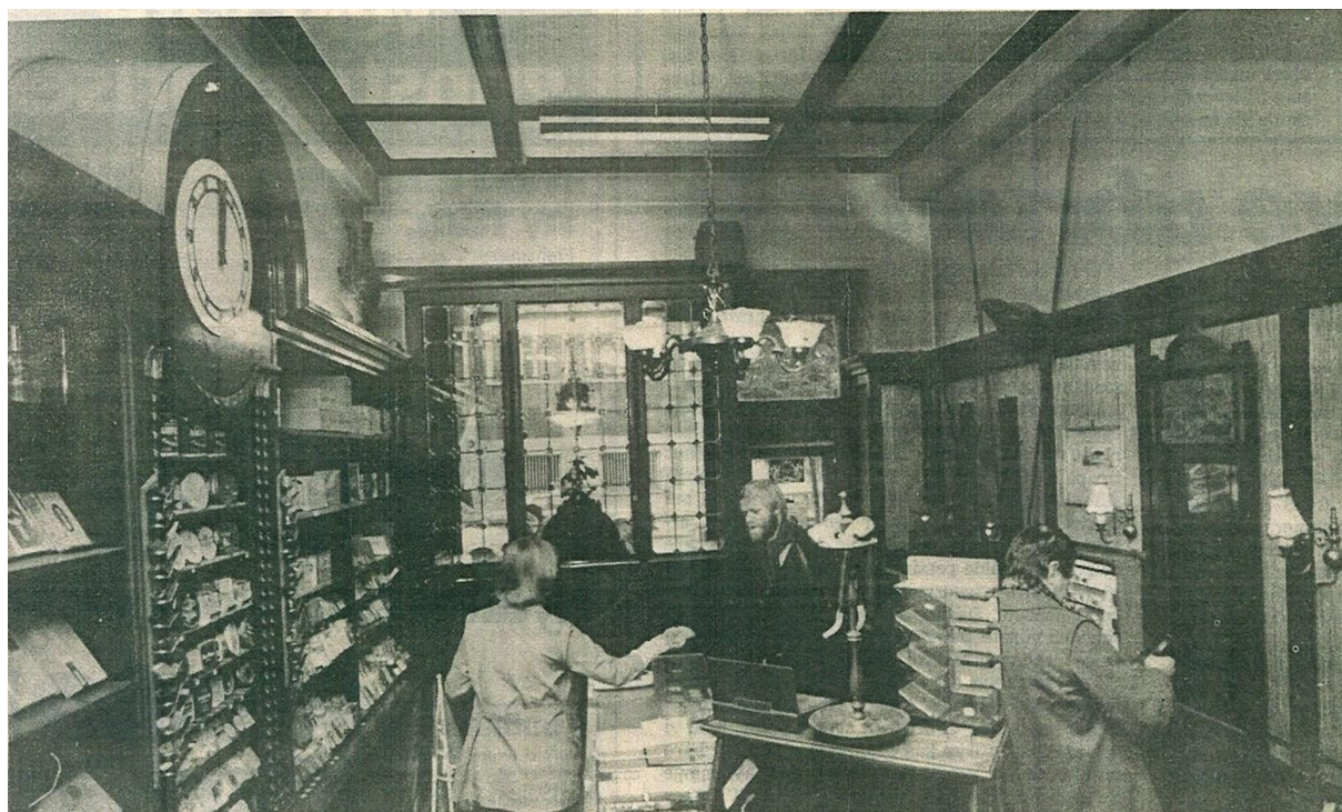
Interiøret i 1979 (frå reportasje i Morgenavisen 2.1.1979, fotograf Tor Skillestad)