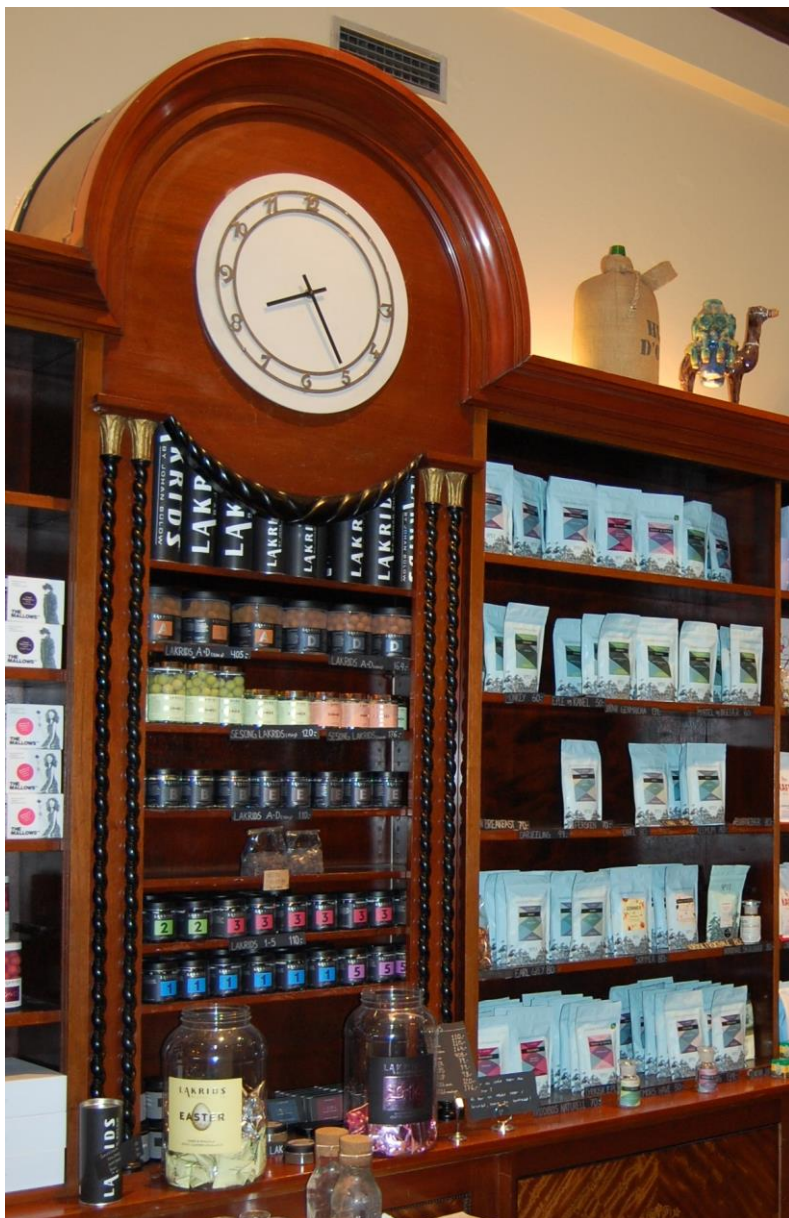
Midpartiet av hylla langs nordaustveggen