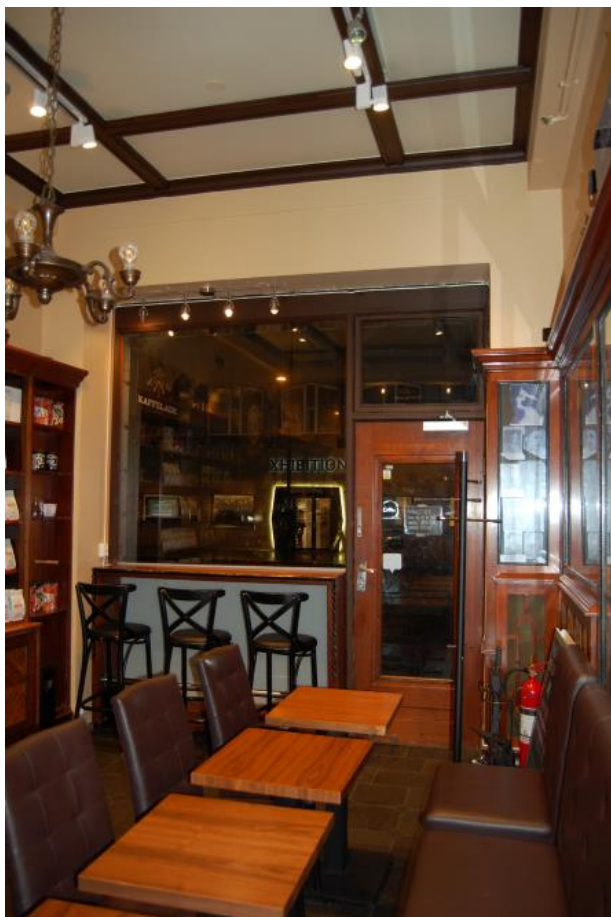
Interiøret sett mot søraust