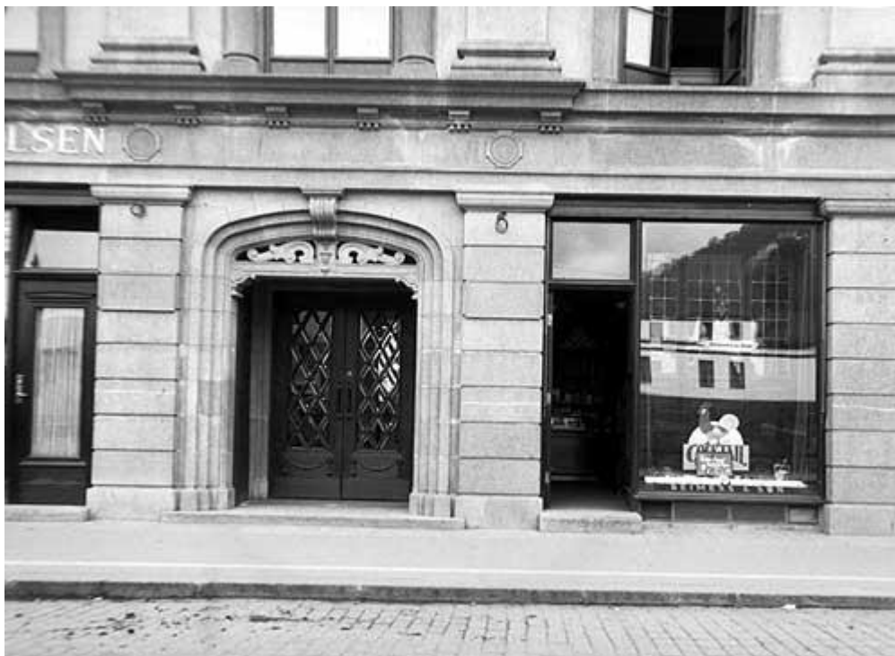
Fasaden ca. 1927 – nokre fasadedetaljar er enno ikkje monterert (fotograf Olai Schumann Olsen, UBB-SO-1220, Billedsamlingen, Universitetsbiblioteket i Bergen)