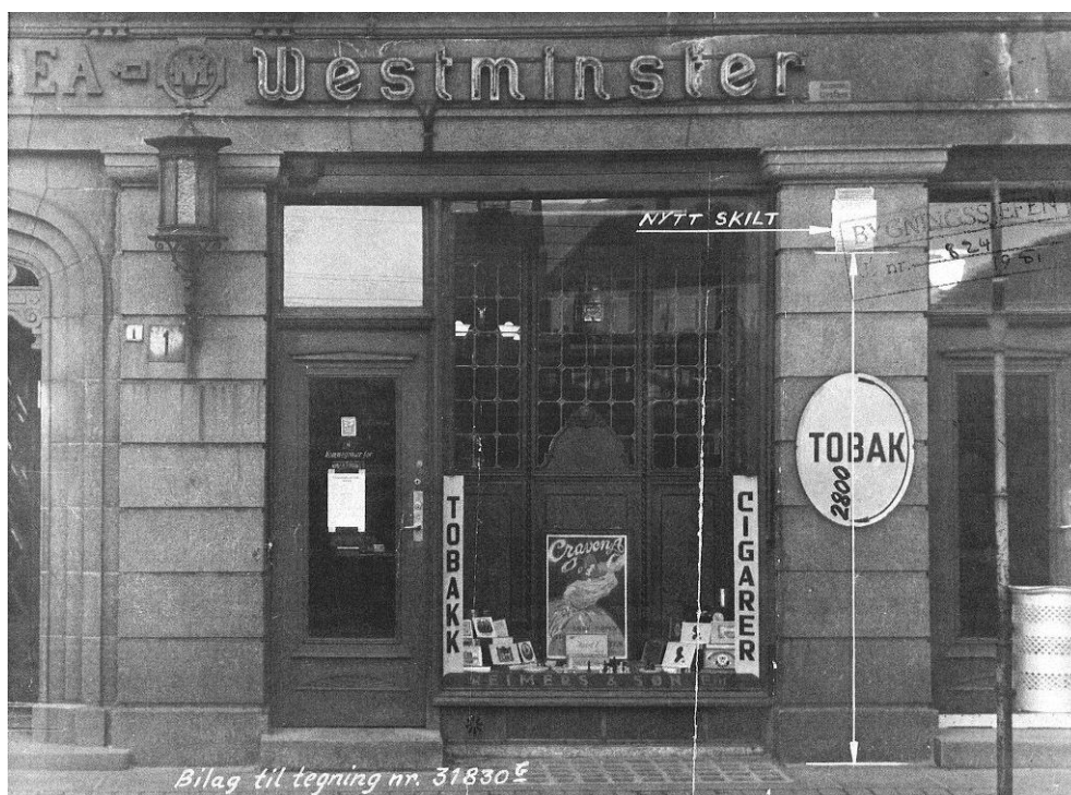
Fasade 1951 (frå byggesaksmappe for Olav Kyrres gate 1)