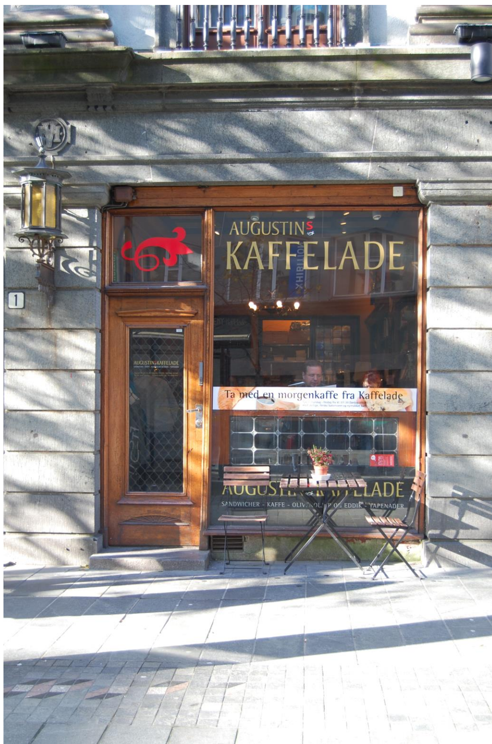
Fasaden til butikklokalet til Reimers & Sønns eff.