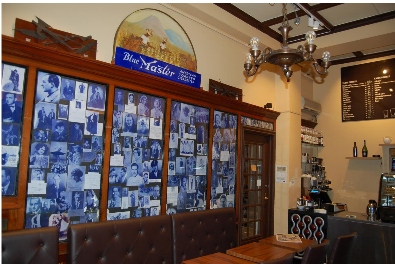
Interiøret sett mot vest