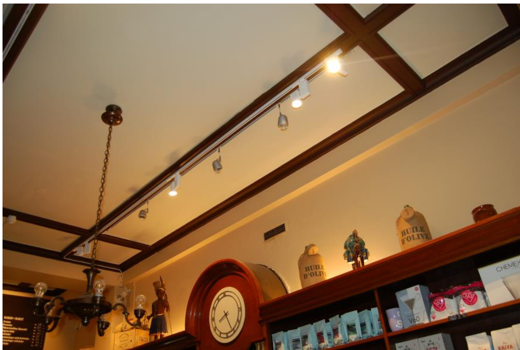
Taket sett mot nord