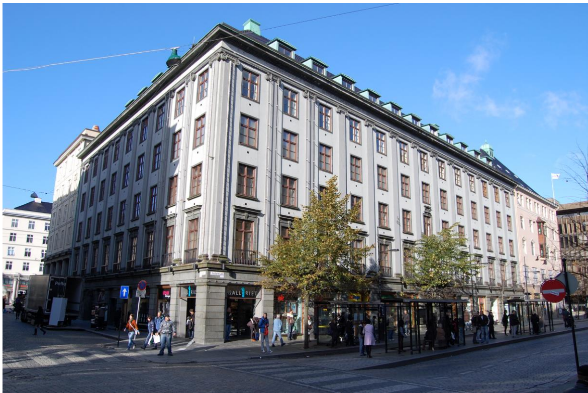
Olav Kyrres gate 1, eksteriør sett frå sør (Rådhusgaten til v., Olav Kyrres gate til h.)