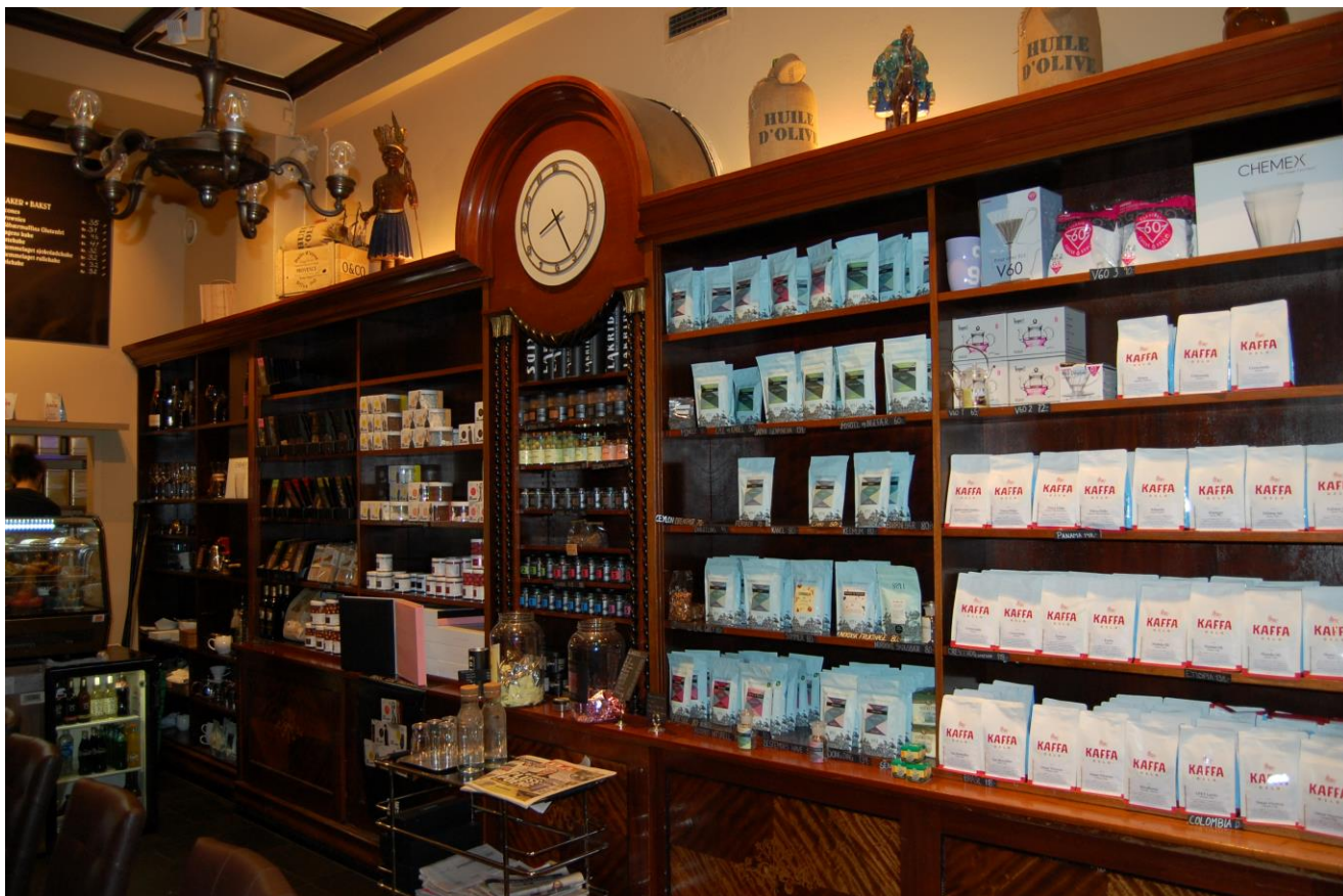
Interiøret sett mot nord