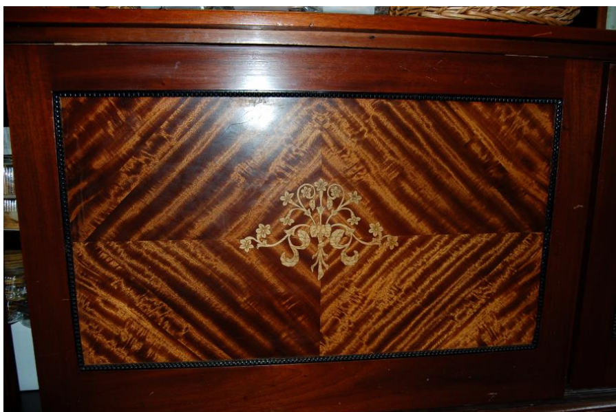
Skapfront nedst på hylla langs nordaustveggen