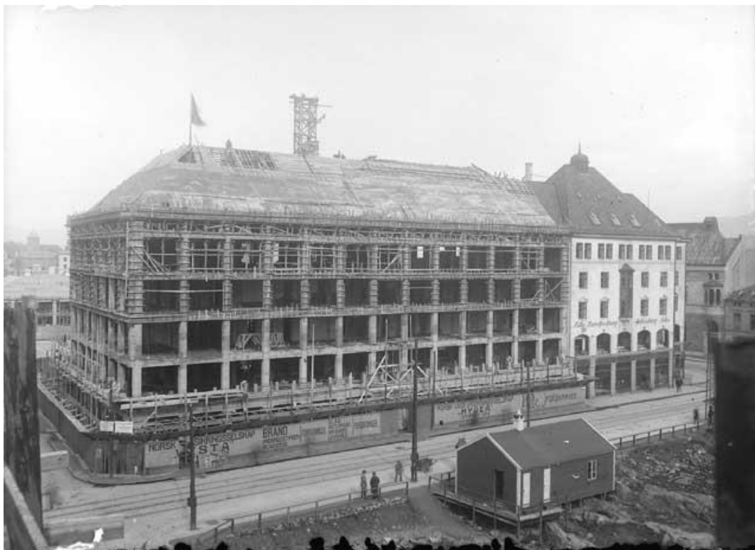
Olav Kyrres gate 1 under bygging, 16.4.1926