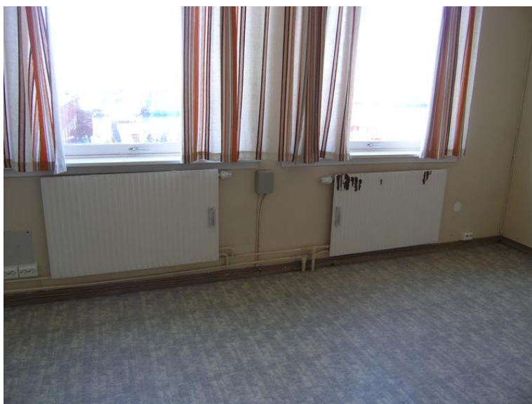
Tidligere kontor for fiskeinspektøren