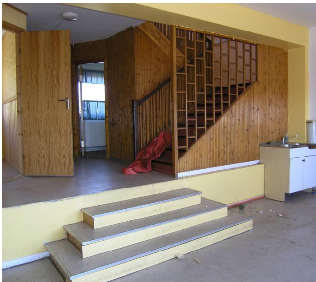
Butikklokale, nordre fløy