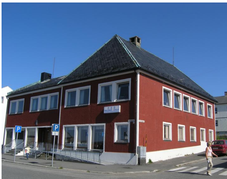
Fasade mot Strandgata