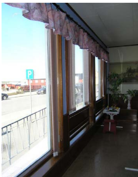
Rester etter interiør gammelt apotek