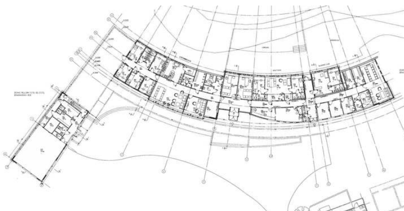
Plantegning 1. etasje. Opphavsrett: Statsbygg.