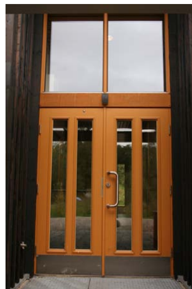
Detalj dør