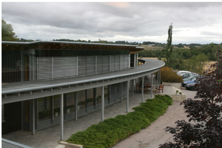
Den buete hovedfløyen sett fra gymfløyen.