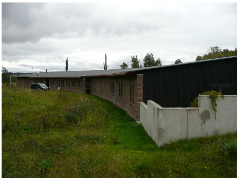
Vien-senteret, baksiden sett fra vest.