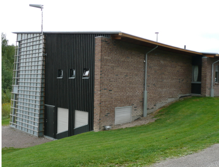
Bygningen er tilpasset terrenget. Fasade øst.