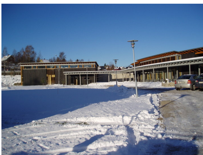
Hovedbygg og gymbygg (t.v).