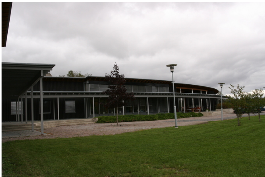
Vien-senteret sett fra sydvest med gymbygg til venstre.