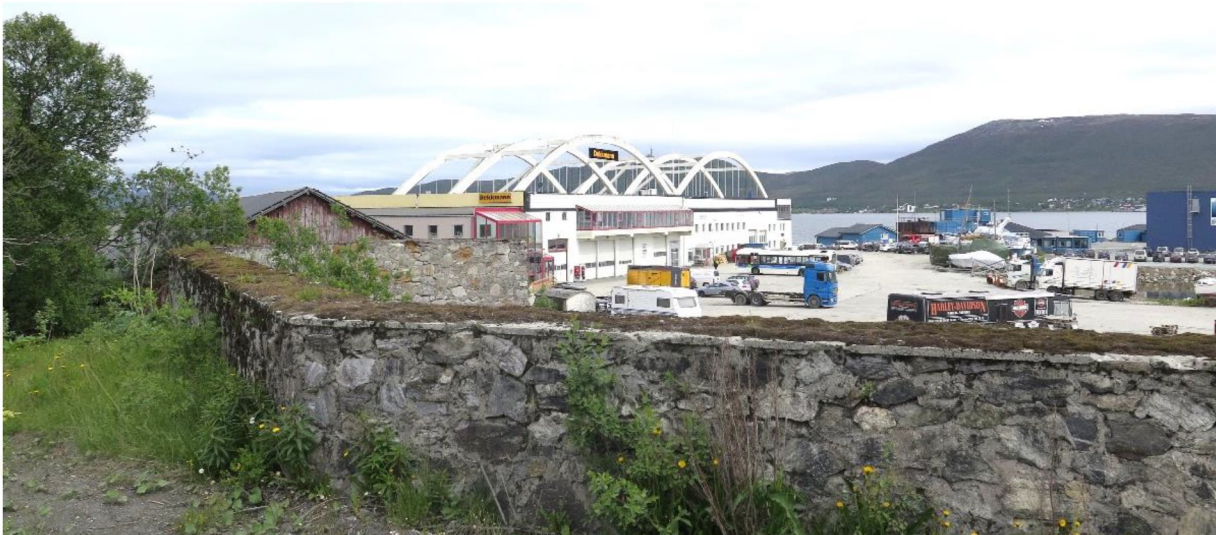
Splintvernmur og hangar på Skattøra.

Vi viser til tidligere utsendt fredningsforslag for tidligere Skattøra sjøflystasjon datert 11. september 2014 som har vært på høring hos berørte parter og instanser. På grunnlag av dette fatter Riksantikvaren følgende vedtak: