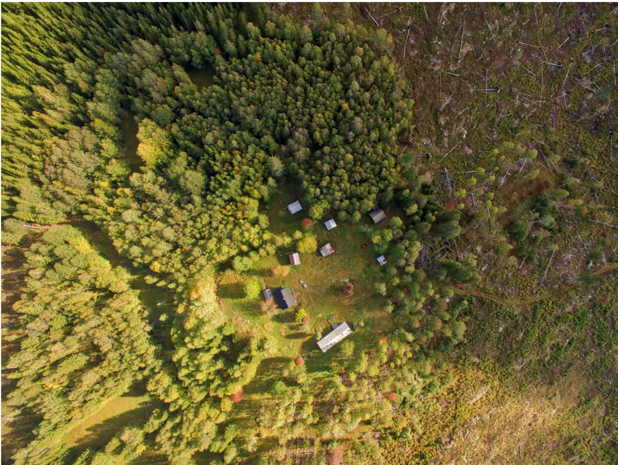
Abborhøgda med grøntanlegg og karakteristisk mosaikklandskap.

Vi viser til utsendt fredningsforslag for Abborhøgda gnr./bnr. 71/1, Kongsvinger kommune datert 28. juni 2019 som har vært på høring hos berørte parter og instanser. På grunnlag av dette fatter Riksantikvaren følgende vedtak: