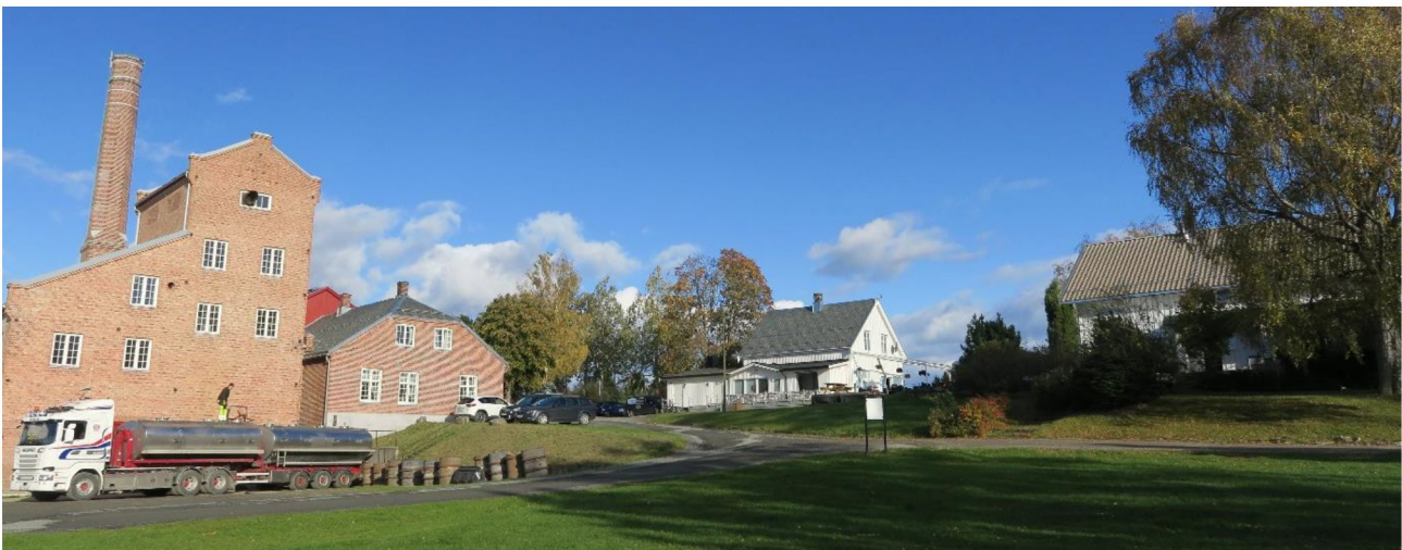
Atlungstad Brenneri.

Vi viser til melding om oppstart av fredning av Atlungstad Brenneri i Stange kommune, datert 30. august 2018, samt forslag om fredning sendt på høring til berørte parter den 28. februar 2019 og kunngjort i to aviser og i Norsk Lysningsblad. På grunnlag av dette fatter Riksantikvaren følgende fredningsvedtak: