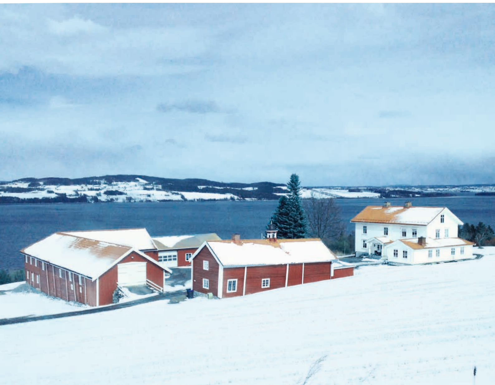
OPPLAND: Balke Lillo, Toten. Store og staselige gårdstun og enkeltbygninger setter sitt preg på landskapet i området Balke – Lillo på Toten. Rike arkeologiske funn viser at her har det vært bosetning og jordbruksdrift i lang tid.