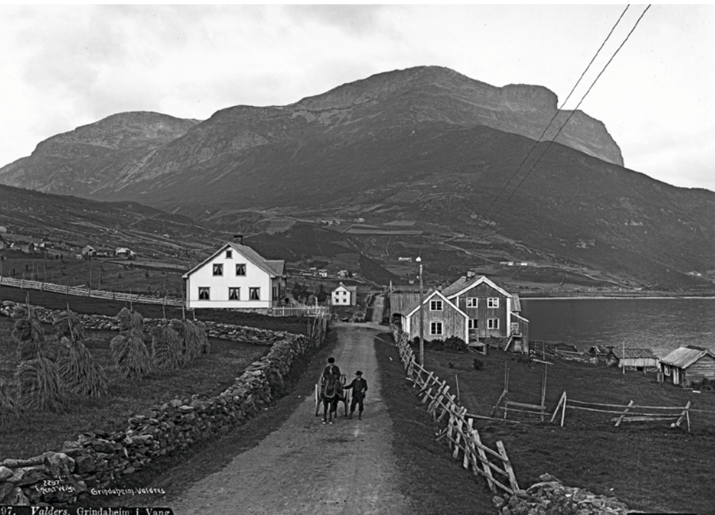
OPPLAND: Grindaheim, Vang i Valdres. Landskap er alltid i endring. En bevisst holdning til endringer og kunnskap om landskapet, kan bidra til at historiske spor ivaretas i arealplanleggingen.