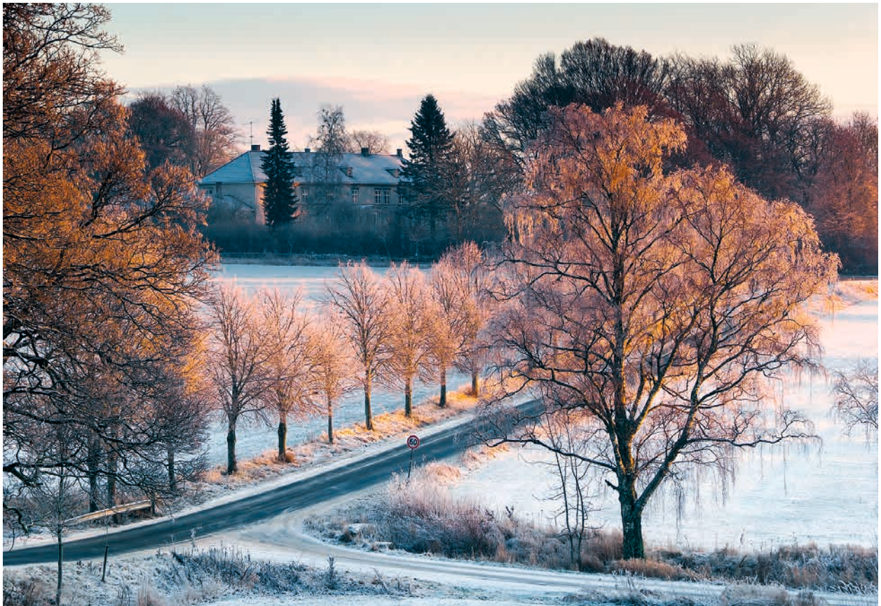
ØSTFOLD: KULA-området Værne kloster-området , Herregårdslandskap . Dette området er en viktig representant for herregårdslandskapene i Norge. En rekke historiske strukturer er bevart, et eksempel er alléen på bildet med herregården i bakgrunnen.