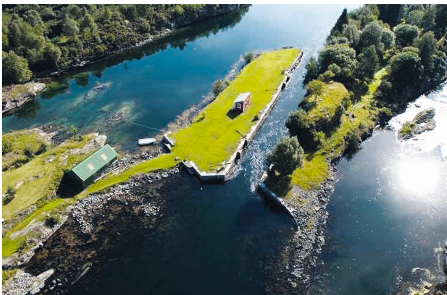
HORDALAND: KULA-området Den indre farleia, Fiskarbondelandskap, lynghei og farled. Gjennom de mange sundene i det langstrakte landskapet, er det sterke strømmer som har vært premissgivende for fast bosetning siden steinalder og for ferdselen i farleia fram til moderne tid. Lindåsslusene ble bygd i 1908 og er en av to bevarte sjøsluser i landet.

Permanent busetnad og framvekst av eit kombinert næringsgrunnlag av fiske og jordbruk har stor tidsdjupne og ein kontinuitet i landskapet. Lyngheilandskapet på Lygra er sjeldant og framstående i nasjonal og internasjonal samanheng. Landskapet er eit av dei nasjonale kjerneområda for samanbygde hus og for bruk av stein som byggjemateriale, som plasserer landskapet i eit kulturelt felleskap med andre område kring Nordsjøen. I dette landskapet ligg den strategisk viktige indre farleia. Den har mange kulturminne knytt til seg med stor tidsdjupne og høg opplevingsverdi. Her er mange gravrøyser som vitnar om maktstrukturar i forhistoria. Kongsgarden på Seim vitnar om kor viktig Den Indre Farleia var i vikingtid og kva rolle den spelte i noregshistoria.