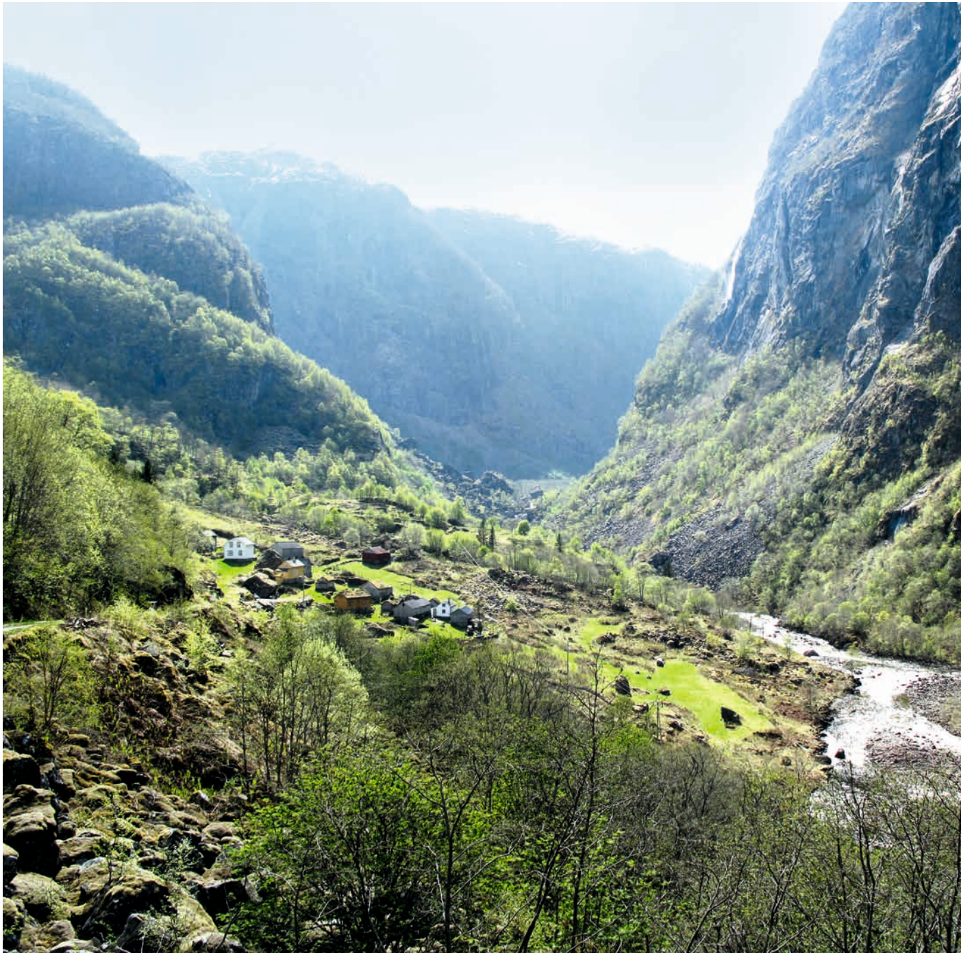
HORDALAND: KULA-området Eidfjord , Jernvinneanlegg og gravminne . Ferdselsveger mellom aust og vest. Gjennom Hjulmodalen går en sentral ferdselsrute fra vest til øst opp fra Hardangerfjorden til Hardangervidda. Landskapet er sårbart for blant annet kraftutbygging og hyttebygging, og bør i kommuneplanens arealdel legges inn som hensynssone c) med særlig hensyn til landskap og kulturmiljø.