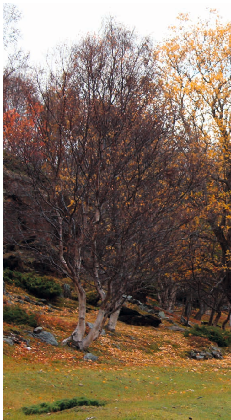
TROMS/ROMSSA/TROMSSA: KULA-området Spildra/Spittá/Pitansaari, Skorpa/Skárfu/Karfunsaari og Nøklan/Lohkkalsuol/Lokkala , Brytningslandskap: fra sjøsamisk til norsk, fra samisk mytologi til kristen tro, fra sentrum til periferi. Spildra er fremdeles et livskraftig sjøsamisk samfunn hvor folk i hovedsak livnærer seg på fiske, gårdsbruk og turisme. Beitelandskap ved Fjellnes øst for Dunvik.

Se Riksantikvarens eksempelsamling Bestemmelser til arealplaner for flere eksempler.