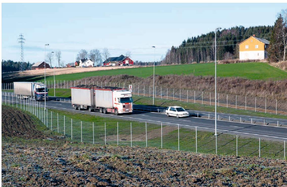
ØSTFOLD: Ny E18, Kvakestad ved Askim. Etablering av nye veganlegg fører ofte til store inngrep i landskapet. Kulturhistoriske landskap av nasjonal interesse er et aktuelt hensyn som planleggere og utredere må ta inn og vurdere i konseptvalgutredninger.