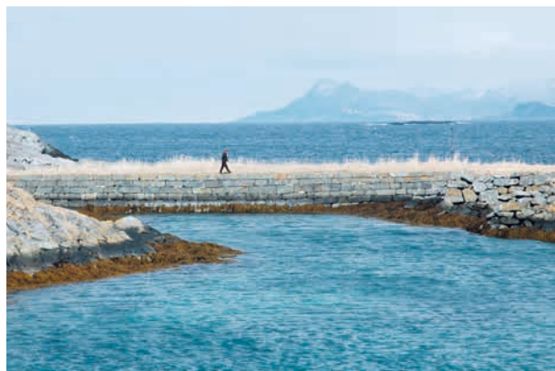
TROMS/ROMSSA/TROMSSA: KULA-området Yttersida av Senja/Sáččá fávllebeal , Fiskerilandskap . Utenfor Senjakysten ligger Senjaværene, en rekke av tidligere bebodde øyer, holmer og skjær. Store og godt synlige ruiner av moloanlegg vitner om utnyttelsen av de rike forekomstene av sild og skrei på 1880-tallet. Bildet er fra Steinavær på Senjas Vestkyst.

Les mer om de kulturhistoriske landskapene av nasjonal interesse på prosjektsidene om KULA på Riksantikvarens nettsider .