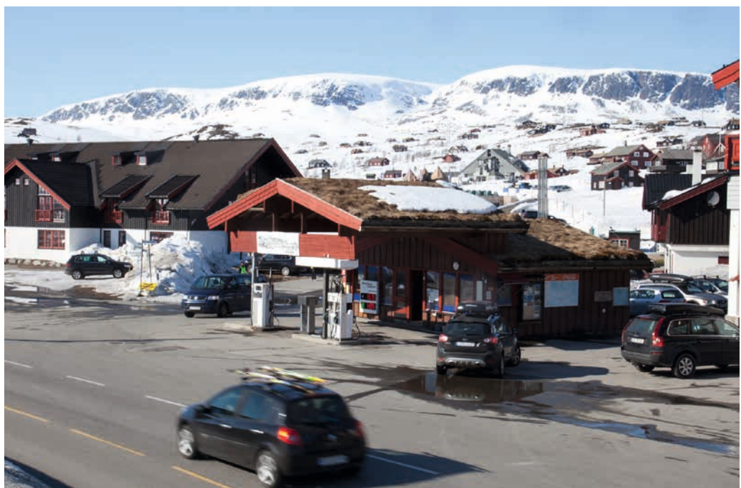
BUSKERUD: Ustaoset. Landskapet her har vært gjennom store endringer de siste hundre år. Kommuneplanens arealdel er kommunens viktigste virkemiddel for forvaltningen av de kulturhistoriske verdiene i landskapet.