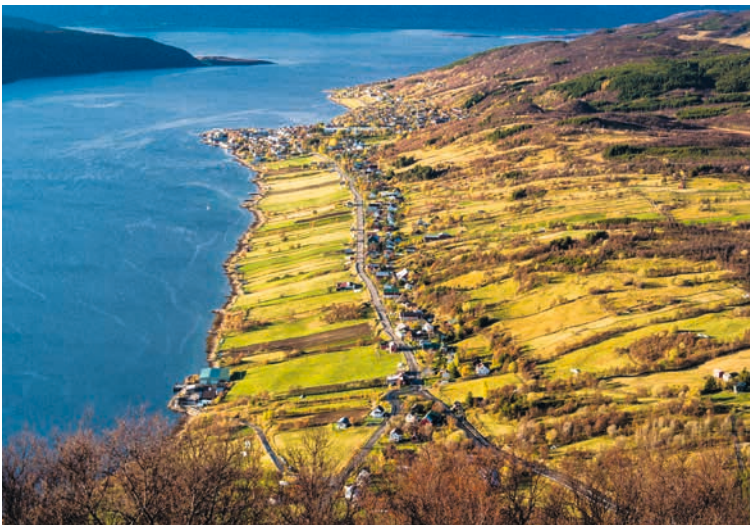
TROMS: KULA-området Kveøya og Borkenes – Vik , Frodig jordbrukslandskap med lang kontinuitet . På Kveøya er det en bred brem av innmark i aktiv bruk. Der dyrkes det søte, smakfulle jordbær og gourmetpotet.

Les mer om de Kulturhistoriske landskapene av nasjonal interesse på prosjektsiden for KULA på Riksantikvarens nettsider .