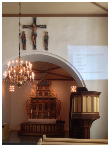
Det går fint å projisere rett på veggen i mange kirker. Fra Våle kirke i Vestfold.

Lerretskassen skal plasseres minst mulig synlig og ha samme farge som bakgrunnen den er festet på. Lerretskassen skal ikke plasseres på dekorerte flater, eller slik at det virker forstyrrende på viktige kunstneriske eller arkitektoniske motiver. Tiltaket skal gjennomføres med minimale inngrep. Innfesting skal skje så skånsomt som mulig.