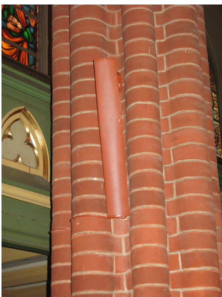
Høytalere med godt tilpasset farge og form. Fra Bragernes kirke.

Høytalerne må ha en farge som gjør at de tar minst mulig oppmerksomhet. Installasjonene skal ikke plasseres på dekorerte flater, eller slik at det virker forstyrrende på viktige kunstneriske eller arkitektoniske motiver. Tiltaket skal gjennomføres med minimale inngrep.