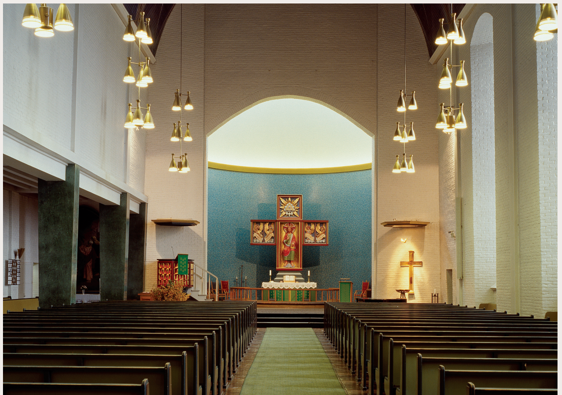
Den store høytaleren i Molde domkirke glir godt inn i interiøret. Den er høy og slank, plassert i et sprang i vegglivet og malt i veggfargen. Én høytaler dekker lydbehovet i hele kirkerommet.

Denne veilederen gjelder for listeførte kirker. Disse er vurdert som spesielt verdifulle og har nasjonal verdi. De skal behandles med like stor respekt som fredete kirker. At biskopen er vedtaksmyndighet for listeførte kirker, er et uttrykk for at kirken selv skal ta sitt kulturminneansvar.