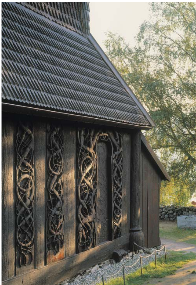
Urnes stavkyrkje.

Kommunen kan ha mål knyttet til kulturminner og kulturmiljøer i kommuneplanen og i tematiske kommunedelplaner. Det kan også finnes regionale planer for kulturminner og kulturmiljøer, utarbeidet av fylkeskommunen, der det er relevante mål.