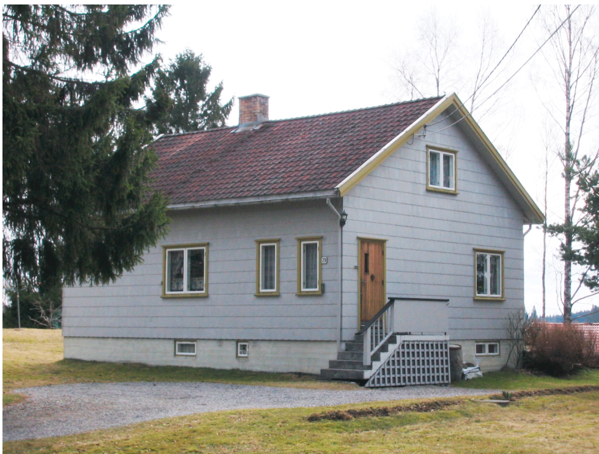
Villa i Enebakk fra 1950-tallet som vurderes til å ha nasjonal interesse i den kommunale kommunedelplan for kulturminner og kulturmiljøer; fordi dette er lite endret og er derfor representativt for et type småhus på 50-tallet.

Ved å samle kunnskap om, systematisere, verdisette og vurdere kulturminnene i kommunen vil en skaffe seg et godt grunnlag for å forvalte disse kulturminnene. Konkrete tiltak for å forvalte dem kan nedfelles i handlingsplanen.