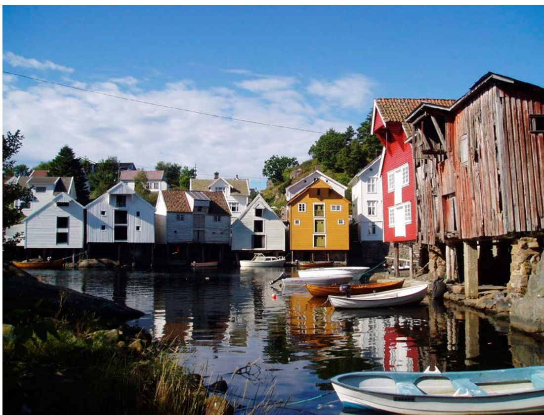
Sogndalstrand kulturmiljø.