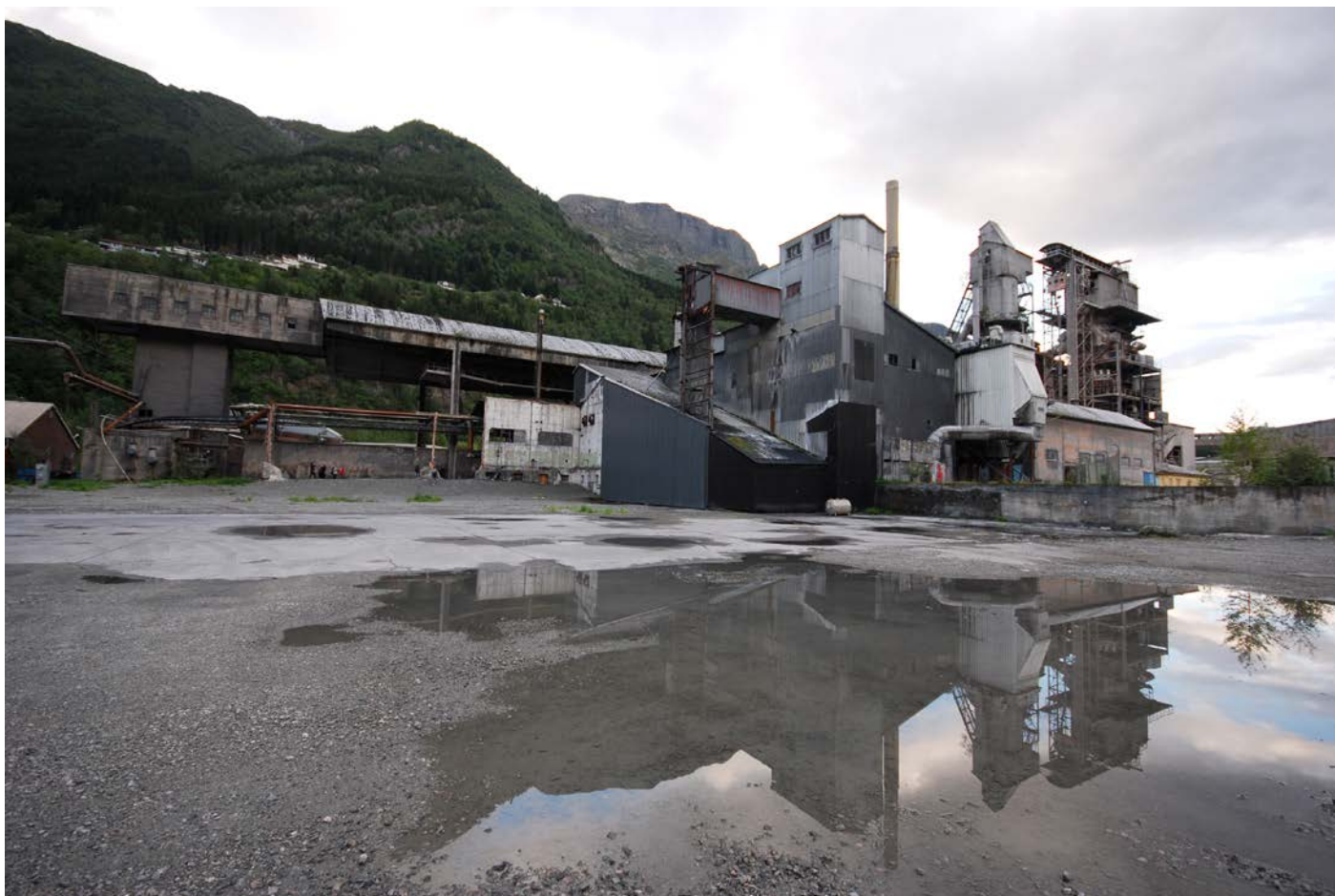
Odda smelteverk.

Gjennom selve prosjektarbeidet generes ulike typer kompetanse knyttet til prosess og prosjektledelse, særlig i forhold til det å legge til rette for dialog og samhandling på tvers av fag- og sektorgrenser. Viktig i den sammenheng er samarbeid og dialog med eksterne kunnskapsmiljøer om arbeidet.