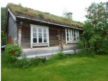
Grindbygd hus, Ørsta