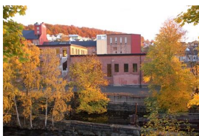
Fra Hammerdalen i Larvik kommune

Larvik er èn kommune – kommunens tettsteder utvikles med respekt for stedets egenart, rike kulturarv og fokus på å skape gode møteplasser.