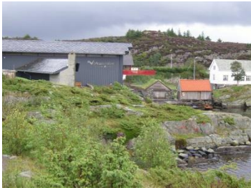
Kystmuseet i Øygarden

Sikra natur – kulturverdiane som varig kjelde for helse, trivsel og næringsverksemd