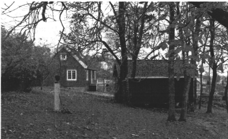
Anlegget sett fra syd. Bolighus til venstre og atelier til høyre. Bysten av Edvard Munch er utført Arne Durban.