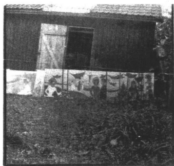
Malerier fra Lindefrisen utenfor atelieret i Åsgårdstrand, fotografert av Edvard Munch i 1904.

I Munchs tid gikk grensen til Munchs eiendom bakenfor (syd) for atelieret og ovenfor (vest) for stien ved stranden. Tomten var bygslet, og Munch måtte betale en årlig leie. Det var en strand nedenfor, kalt Bollerødvara. I Munchs hage fikk busker og trær gro som de ville. Det var en frukthage med bl.a. stikkelsbær, rips, epler og moreller.