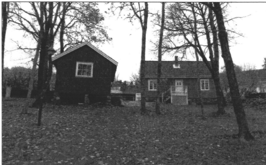
Edvard Munchs hus og atelier sett fra øst.

Fredningen av uteområdet/tomten skal sikre kunstnerens tidligere eiendom og de senere tilkjøpte tomter som i dag utgjør parken. Edvard Munchs tidligere hage og nære omgivelser (sjøen og stranden) var vesentlige for kunstnerens virke både som motiv og inspirasjon, blant annet for det kjente maleriet «Melankoli».