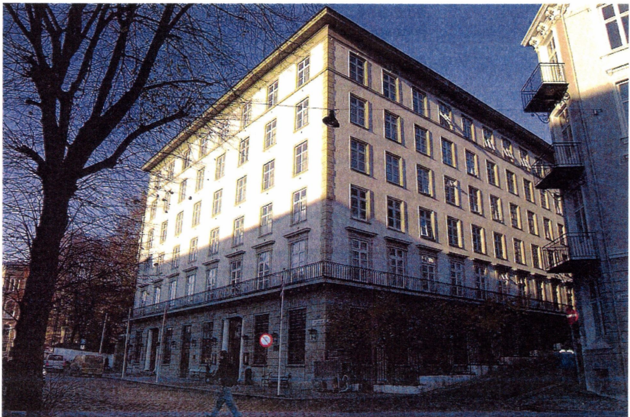
Grand Hotell Terminus, Zander Kaaesgate 6, Bergen.

GRAND HOTEL TERMINUS, ZANDER KAAESGATE 6, GNR. 166, BNR. 552, BERGEN KOMMUNE - VEDTAK OM FREDNING MED HJEMMEL I LOV OM KULTURMINNER § 15 JF. § 22.