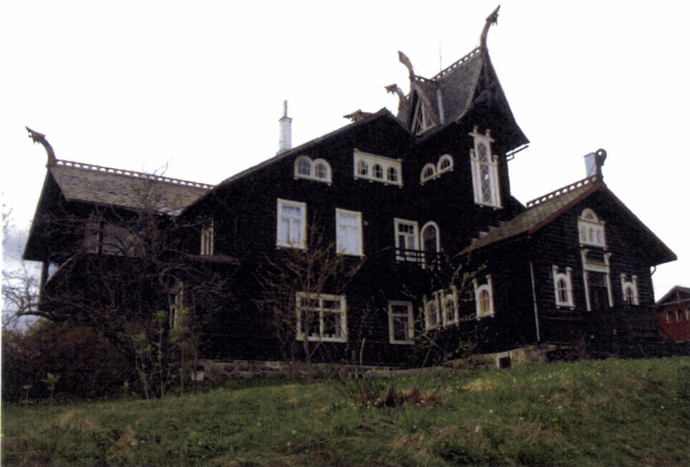
Kornhaug sett fra sørøst.

Kornhaug - gnr. 132 bnr. 85, del av bnr. 3, bnr. 77, bnr. 148, bnr. 204 og del av bnr. 205 - Gausdal kommune - Vedtak om fredning med hjemmel i lov om kulturminner § 15 og § 19 jf. § 22