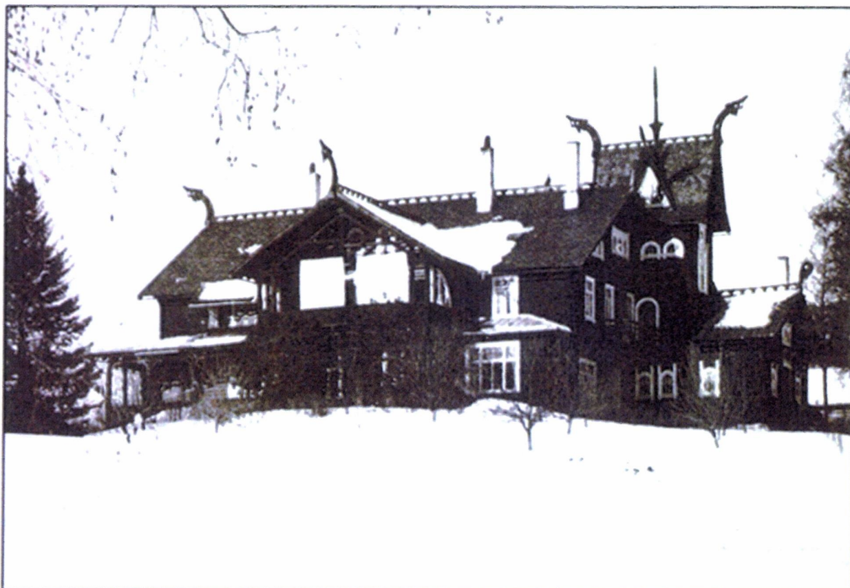
Kornhaug Sanatorium ca. 1945. Fra informasjonsheftet «Kornhaug» utgitt av Stiftelsen Kornhaug 1982.

Dragestilen var inspirert av eldre norsk byggekunst og kan beskrives som en hybrid av tradisjonell folkelig byggekikk, sveitserstil og stavkirkeelementer. Karakteristiske trekk ved stilen er bl.a. en asymmetrisk bygningskropp, upanelte tømmervegger, verandaer og svalganger, store vinduer med varierende utforming, bratte tak med mønekammer og store takutstikk, tårn med spir og takryttere og dekor fra stavkirker – først og fremst i form av dragehoder. Hovedbygningen på Kornhaug har alle de karakteristiske trekkene som særpreger dragestilen, og er på alle måter et representativt eksempel på denne spesielle norske, nasjonalromantiske arkitekturstilen.