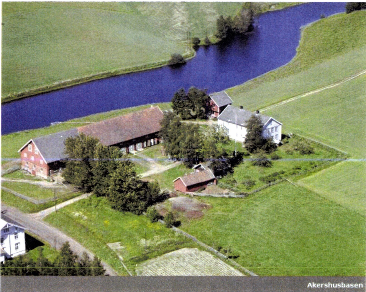
Jøndal Østre, foto: Akershusbasen, 1964

I medhold av Lov om kulturminner av 9. juni 1978 nr. 50 (kml) §§ 15 og 19, jf. § 22, freder Riksantikvaren hovedbygningen på Jøndal Østre med et område rundt for å bevare kulturminnets virkning i miljøet, Nesvegen 106 og 108, gnr. 6, bnr. 1 i Eidsvoll kommune.