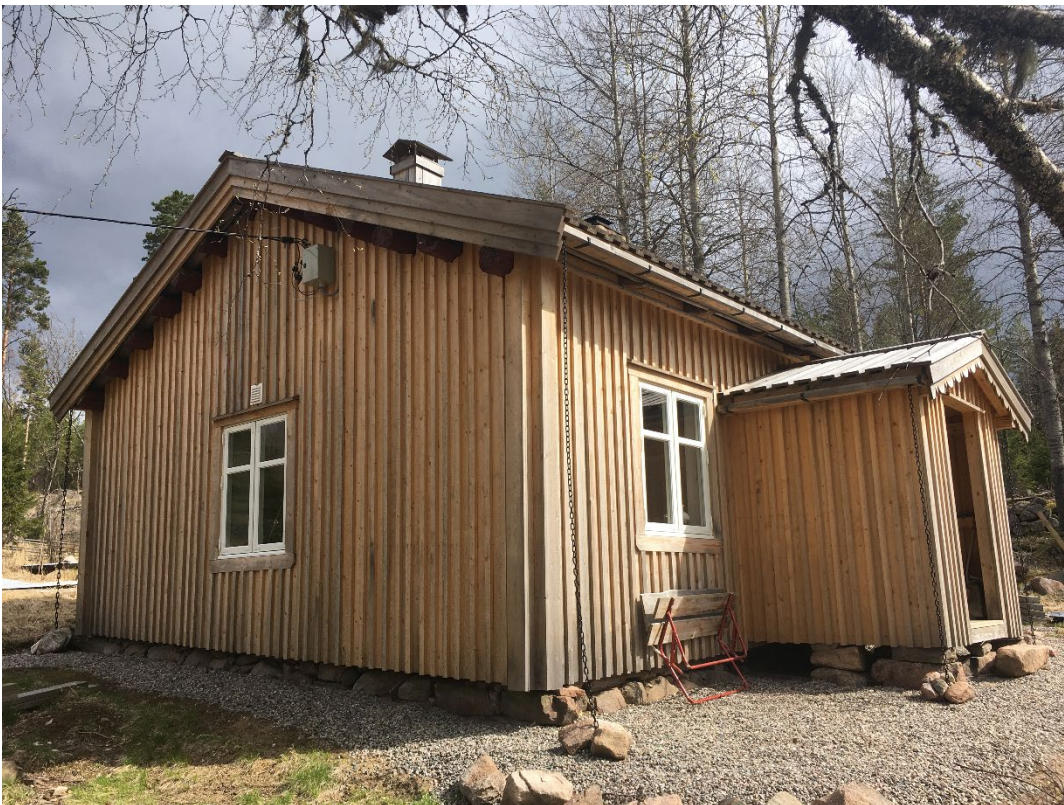
Røykstua på Askosberget Øvre.

Vi viser til fredningsforslag for Askosberget Øvre gnr./bnr. 116/5, Grue kommune, datert 11.12.2020 som har vært på høring hos berørte parter og instanser.