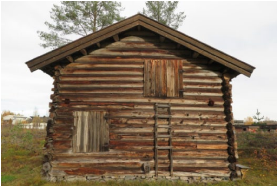
Ria fra Revholtet, Glomdalsmuseet.

Vi viser til utsendt fredningsforslag for ria fra Revholtet på Glomdalsmuseet gnr./bnr. 202/1, Elverum kommune, datert 4.11.2019. Fredningsforslaget har vært på høring hos berørte parter og instanser.