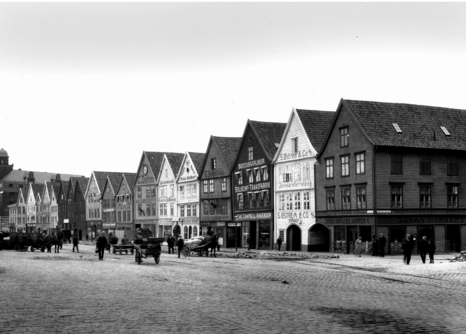
↑ Bryggen slik den var før brannen i 1955.