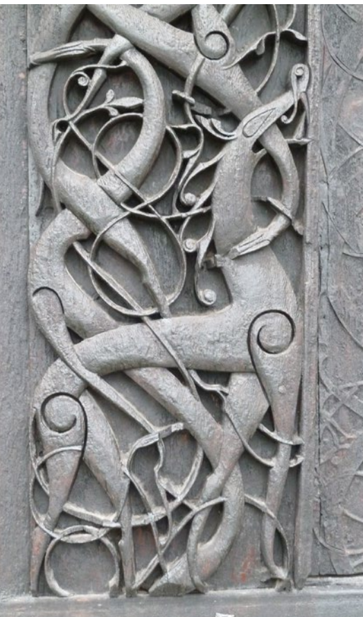
↑ Detalj av dyremotiv frå portalen på nordveggen.