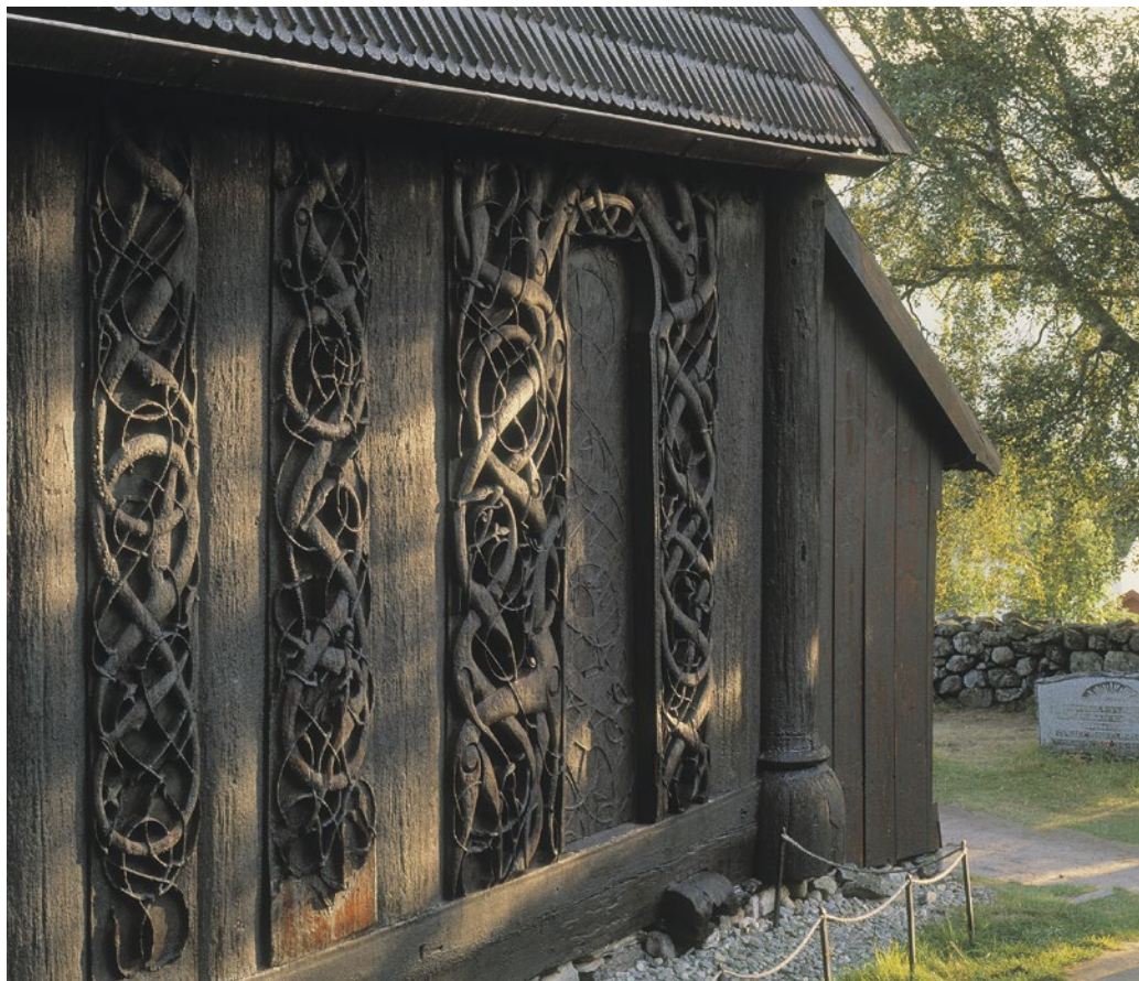
➤ Portalen og dei to utskårne veggtilane på nordveggen.