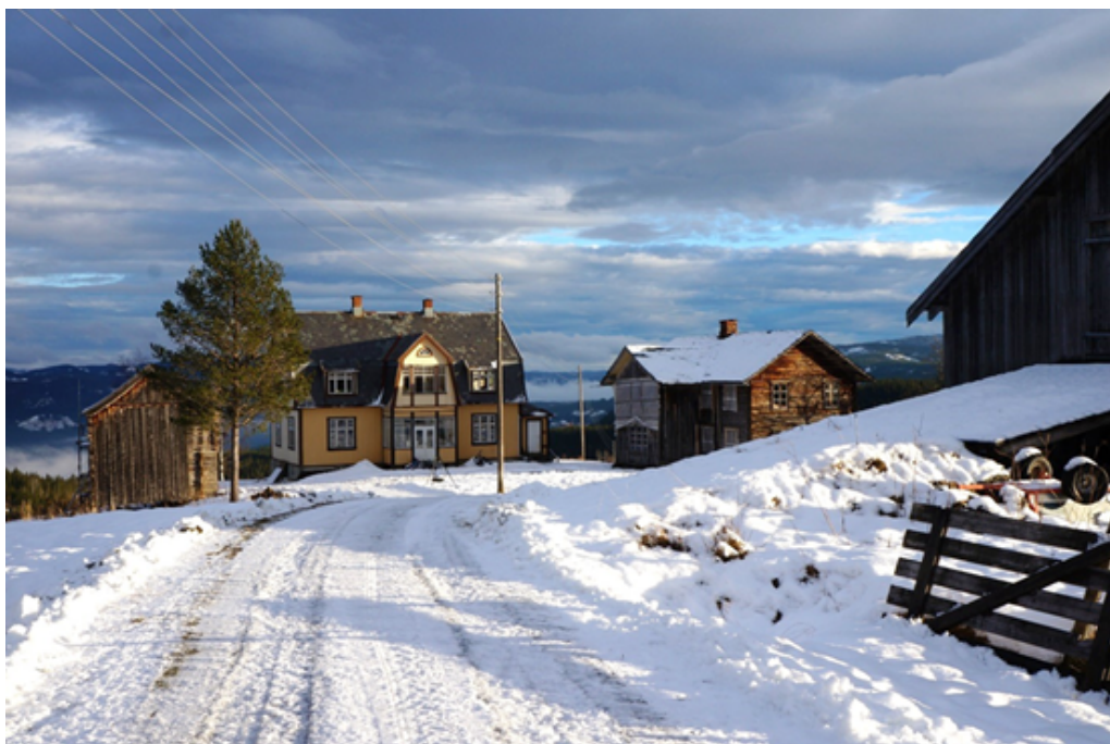
Breie gård.

Vi viser til utsendt fredningsforslag for Breie gård datert 13.03.2020 som har vært på høring hos berørte parter og instanser. På grunnlag av dette fattet Riksantikvaren følgende vedtak: