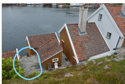
Bilde 1 Område 3 – sett ovenfra og fra sjøen

Ifølge fylkeskommunen, var området mellom bryggerhus/utedo og nabo tidligere naturlig grunn bestående av fjell og gress. Dette området er blitt tildekket med betong og stein (bilde 1). Det er avrettet med stein på bryggekannten mot nabo, og det er etablert trapp bestående av større grove steinheller ned mot sjøen (bilde 2 og 3). Fylkeskommunen mener at dette tiltaket medfører en betydelig endring av miljøet rundt bygningene, i tillegg til at det også er skjemmende for kulturmiljøet.