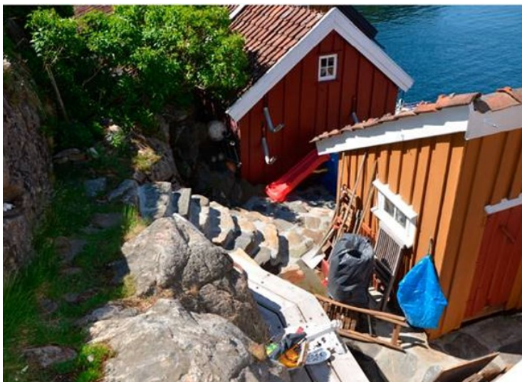
Område 2 – trapp.

Fylkeskommunen viser til at arbeidet med muren ikke er utført i henhold til antikvariske prinsipper, og at både muren og den nye trappens utseende er vesentlig annerledes enn den opprinnelige.