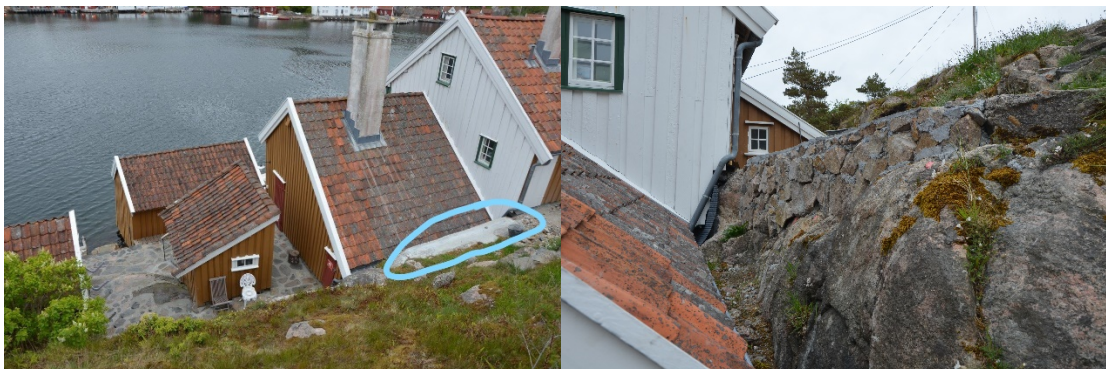
Område 2 – mur.

Opprinnelig støpt mur med naturstein er delvis revet, og erstattet av en ny og bredere mur i betongstøp. Opprinnelig mur var relativt tynn og bestod av betong iblandet noe mindre stein. Muren er utvidet med omtrent 20 cm i tykkelse, og det er benyttet betong med finere sand.