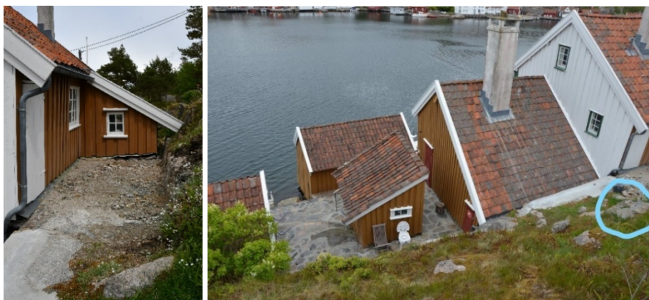
Område 1 – terrenngingrep og trapp/tråkksteiner.

Gammel støpt støttemur bak bygningen og deler av fjellet er fjernet. Området er planert ut og det er murt opp steintrapp opp til areal i bakkant. Fylkeskommunen vurderer endringen av terrenget og fjerning av fjell som et svært alvorlig tiltak i kulturmiljøet, som medfører en vesentlig endring av det naturlige landskapet.