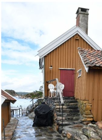
Område 4 – trapp og dekke mot sjøhus.

Fylkeskommunen er av den oppfatning at tiltakene, slik de er utført, avviker sterkt fra det som ble omsøkt i 2016 og at dette vanskeliggjør lesbarheten av anlegget. Da denne siden av eiendommen er tydelig eksponert mot sjøen, anser fylkeskommunen tiltakene som ekstra alvorlige.