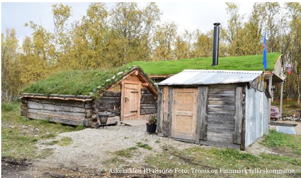
Askeladden ID 181066

Fjøset (til venstre i bildet) og tilbygget (til høyre i bildet) som fredes. Tidligere var bygningene sammenbygget, men i forbindelse med istandsetting er tilbygget flyttet. Bygget bak inngår ikke i fredningen.