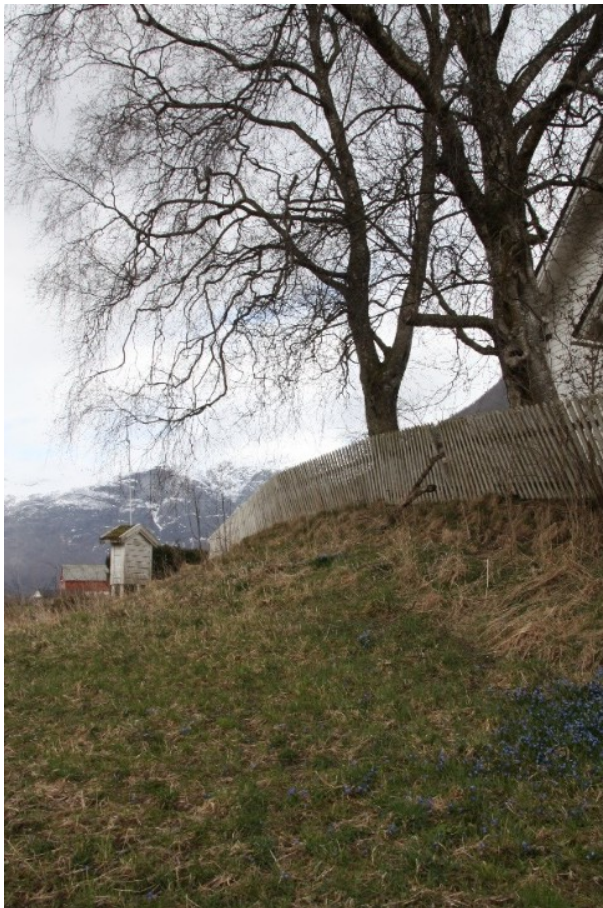
inngangen til Studio.