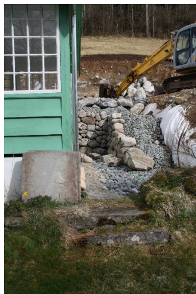
Figur 24. Bakkemur ved sida av bungalowen. Muren er under reparasjon.