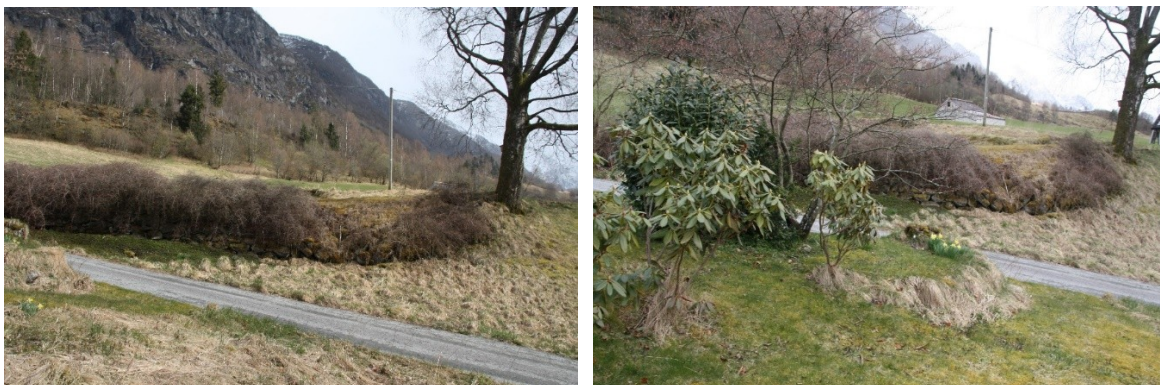
Figur 58 og Figur 59 Bakkemur med hekk ved parkeringsplassen.