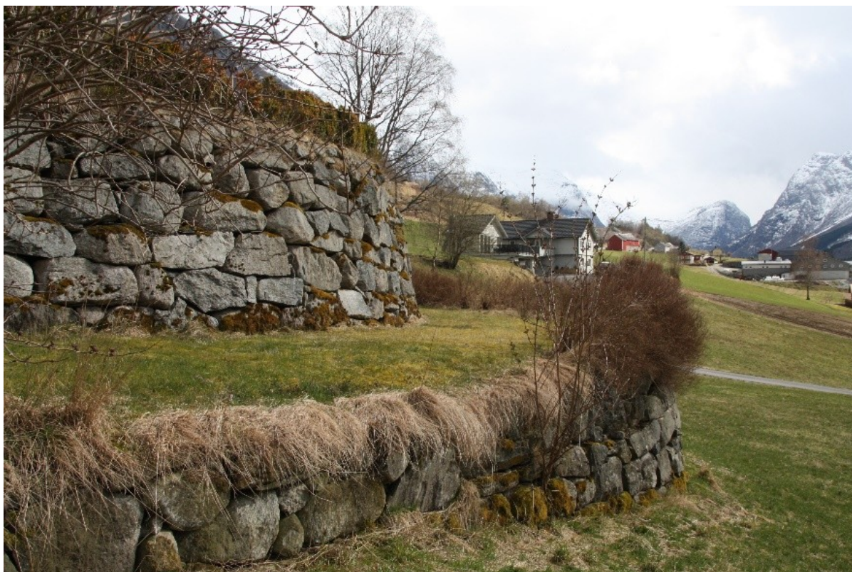
Figur 43. Øvre og nedre terrasse der bakkemurane svingar inn langs sørsida av villaen.

Nedre terrasse fylt øvre terrasse men ligg på eit lågare nivå i terrenget og mot vest vert den avslutta omlag midt på villaen. Terrassen er bygd opp av ein mur i stein med ein hekk langs delar av toppen. Muren har ulik høgde men er omlag 2-2,5 meter høg på det høgste, på vestsida skråar den inn i terrenget. Sjølv terrasse er ikkje meir enn omlag 4 meter brei og i dag er det også ein hekk i sør som veks opp langs muren til øvre terrasse.