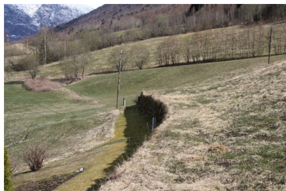
Figur 5 og Figur 6. Bakkemuren ved den gamle bygdevegen nedanfor Dalheim.