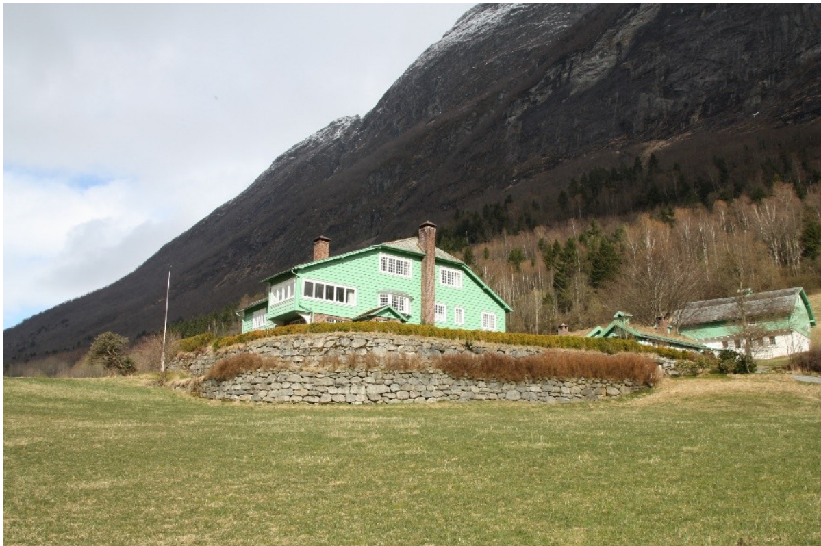
Figur 35. Villaen med øvre og nedre terrasse sett frå vegen.

Hageanlegget nærast villaen kan delast inn i ulike soner. Terrenget var opphavleg bratt og det vart difor gjort mykje arbeid med å terrassere hagen slik at ein fekk fleire til dels større flatare parti omkring villaen. I denne delen av hagen står fleire små hus som var viktige for drifta av Dalheim og dei utgjør ein viktig del av heilskapen til denne delen av hagen.