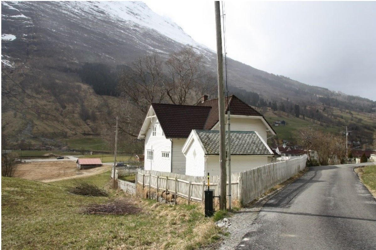
Figur 62. Studio og mausoleet sett frå vegen opp til villaen.