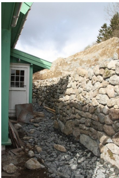
Figur 23. Bakkemur på baksida av bungalowen. Muren er under reparasjon.