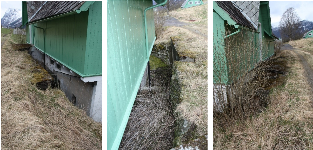
Figur 32, Figur 33 og Figur 34. Vegen på oppsida av låven med inngang til låven under arka.

Her er framleis espaliera på plass der det tidlegare vaks klatreplanter.