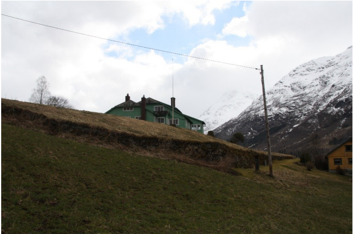
Figur 3. Dalheim sett frå den gamle bygdevegen. Biletet viser både bakkemuren som går opp til vedhuset og bakkemuren langs den gamle bygdevegen.

Bakkemuren er sett opp i eigedomsgrensa i nedre del av anlegget langs den gamle bygdevegen. Muren fyl den gamle bygdevegen og kjem inn til dagens veg til nabohusa i sør. Ved å bygge den høge bakkemuren i nedre kant av eigedomen vert heile eigedomen løfta opp i forhold til naboegedomane. Muren er bygd i stein og tilpassa terrenget med ulik høgde, den er lågast i sør, der den er omlag ein meter høg, og høgast i eigedomsgrensa mot nord der den er ca. to meter høg. Den er omlag 65 meter lang.