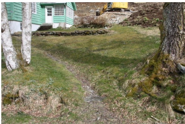
Figur 19. Sti opp frå vegen til inngangen til bungalowen.