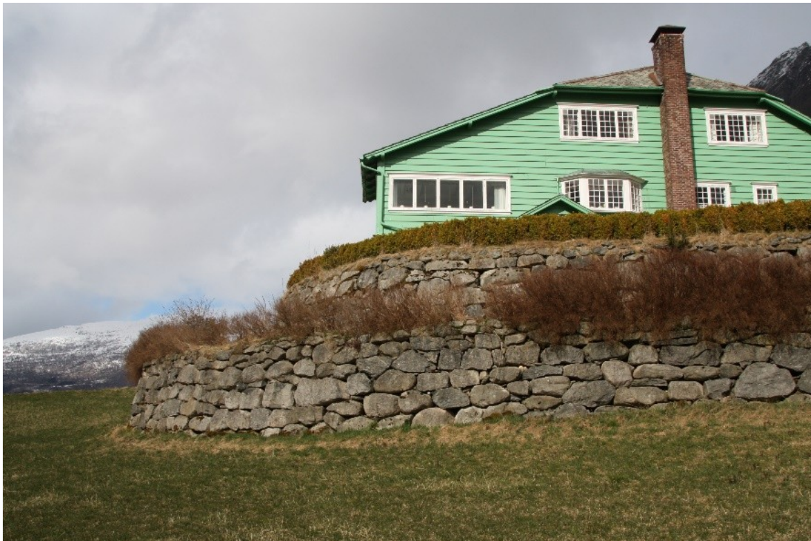
Figur 48. Bakkemur til nedre terrasse sett mot villaen.