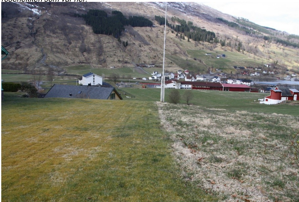
av hagen sett ut mot dalen.