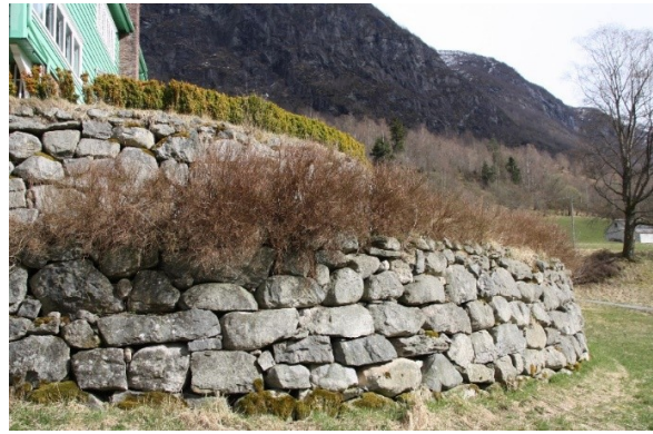
Figur 46. Nedre terrasse, parti med hekk på begge sidene av terrassen. Figur 47. Detalj av bakkemur med hekk på nedre terrasse.