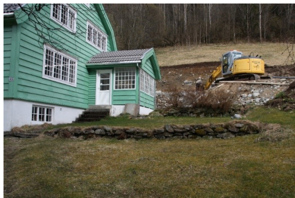
Figur 20. Bakkemur i hagen til bungalowen.