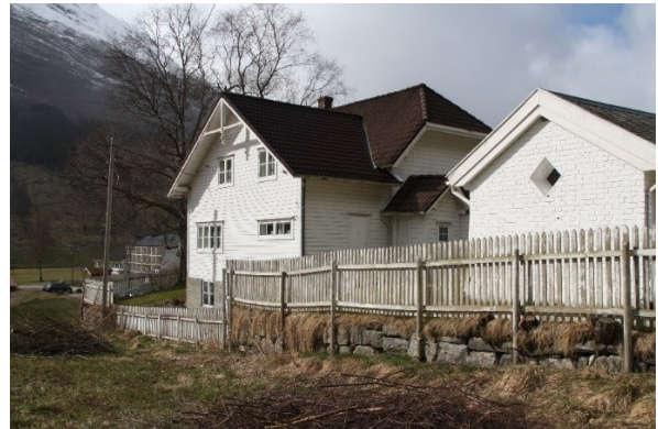
Figur 65. Bakkemur med stakitt og to bjørketrær framfor inngangen til Studio. Figur 66. Bakkemur med stakittgjerde langs sørsida av hagen til Studio og mausoleet.