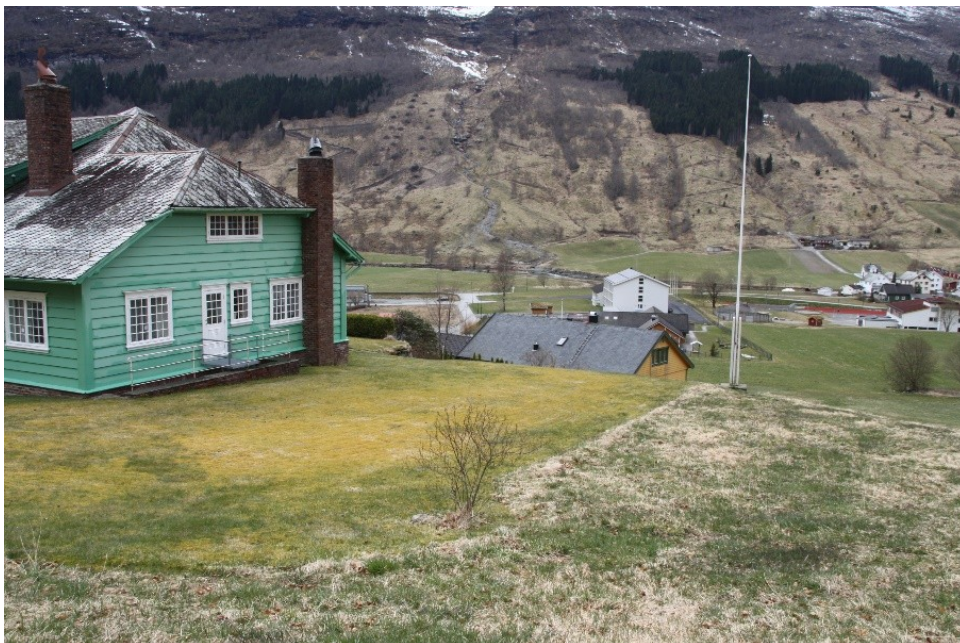
Figur 49. Nordre del av hagen sett frå bæn ved vedhuset. Rosebusk omlag midt i bildet kan ha vore ein rest av den gamle rosehekken som var her.

Den nordlege delen av hagen skrår nedover og består i dag i hovudsak av plen og slåtte­mark. Tidlegare var det her ein rosehekk med blomsterrabatt som avgrensa hagen mot nord og ramma inn denne delen av hagen. Rosehekken gjekk sannsynlegvis der vi i dag har overgang mellom plen og slåtte­mark, og så runda den seg innover mot villaen på innsida av flaggstanga. Rosehekken er i dag vekke. Det står att ein rosebusk der hekken sannsynlegvis gjekk og det kan vere at den er ein rest etter den opphavlege rosehekken. Tidlegare gjekk det stiar gjennom denne delen av hagen opp til drivhusa og til austsida av hagen