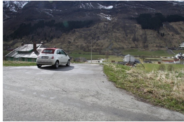
Figur 15. Fundament til drivhus og bakkemur ved drivbenkane sett mot driftsbygningen. Figur 16. Snuplass ved vedhuset på det området der det tidlegare stod drivhus.