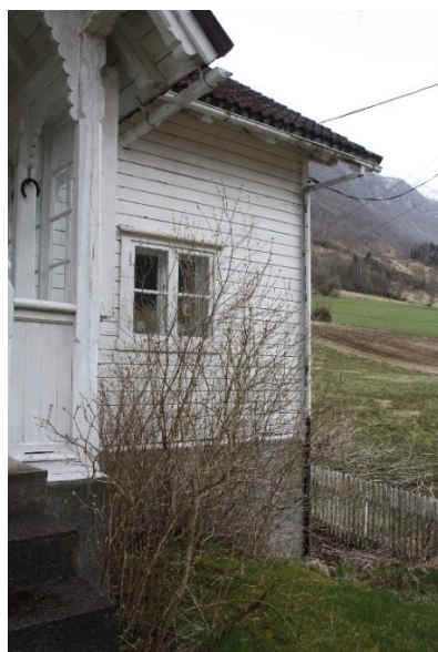
Figur 71. Hagen med steintrapp opp til grinda. Figur 72. Hagen langs tilbygget til Studio. Figur 73. Hage ved inngangsdøra til Studio.