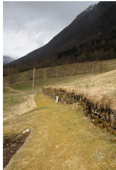
Figur 7, Figur 8 og Figur 9 Bakkemuren ved den gamle bygdevegen. Figur 8 viser parti på muren som held på å sige ut og har behov for istandsetjing.