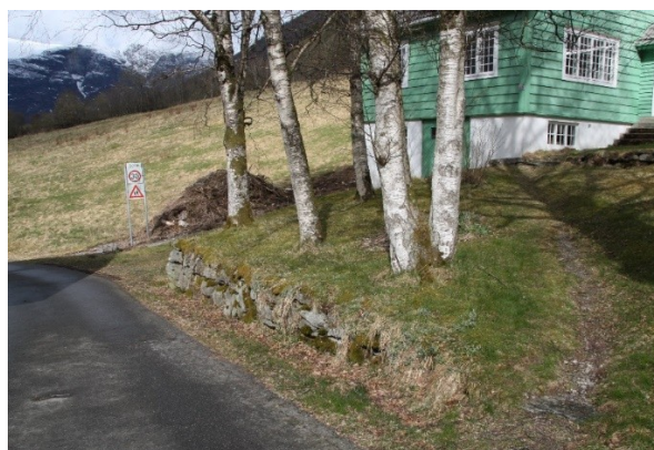
Figur 22. Nedre del av hagen til bungalowen, med bakkemur, trær og sti.