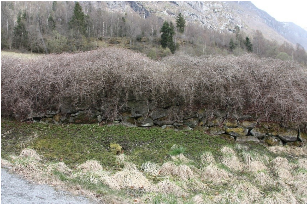
Figur 60. Detalj av bakkemur med hekk ved parkeringsplassen.