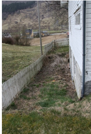
Figur 68. Mausoleet sett frå grinda inn i hagen. Figur 69. Hagen mellom mausoleet og Studio. Figur 70. Hagen langs tilbygget til Studio.