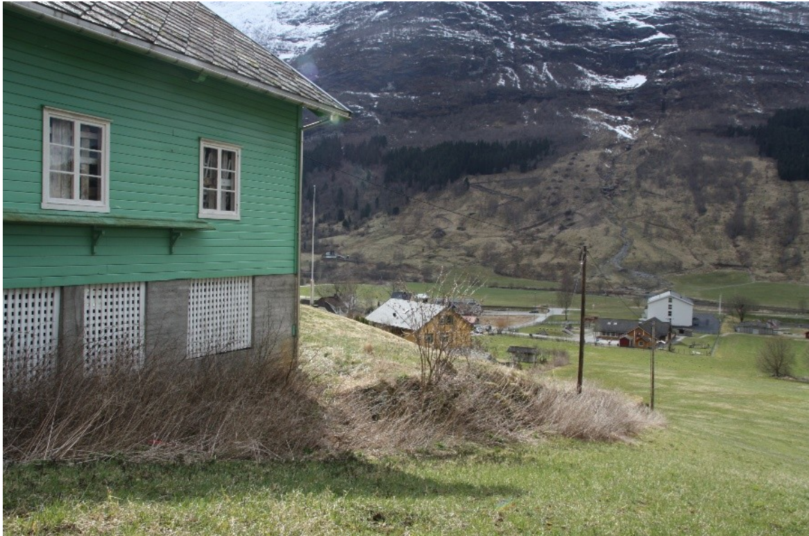
Figur 10. Bakkemuren sett frå naboiegdomen oppe ved vedhuset.

Bakkemuren fyl eigedomsgrensa frå bygdevegen og opp til vedhuset. Muren har ulik høgd og er høgast nede ved bygdevegen. Oppe ved vedhuset sluttar muren og frå vedhuset er terrenget likt mellom Dalheim og naboiegdomen. Der bakkemuren er bygd er terrenget ved Dalheim heva oppover terrenget til naboiegdomen. Muren er i stein og har ulik høgde og er høgast nede ved bygdevegen der den er omlag 2 m. høg. Oppe ved vedhuset vert den vesentleg lågare og går inn i høgde med kjellaren til vedhuset. Muren er omlag 50 meter lang.