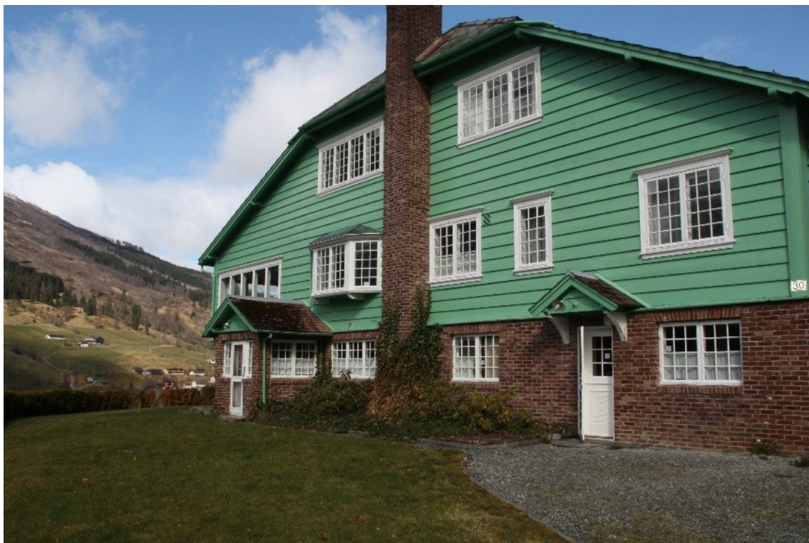
Figur 36. Tunet med kjøkkeninngangen.

etter den i terrenget nokon stader. Det var tidlegare mykje blomar i denne delen av hagen og vi finn framleis att restar av blomebed langs ytterveggane på villaen. Ved pipa mot sør var det planta eføy som dekkja heile pipa. I dag er delar av denne eføyen fjerna og den rekk kun opp til første etasje.