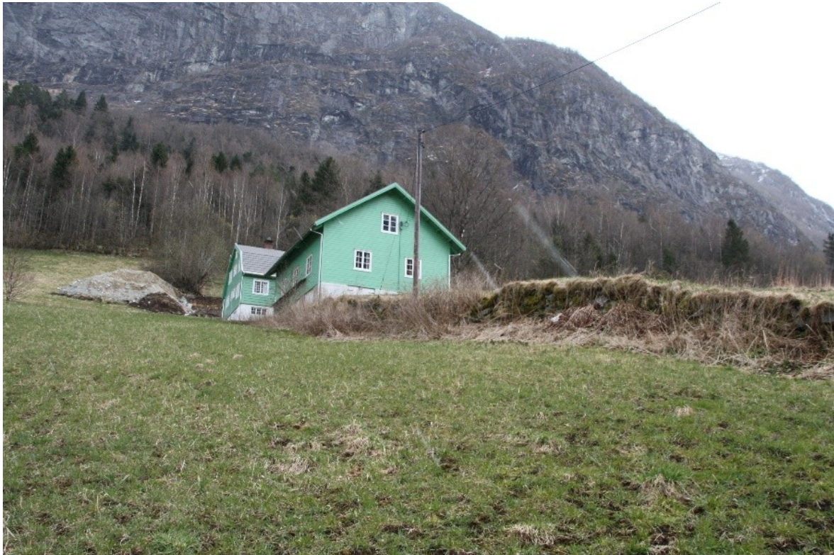
Figur 11. Bakkemuren sett fra den gamle bygdevegen og opp mot vedhuset.