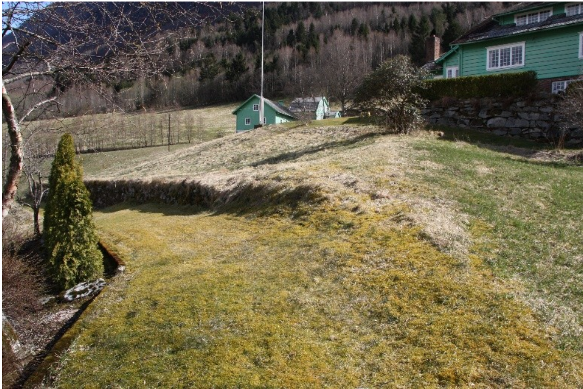
Figur 4. Den gamle bygdevegen på nedsida av Dalheim og starten av muren på oppsida av bygdevegen.