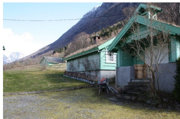
Figur 52. Austsida av hagen med stabburet, drengestova og kafeen. Figur 53. Austsida av hagen sett frå tunet ved kafeen.