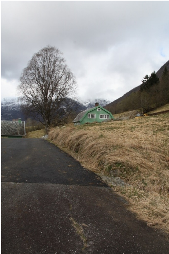
Figur 26. Bakkemuren sett frå driftsbygningen.

Langs vegen mellom bungalowen og driftsbygningen er det på oppsida av vegen ein mur i stein som er omlag ein meter høg og omlag 50 meter lang. Opphavleg var det planta blomar på toppen av muren, i dag er det her slåttemark.