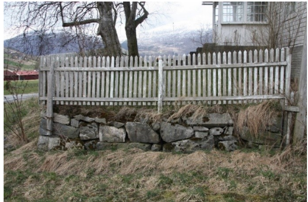
Figur 63. Bakkemuren med stakitt framfor inngangen til Studio. Figur 64. Bakkemur langs sørgrensa av hagen rundt studio.