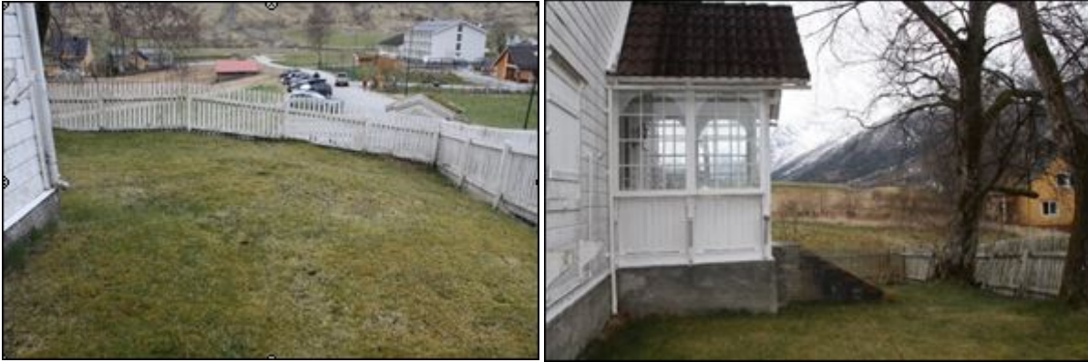
Figur 74. Hagen sett frå langveggen ut mot dalen. Figur 75. Inngangspartiet til Studio med dei to bjørketrea tilhøgre.