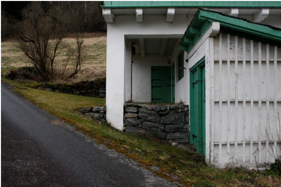
Figur 28. Dei ulike murane ved inngangspartiet til fjøset.

Vegen mellom tunet, driftsbygningen og bungalowen kryssar ved driftsbygningen og her er det mura opp fleire steinmurar for å tilpasse terrenget til bygningen.