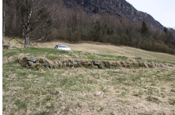
Figur 13. Betongfundament til drivhus til venstre og hjørnet av bakkemur ved drivbenkane til høyre. Figur 14. Bakkemur ved drivbenkane.