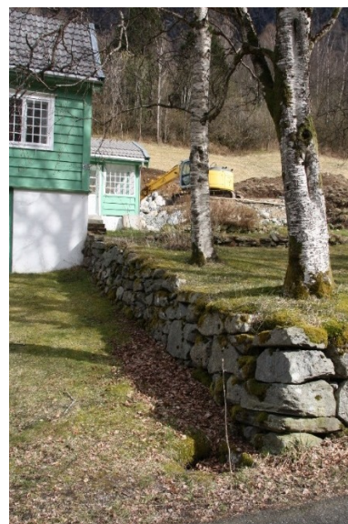
Figur 25. Bakkemur som avgrensar hagen ved bungalowen. På det låge nivået er inngang til kjellaren til bungalowen.