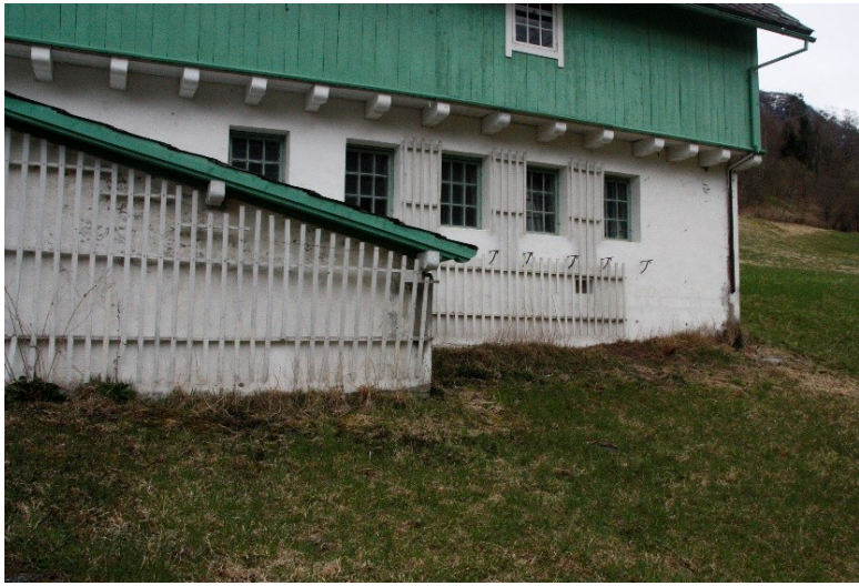
Figur 31. Framsida av driftsbygningen.

Her er framleis espaliera på plass der det tidlegare vaks klatreplanter.