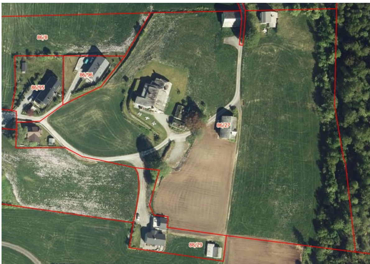
Figur 1. Utklipp av flyfoto frå www.fylkesatlas.no

Tala i kartet til figur 2 refererer til omtalane av dei ulike delane av hagen. Der det ikkje står noko anna, er alle bilete tatt i 2021 av Arlen Bidne/VLFK