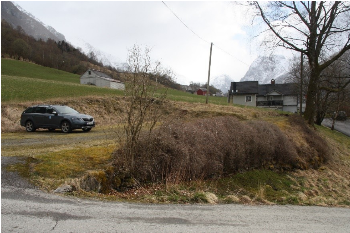
Figur 57. Parkeringsplassens sett mot paktarbustaden.

I dag er det etablert ein parkeringsplass oppe ved tunet sør for kafeen. Området med dagens parkeringsplass vart tidlegare mellom anna nytta til tørking av klær. På nedsida av parkeringsplassen er det bilveg bort til nabohuset, som var opphavleg bygd som paktarbustad. Opphavleg var vegen til paktarbustaden ein forlenging frå parkeringsplassen og det er framleis ein gangveg her. Mellom vegen og parkeringsplassen er det ein bakkemur i stein med hekk på delar av toppen. Det er usikkert når muren vart bygd, måten den er mura opp på samt eldre bilete tyder på at den har vore ein del av det opphavlege hageanlegget, men det er vanskeleg å sei med sikkerheit når muren vart bygd.