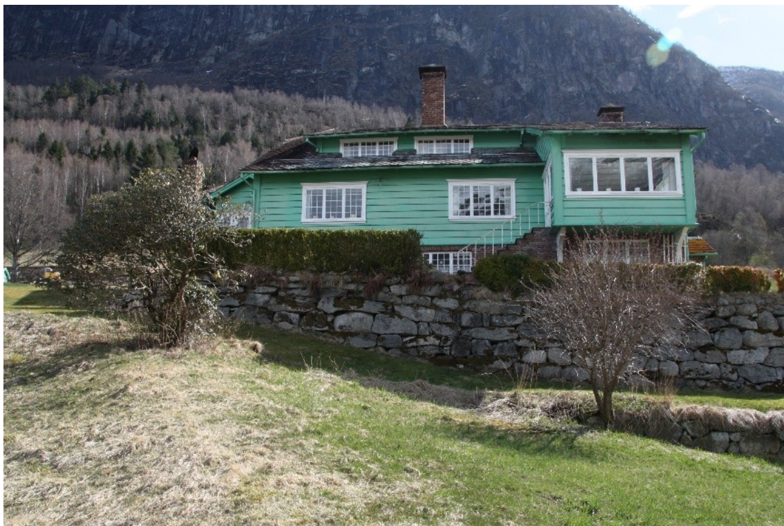
Figur 37. Fasaden mot dalen med muren til øvre terrasse. Til høgre ser vi byrjinga av nedre terrasse,