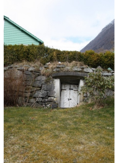
Figur 40. Trapp opp mot øvre terrasse og hovudinngangsdøra. Figur 41. Bakke muren ved øvre terrasse sett fra nedre terrasse. Figur 42. Inngangsdør til jordkjellar under øvre terrasse.