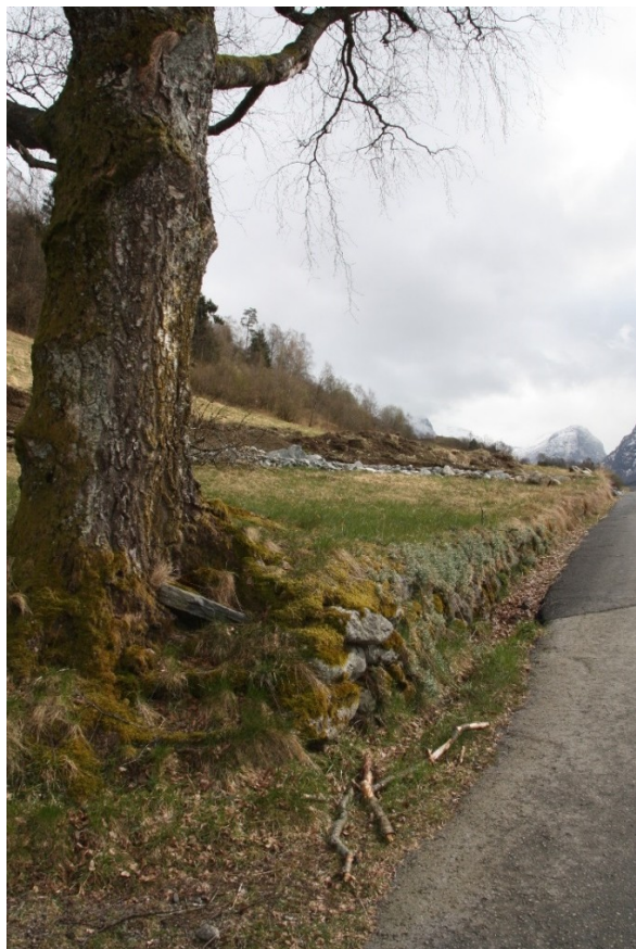
Figur 27. Bakkemuren sett frå bungalowen mot driftsbygningen.