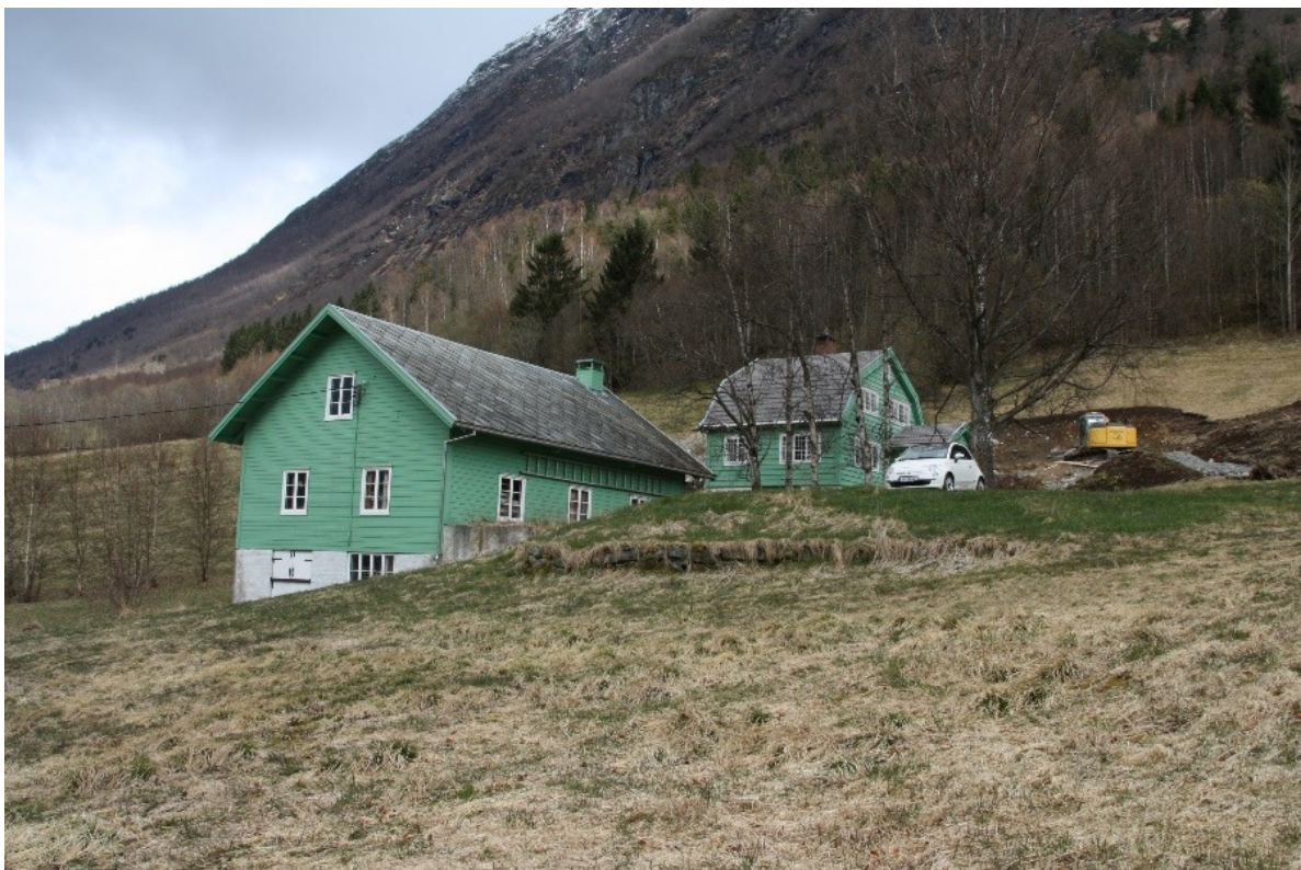
Figur 12. Oversiktsbilete som viser restane av betongfundamenta til drivhuset inntil vedhuset og bakkemuren framfor der det tidlegare var drivbenkar.

Fundament til drivhuset ved langveggen går eit stykke opp på kledningen og skrår inn i terrenget mot vest. Muren ved drivbenkane er omlag ein meter høge nærast vedhuset, mot driftsbygningen skrår muren inn i terrenget. Fundamentet til drivhuset er omlag 2,5 meter langt mot vest. Muren til drivbenkane er omlag 12 meter lang. Fundamentet til drivhuset langs langveggen på vedhuset er i betong. Muren ved drivbenkene er framleis synleg og er i stein.