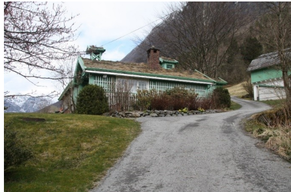
Figur 54. Fundamenta etter ishuset som stod mellom stabburet og kafeen. Figur 55. Kafeen med vegen som går vidare opp til driftsbygningen og bungalowen.