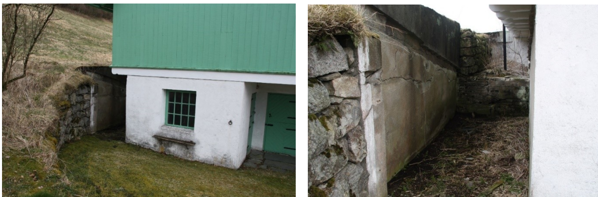
Figur 29. Inngangspartiet ved fjøset, med muren mot vegen og betongmuren som var vegg til eit lagerrom. Figur 30. Biletet til venstre viser rommet mellom vegen og driftsbygningen, vi ser her merkene etter kvar taket på lagerrommet var.