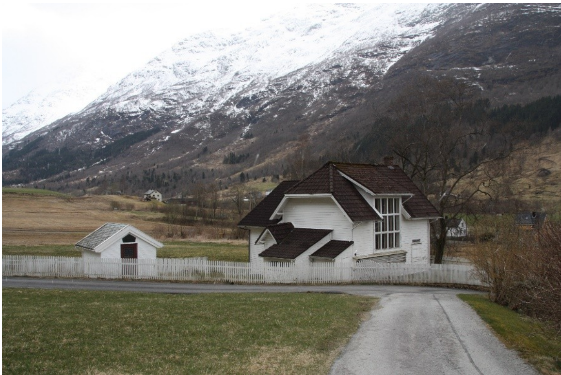
Figur 61. Studio og mausoleet sett frå vegen til naboegedomen.

Mausoleet og studio er i dag omgitt av ein grøn plen. Heilt vest i hagen er det framleis att to løvtrær samt nokon busker. Mot sør langs tilbygget ligg hagen på eit lågare nivå enn resten av tomta og denne delen er avgrensa av to murar i stein ein mot aust og ein mot vest.