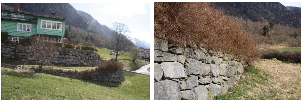
Figur 44. Øvre og nedre terrasse sett mot parkeringsplassen. Figur 45. Bakkemur til nedre terrasse med hekk på toppen.