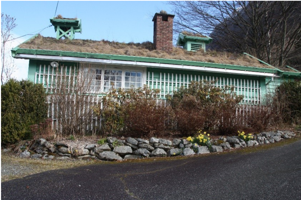
Figur 56. Kafeen med oppmura blomsterbed og vegg kledd med espalier for klatrevekstar.