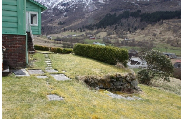
Figur 38. Øvre og nedre terrasse sett fra nedsida av hagen. Figur 39. Trapp opp mot hovudinngangen og hellelagt sti ved øvre terrasse.