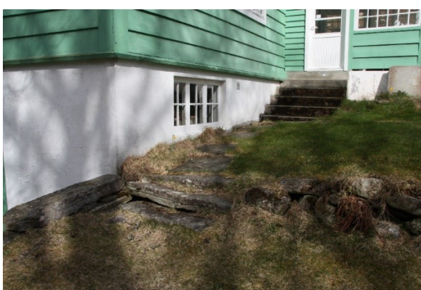
Figur 21. Trapp mellom to av nivåa i hagen til bungalowen.