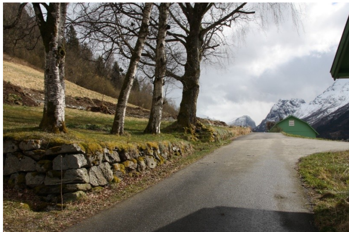
Figur 17. Bungalowen og vedhuset sett frå driftsbygningen. Figur 18. Hagemuren framfor bungalowen sett mot driftsbygningen.