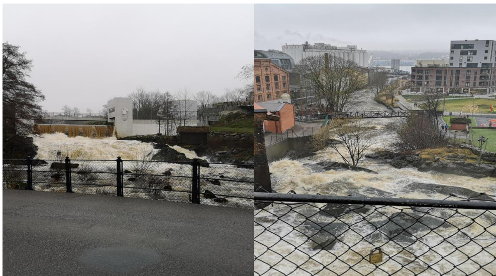
Venstre: Sikt fra Storebro mot demningen ved Sponvika. Høyre: Sikt fra Storebro mot Mossesundet

Sør for Mossefossen ligger Møllebyen med gamle fabrikkbygninger fra ca. 1850 og tidlig 1920-tallet som vitner om den viktige betydningen elva har hatt for utviklingen av Møllebyen. Området Verket, nord for elva, er under massiv utvikling. Hensynet til siktlinjer her er derfor viktig å ivareta.