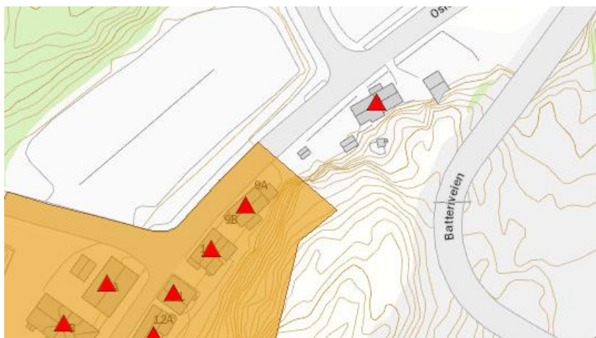
Dagens avgrensning av NB! området Verket. Verket 8 nordøst for de øvrig arbeiderboliger

Verket 8 ligger noen meter unna de øvrige arbeiderboligene, men har likevel en naturlig sammenheng med dette miljøet. Bygningen skal i følge kommunen være oppført på 1700-tallet og er SEFRAK-registrert. På eiendommen står også to eldre uthus. For å sikre helheten og sammenhengen med de øvrige arbeiderboligene og den historiske tilknytningen til Verket, støtter fylkeskommunen at eiendommen med tilhørende bygninger integreres i NB! området.