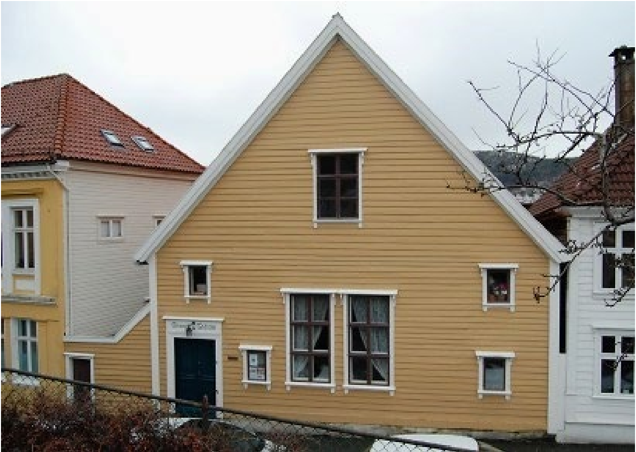
Stranges Stiftelse.

Vi viser til fredingsforslag for Stranges Stiftelse datert 22.03.2021 som har vore på høyring hos aktuelle partar og instansar. På grunnlag av dette fattar Riksantikvaren følgjande vedtak: