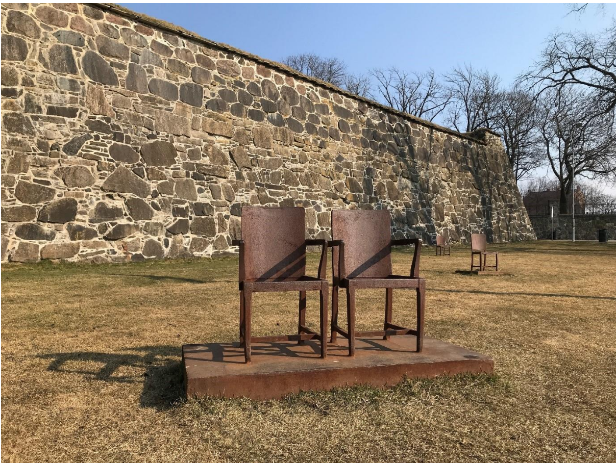
Antony Gormley: Site of Remembrance /Sted for erindring , 2000. ©Antony Gormley