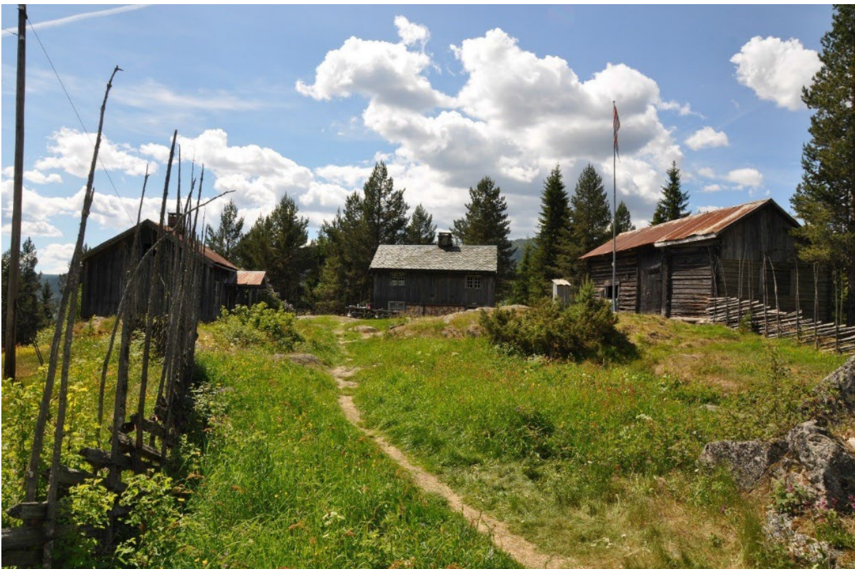
Bagnsbergene gard, august 2021.

Vi viser til forslag om fredning av Bagnsbergene gard datert, 30. juni 2021, som har vært på høring hos berørte parter og instanser. På grunnlag av dette fattet Riksantikvaren følgende vedtak: