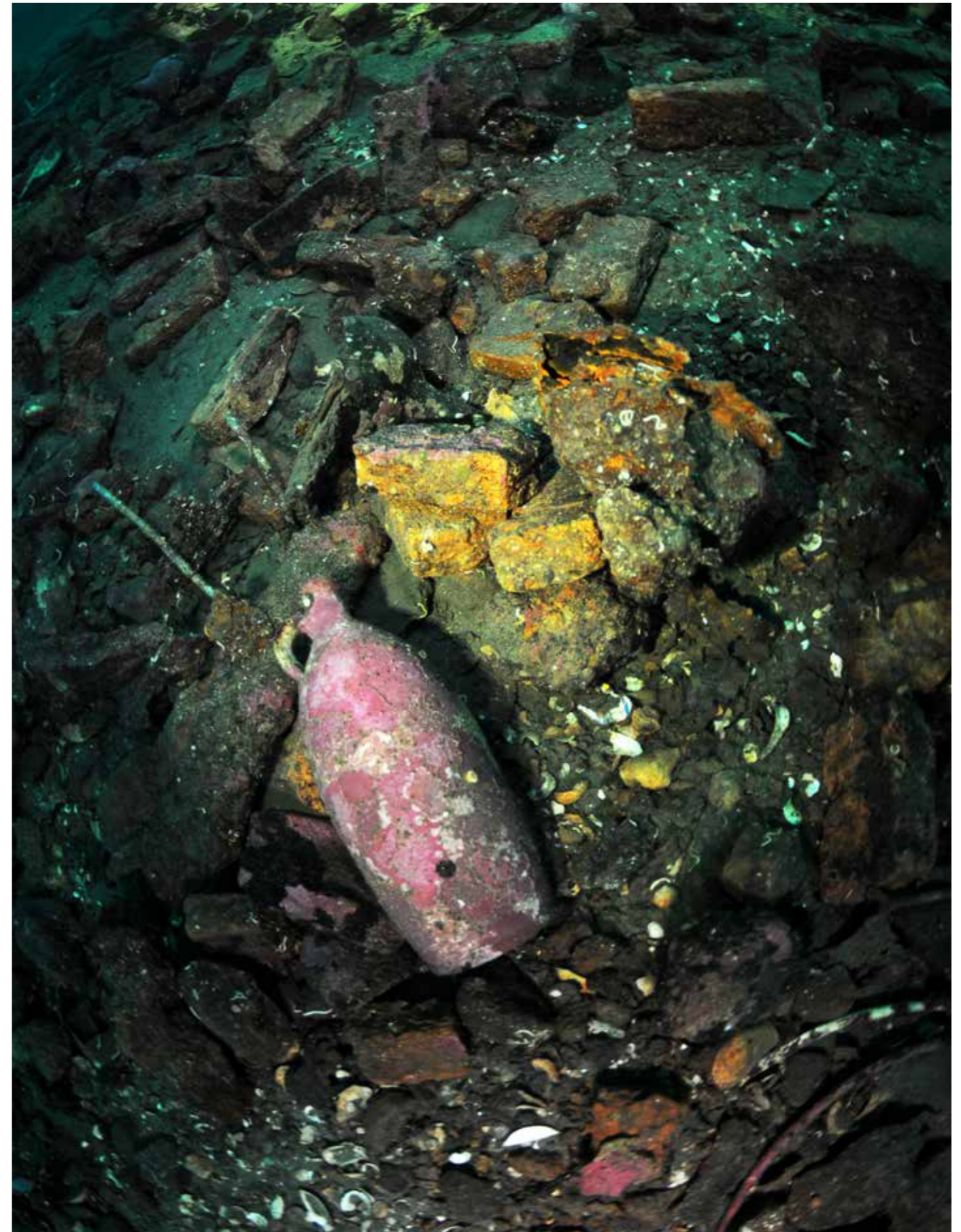
GALEASEN JUFFRAU ELISABETH sank i skjærgården utenfor Søgne i 1760. Søgne Etter flere år med frivillig leting fant Søgne dykkerklubb vraket våren 2019. Funnet ble meldt til museet, og de har i etterkant fått finnerlønn av Norsk maritimt museum. De har også fått tilskudd til grunnundersøking av Riksantikvaren.

Høsten 2021 intervjuet Riksantikvaren fylkeskommunene i forbindelse med revisjon av Riksantikvarens frivillighetsstrategi. 21 Det kom innspill om at det er viktig med god dialog mellom kulturminneforvaltningen og frivilligheten, men det ble også påpekt at det er viktig med «armlengdes avstand».