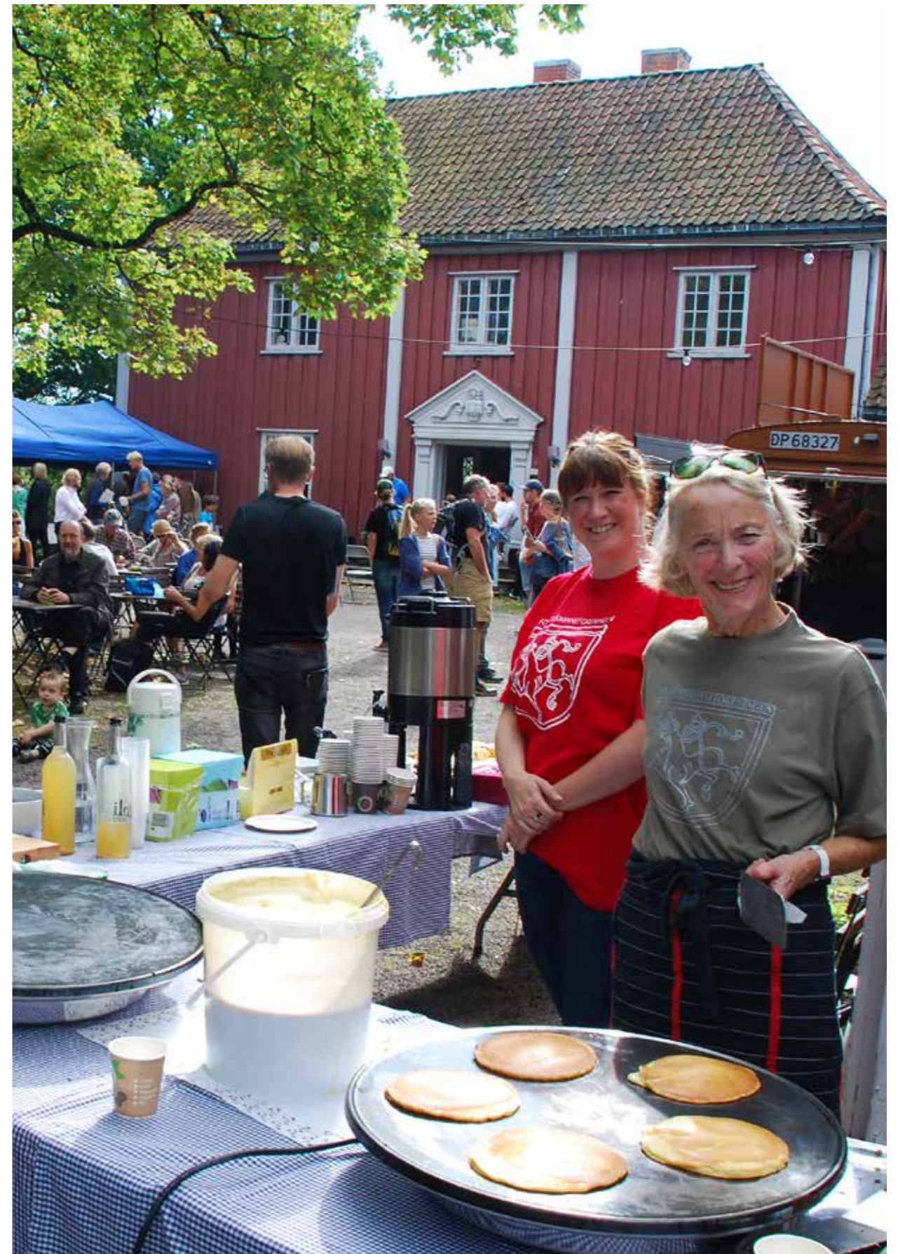
BYGNINGSVERNDAGEN PÅ VØIENVOLDEN i regi av Fortidsminneforeningen Oslo og Akershus. Frivillig innsats for kulturmiljø handler også om sosialt samvær, mat og drikke..

Også andre konvensjoner som verdensarvkonvensjonen, konvensjonen om immateriell kulturarv og Maltakonvensjonen er konvensjoner der frivillige organisasjoner og enkeltpersoner er gitt en viktig rolle. Europarådets rammekonvensjon om beskyttelse av nasjonale minoriteter pålegger også statene å legge forholdene til rette for at de nasjonale minoritetene kan uttrykke, bevare og videreutvikle sin kultur og identitet. Dette må videreføres i frivillighetsarbeidet. Riksantikvaren mener det er viktig å legge til rette for at den samiske befolkning og de fem nasjonale minoritetene og det flerkulturelle samfunnet blant annet blir naturlige parter i frivilligheten.