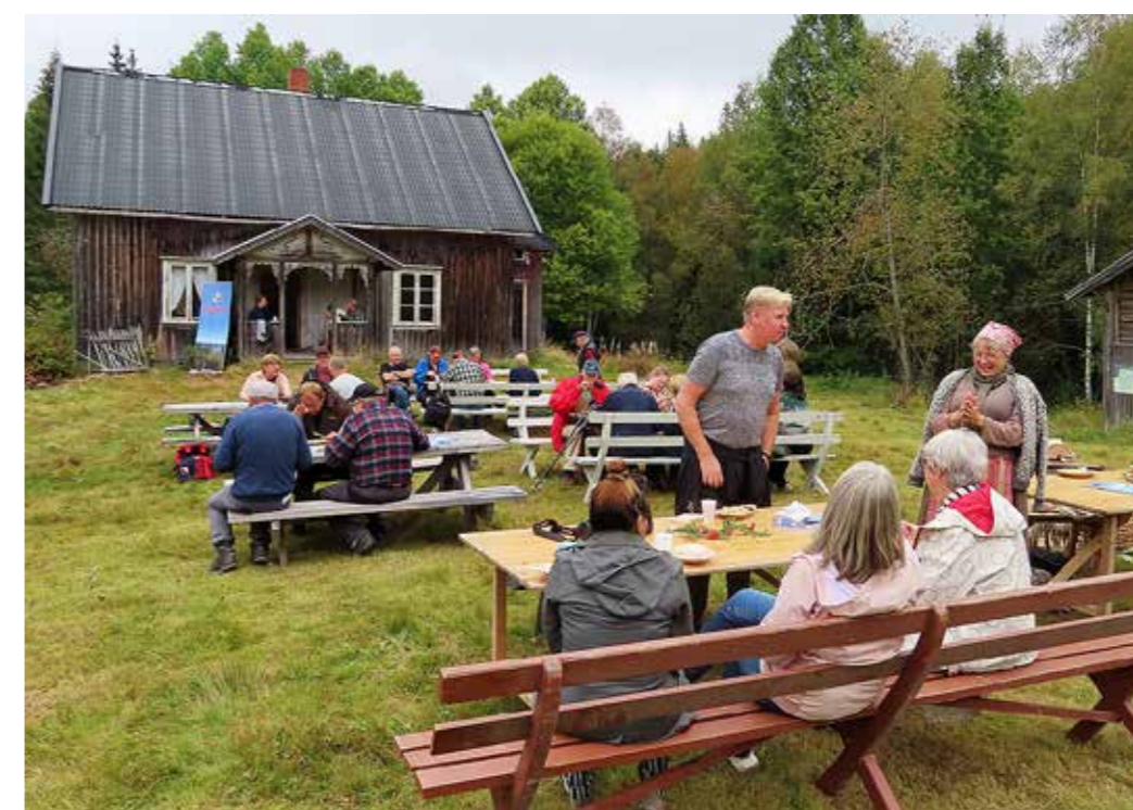
ABBORHØGDA: Arrangement under Kulturminnedagene på Abborhøgda i regi av Finnskogen Natur- og Kulturpark, Norsk Skogfinsk museum og Fortidsminneforeningen.