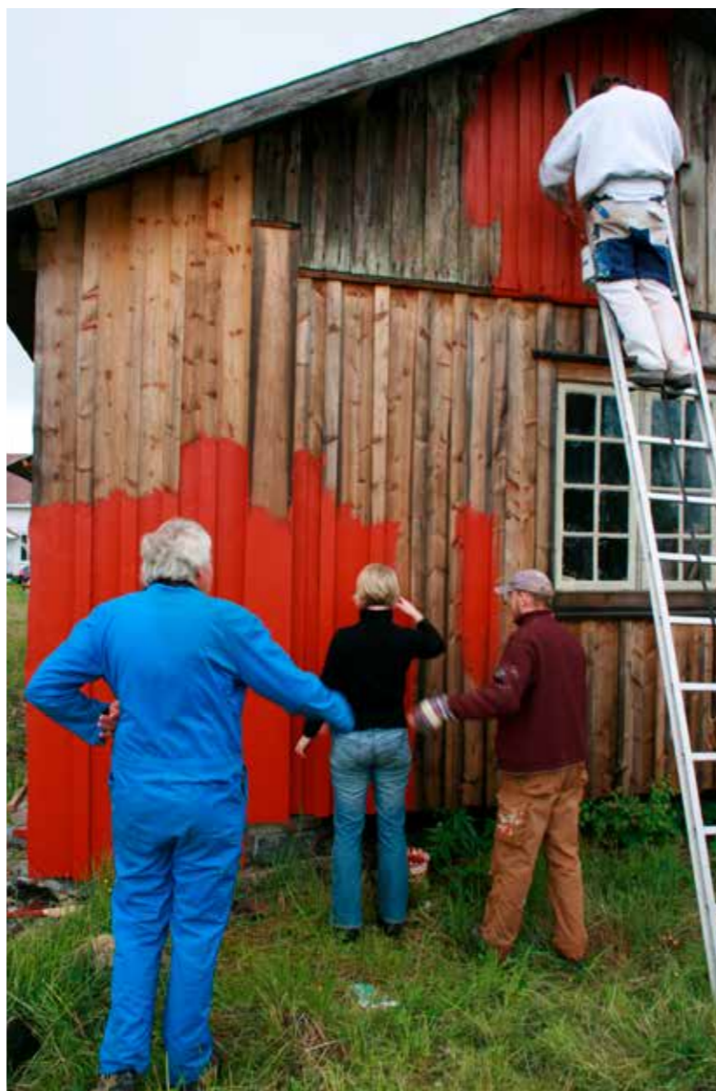
KURS I KOMPOSISJONSMALING i regi av Fortidsminneforeningen i Akershus.