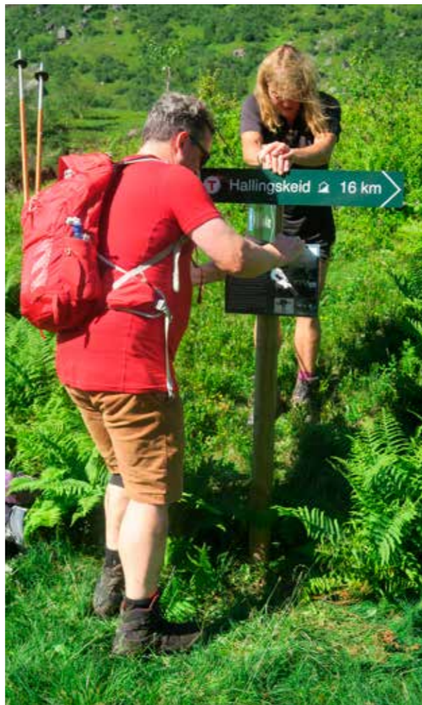
VISER VEI: Frivillige setter opp ny skilting på slepa Osa Hallingskeid.