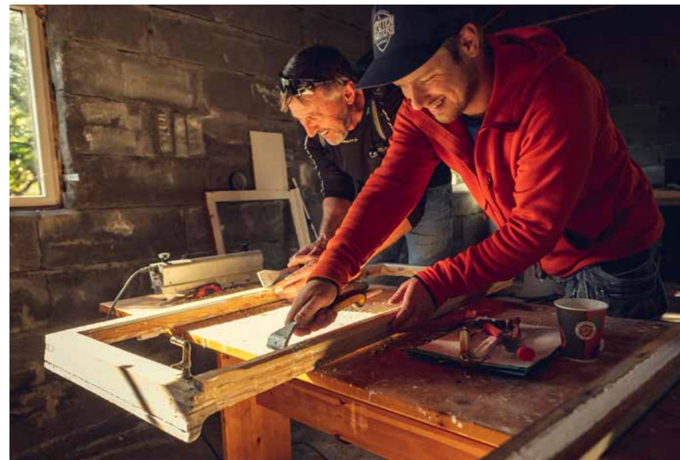
VINDUSRESTAURERING: Kurs i vindusrestaurering i regi av Fortidsminneforeningen.