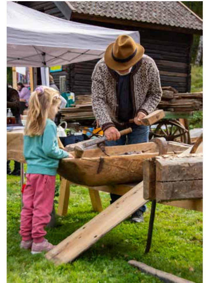
TRADISJONSHÅNDVERK: Fra åpningen av Kulturminnedagene 2021.

Forutsigbare økonomiske rammer for frivilligheten er viktig. Både stat, fylke og kommune gir bidrag til frivillig kulturvern, men private fond og stiftelser har