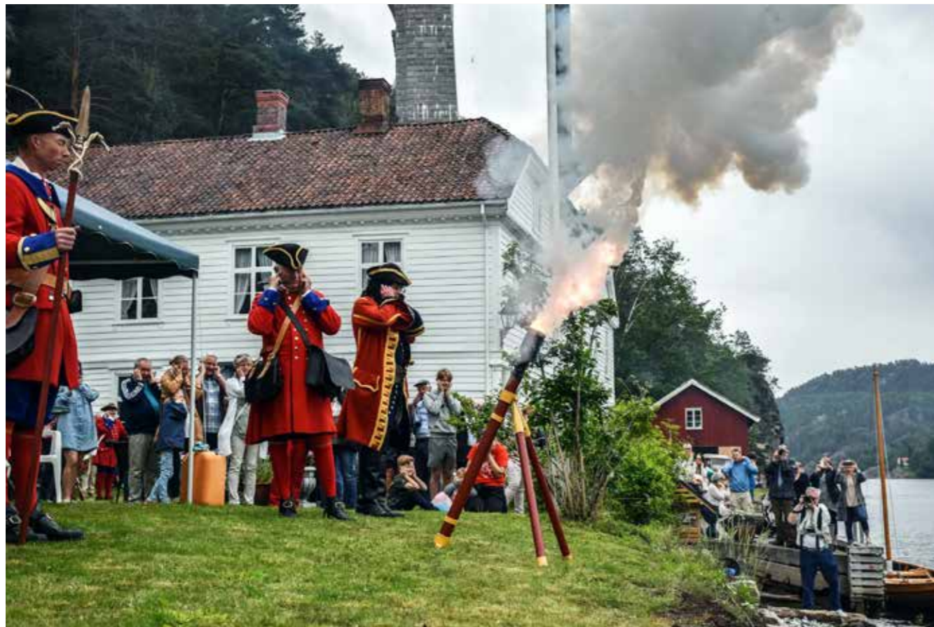
GAMLE SVINESUND er et eksempel på at frivillig innsats nytter. Fortidsminneforeningen avdeling Østfold startet bergingsaksjonen allerede tilbake i 1969. Huset ble berget fra forfall og er i dag i privat eie. Eier åpner for publikum ved utvalgte anledninger. Her fra foreningens jubileumsarrangement i 2019.

Videre ble det understreket at det er behov for ytterligere samordning og forenkling, at effekter av frivillighet bør dokumenteres og at det utarbeides eksempelsamlinger på gode samarbeidsprosjekter. Det ble pekt på at tilskudd og regionale støtteordninger som forutsetter eller samspiller med andre støtteordninger og generell grunnstøtte, er sentralt. I tillegg ble viktigheten av framsnakking og anerkjennelse av lokalt engasjement understreket fra fylkeskommunene.