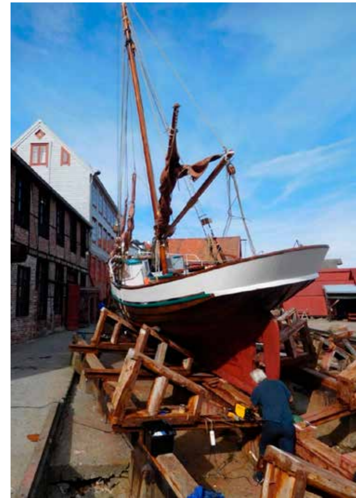
MELLEMVÆRFTET: Mellemværftet i Kristiansund. Et levende museum med betydelig frivillig aktivitet.

Den demografiske utviklingen tilsier at vi i de kommende år får en stadig større gruppe seniorer i samfunnet. Denne gruppen har ofte både evner, ressurser og tid til å delta i frivillig arbeid. For mange i denne aldersgruppen kan også frivillig arbeid gi hverdagen et meningsfullt innhold og sosialt fellesskap.