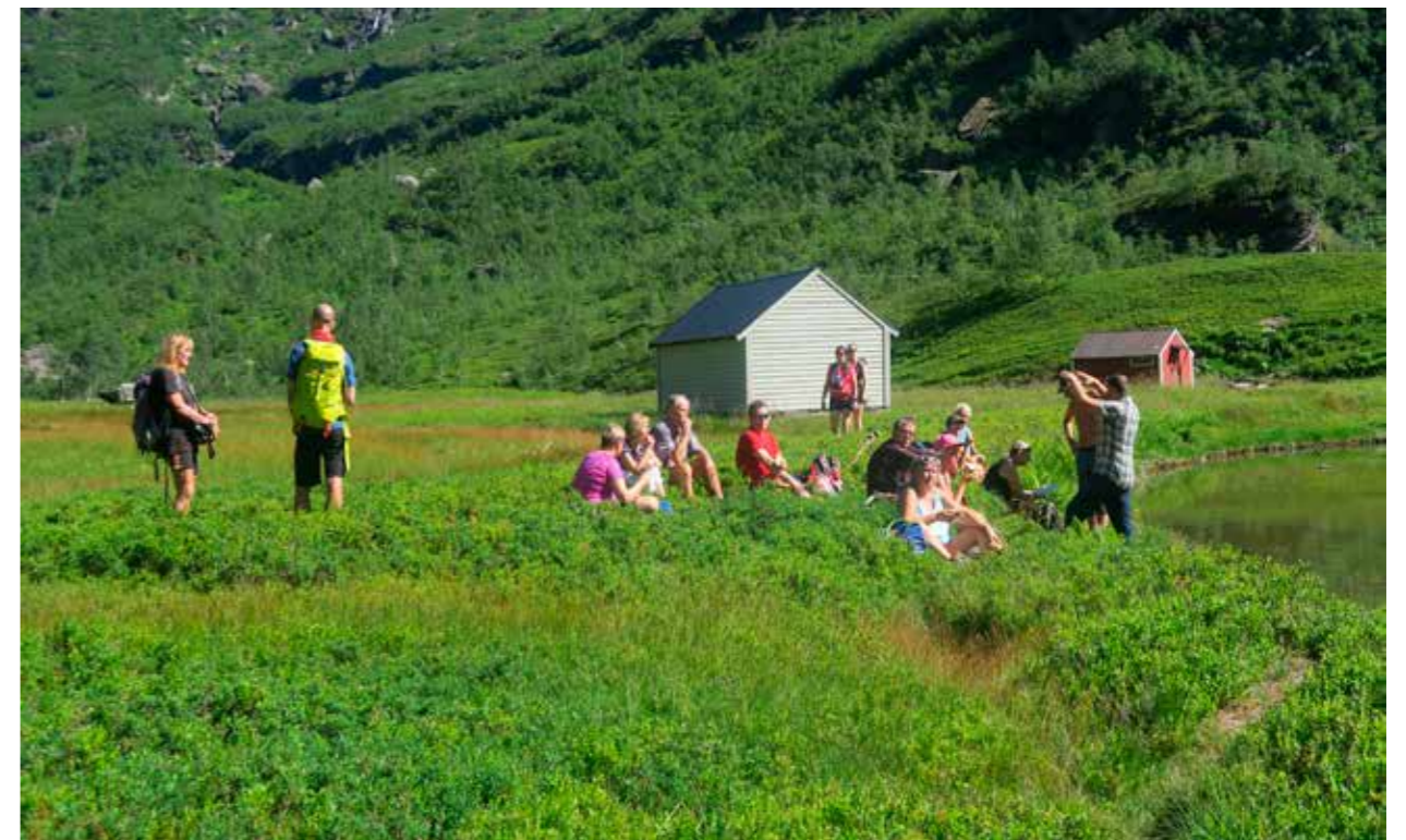
UTEN MAT OG HVILE DUGER HELTER IKKE. Frivillige tar seg en rast ved Ossete.

Riksantikvaren egen strategi påpeker at Riksantikvaren skal inneha ekspert- og rådgiverrollen og samfunnsaktørrollen. Direktoratet skal også tilrettelegge for engasjement og deltakelse. Videre skal vi søke nye måter å bruke kulturmiljø på for å skape lokal identitet og næringutvikling. Ved store utbyggingstiltak som innebærer omfattende arealinngrep som kan påvirke kulturminner, kulturmiljø og landskap, må avklaring av kulturmiljøverdiene skje i samarbeid med lokalmiljøene. Det vil legge grunnlag for gode løsninger og øke bevisstheten om kulturmiljøverdiene. Riksantikvaren skal utvikle bevaringsstrategier og frivillige organisasjoner blir viktig også i dette arbeidet. Alt dette er viktige faktorer hvor frivilligheten spiller en stor rolle, og er viktige arenaer som blir vesentlig for vårt videre samarbeid med frivilligheten.