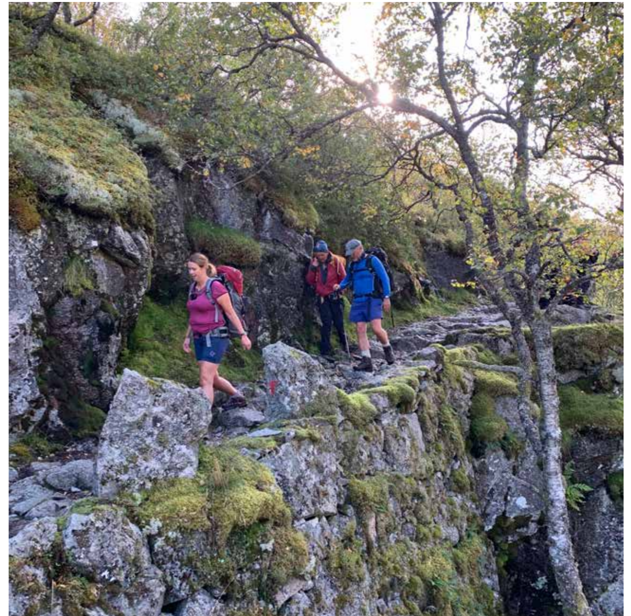
HISTORISKE VANDRERUTER er et samarbeidsprosjekt mellom Den norske Turistforeningen og Riksantikvaren. Uten betydelig frivillig innsats fra DNTs mange medlemmer ville det ikke vært mulig å gjennomføre dette viktige prosjektet. Her fra åpningen av den historiske vandrerruten Viglesdalen i Rogaland.

Flere høringsinstanser har oppfordret Riksantikvaren til å inkludere nye kategorier av kulturmiljø og kulturminner i ansvarsområdet for forvaltningen. Å inkludere nye kategorier av kulturminner i den offentlige kulturmiljøforvaltningens arbeidsfelt kan være et viktig virkemiddel for å inkludere nye grupper i frivillig arbeide. Stortingsmeldingen har vektlagt engasjement som et av de tre nasjonale målene. Engasjement kan være knyttet til å være opptatt av, og gjennomføre det som allerede er vedtatt innenfor «det etablerte kulturmiljøfeltet», men det kan også være knyttet til aktivitetsområder som i dag ikke ligger innenfor bl.a. Riksantikvarens ansvarsområde.