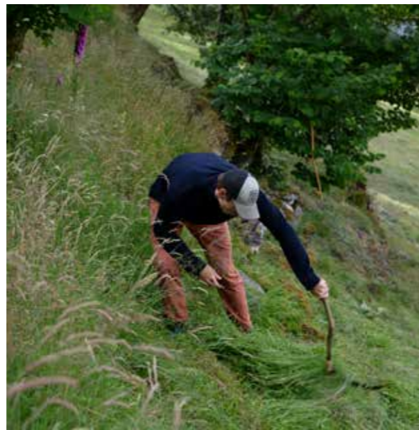
HAVRÅTUNET: Slått med stutturv på Havråtunet. Frivillig innsats er svært viktig mange steder for å holde kulturlandskapet i hevd.

Også den europeiske landskapskonvensjonen 10 påpeker viktigheten av å styrke enkeltmenneskets og lokalsamfunnets medvirkning i arbeidet med planlegging, vern og forvaltning av landskap. Konvensjonen etablerer ansvar og rettigheter for alle. Dette gjelder å etterspørre landskaps hensyn i omgivelsene sine, engasjere seg for å ta vare på landskapskvaliteter, delta når fagfolk, byråkrater og politikere diskuterer landskapets verdier og forvaltning og bidra når myndigheter innarbeider landskaps hensyn i planlegging og forvaltning.