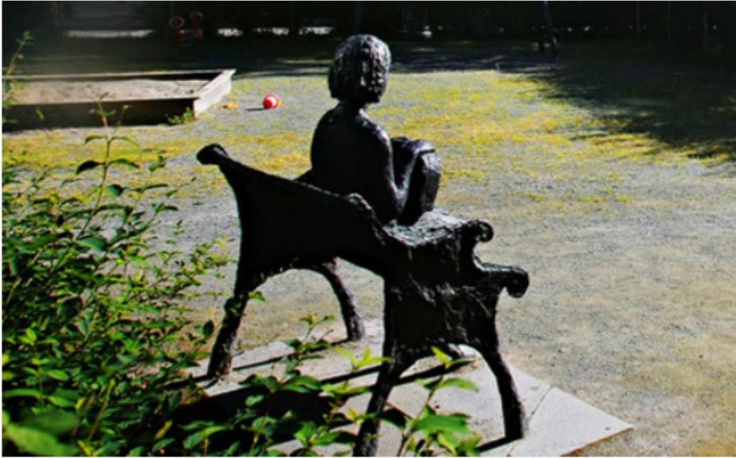
Cissi Klein-statuen hadde opprinnelig en annen plassering på Museums plass. Utsnitt fra Adresseavisens artikkel "Cissi Klein får selskap i parken" datert 09.07.2008