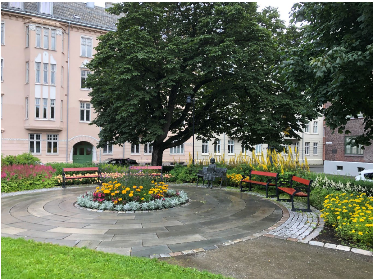
Bildet viser detaljering i dekke og benkenes plassering i nordøstre hjørne.