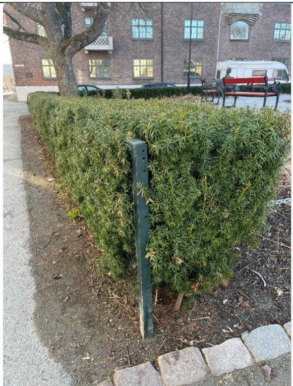
Detalj av barlindbusk og nettinggjerde sett mot øst