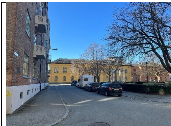
Cissi Kleins gate sett mot sør

Den lille gatestrekningen øst for parken hadde tidligere navnet Museums plass. Gatenavnet ble endret til Cissi Kleins gate høsten 1995. Gaten har eksistert i sin nåværende form siden området ble bygd ut på tidlig 1900-tallet.