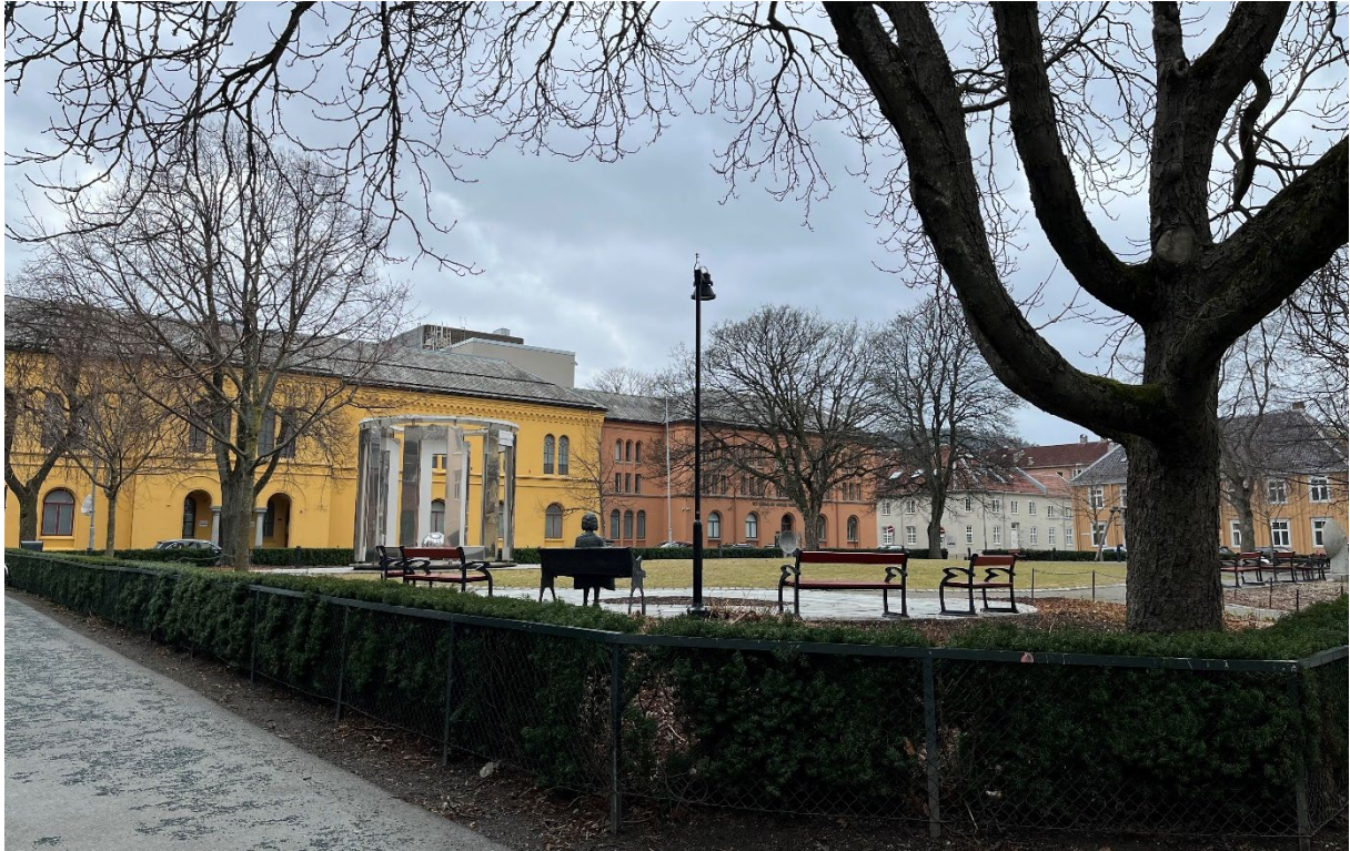
Nordøstre del av parken sett mot sørvest, fra Cissi Kleins gate