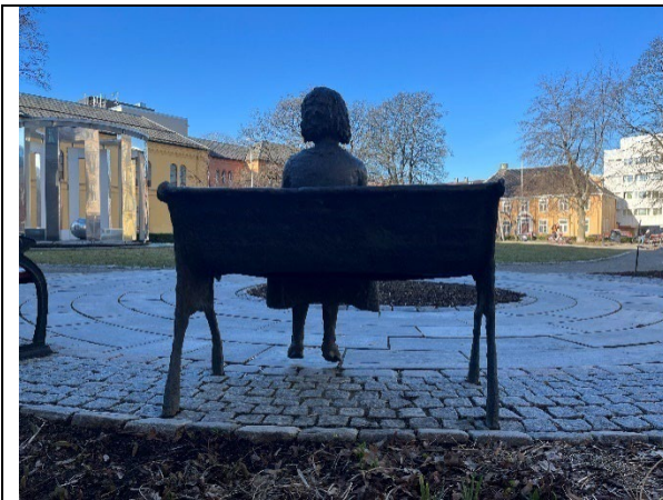
Sett bakfra og utover parken, mot sørvest