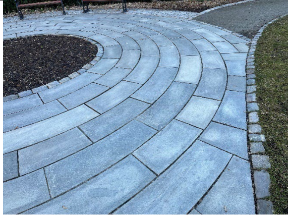
Detalj av smågatestein og skiferheller