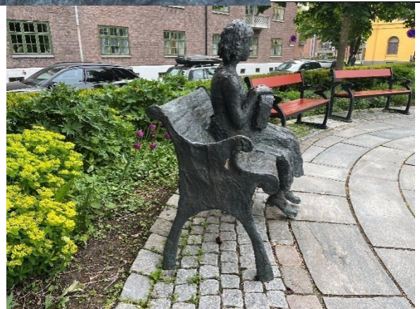
Statuen sett mot sørøst