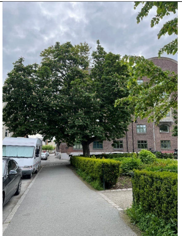
En eldre hestekastanje i nordøstre hjørne av parken