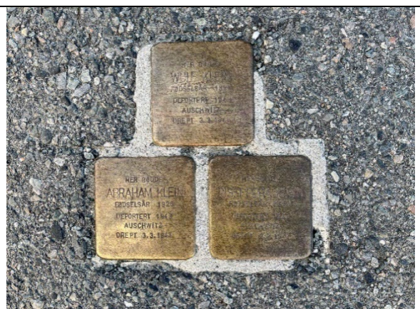
Snublesteiner i fortau foran bygård