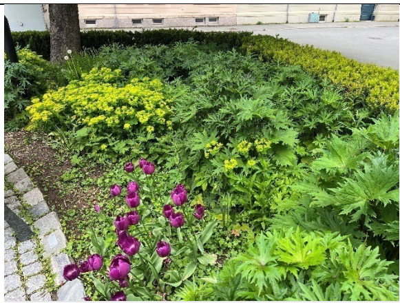
Detalj av staudebed bak statuen mot nordøst