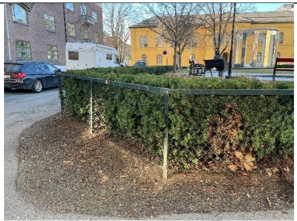
Detalj av barlindbusk med brutt hjørne mot nordøst