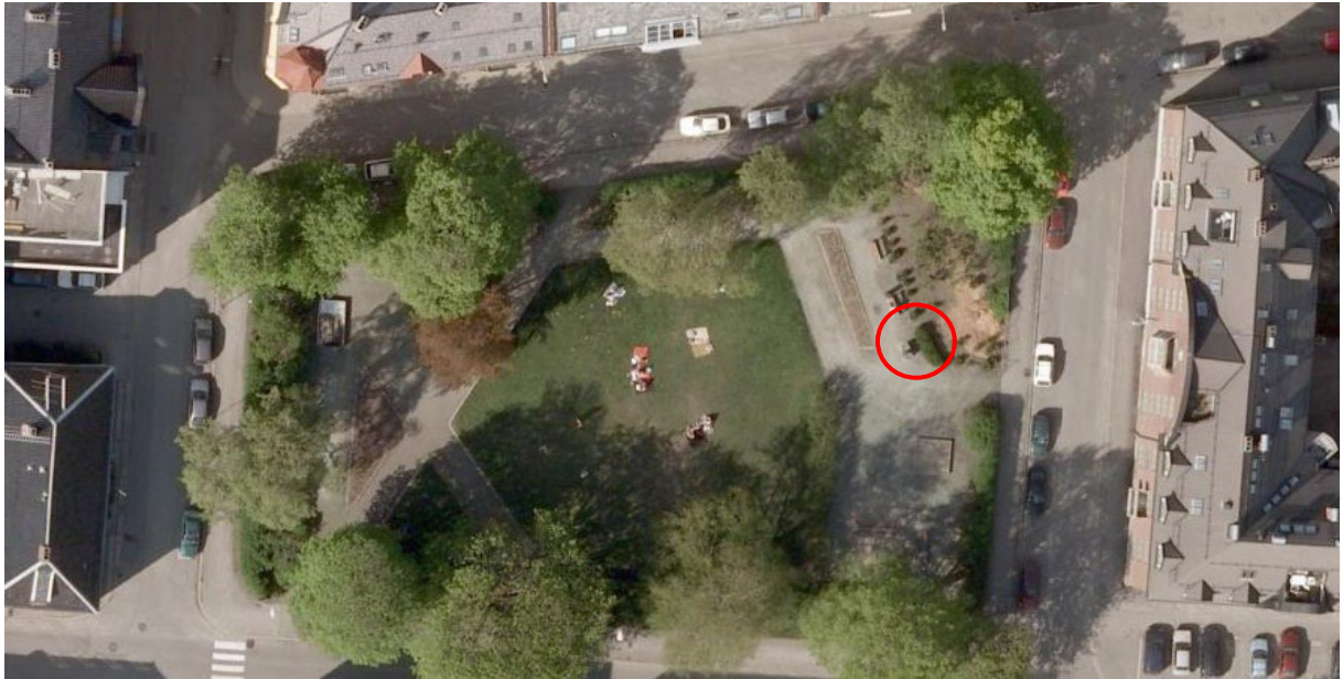
Ortofoto fra 2008 er det mest tydelige og viser statuens plassering, markert med rød sirkel.