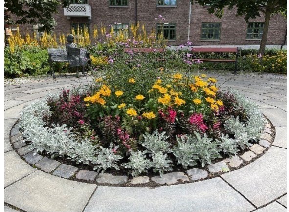
Detalj av bed i sirkel, august 2022