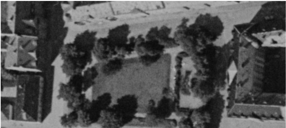
Ortofoto fra 1957 viser at parken har blitt opparbeidet med ny utforming.