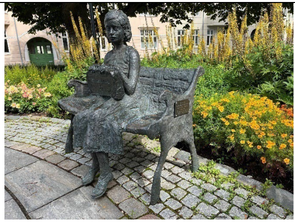
Sett mot nord, på siden av benken vises infoplaketten