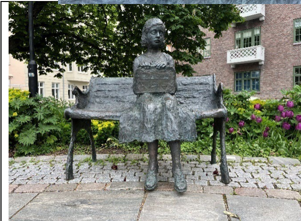
Cissi Klein-statuen sett mot nordøst