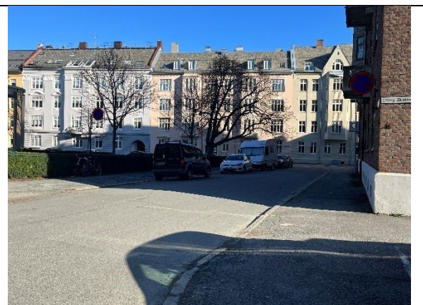
Cissi Kleins gate sett mot nord