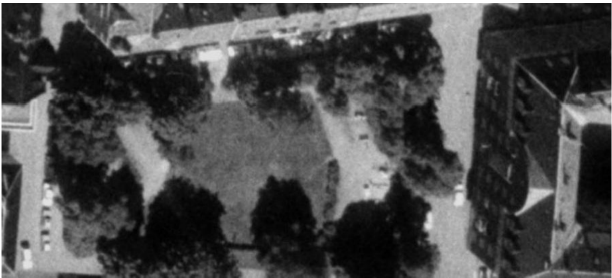
I 1984 har parken fått ny utforming. Parken hadde denne utformingen da statuen ble avduket.