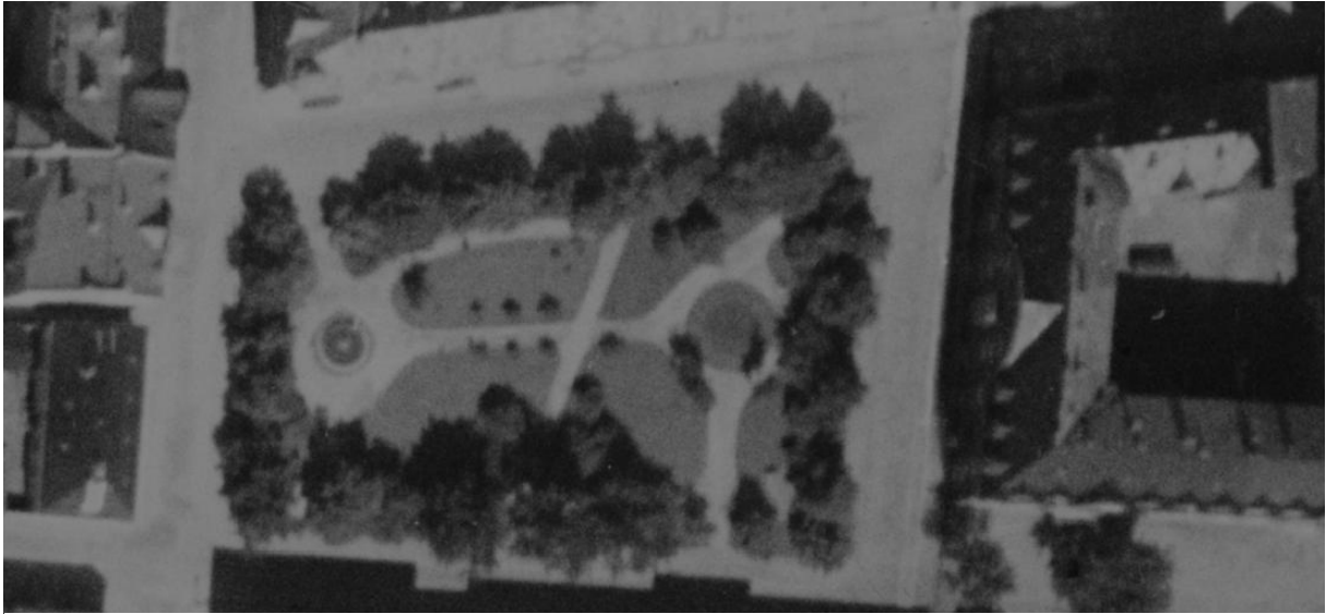
Det tidligste ortofoto fra Trondheim i 1937 viser trolig parkens opprinnelige utforming. Bilde fra 1947 viser samme utforming