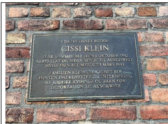
Plakett på veggen på Hans Hagerups gate 5

På bygården er det satt opp en plakett. Den var Trondheim bys første offentlige minnesmerke over jødiske ofre under andre verdenskrig.