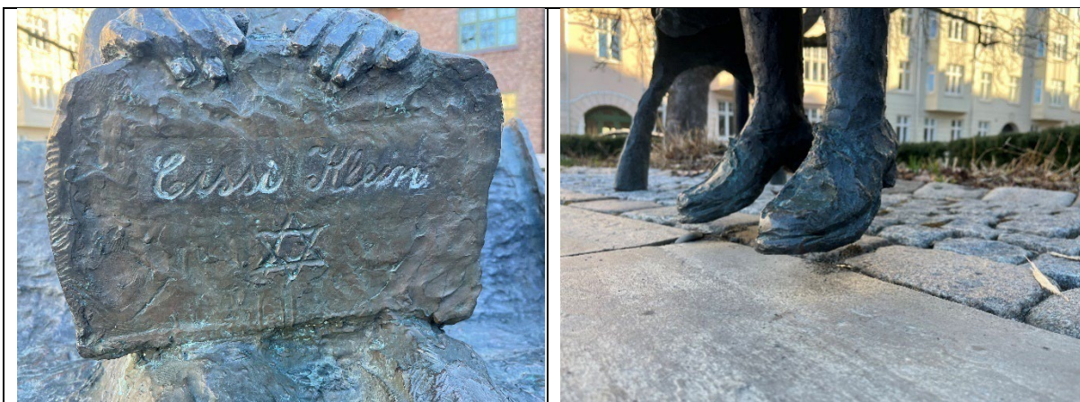
Cissis lille koffert med hennes navn på