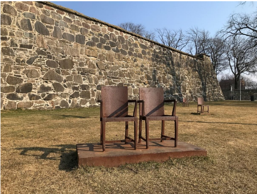
Antony Gormley: Site of Remembrance /Sted for erindring, 2000. ©Antony Gormley / KORO

Vi viser til tidligere utsendt forslag om fredning for deportasjonsmonumentet datert 13. juni 2022. Forslaget har vært på høring hos berørte parter og offentlig ettersyn. På grunnlag av dette fatter Riksantikvaren følgende vedtak: