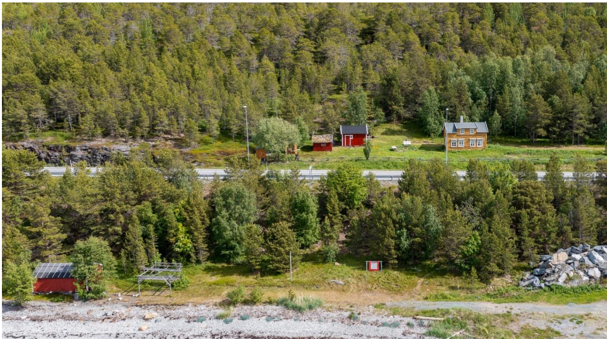
Hottitalo - Hottigården.

Vi viser til forslag om fredning, datert 25.07.2022 av Hottitalo/Hottigården, gnr./bnr. 45/2, Furulien i Storfjord kommune. Kulturminne- ID 280960 som har vært på høring og til offentlig ettersyn samt den påfølgende politisk behandling i Storfjord kommune 14. 12. 2022.