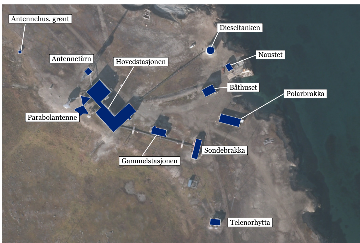
Figur 3: Det sentrale stasjonsområdet på Isfjord radio med bygninger og sentrale tekniske anlegg omfattet av fredningen. Rørgater, trasé for skinnegang, trestolper og fundamenter er kartfestet i dokumentasjonsvedlegg.