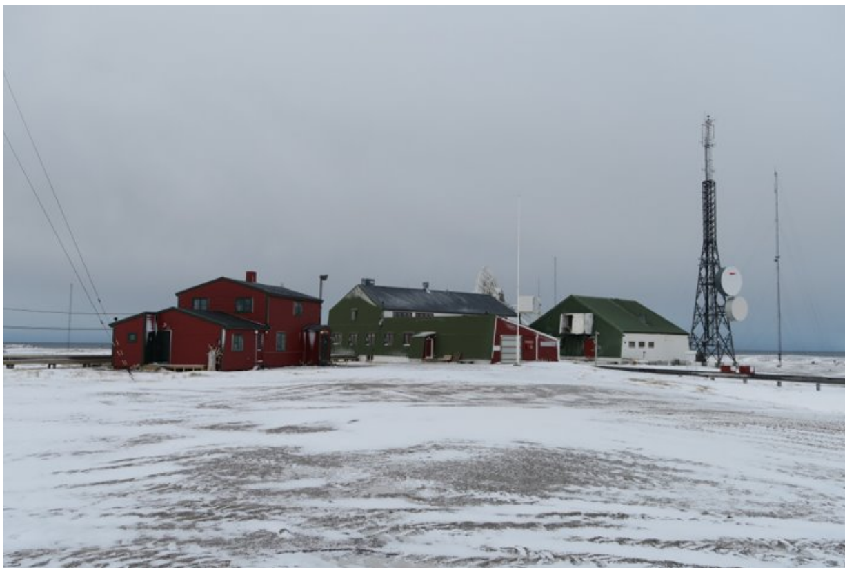
Figur 1: Det sentrale stasjonsområdet på Isfjord radio.

Vi viser til tidligere utsendt melding om oppstart av fredning av Isfjord radio, datert 7. juni 2022. På grunnlag av dette foreslår Riksantikvaren å frede Isfjord radio på Kapp Linné på Svalbard.