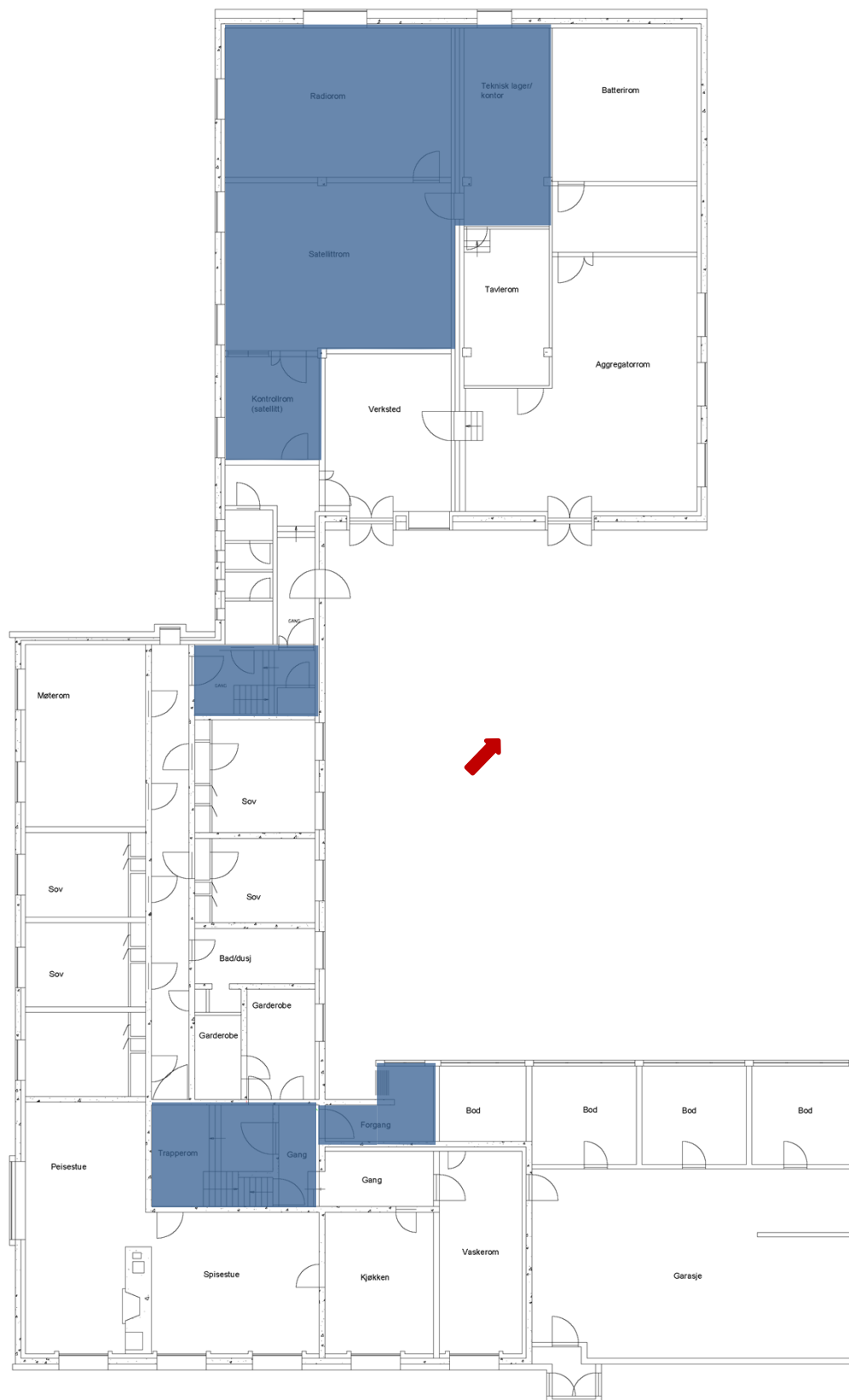
Figur 4: Plantegning Hovedstasjon, 1 etasje. Rom omfattet av interiørfredningen er markert med blått. Rød pil markerer nord.