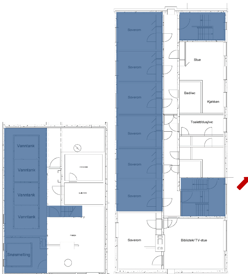
Figur 5: Plantegning Hovedstasjonen, boligdel. Til venstre: kjeller. Til høyre: 2. etasje. Rom omfattet av interiørfredningen er markert med blått. Rød pil markerer nord.

(Plantegning av Telenorhytta mangler på tidspunkt for forslag om fredning)