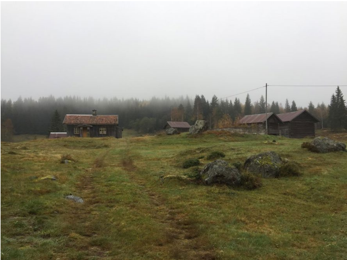
Skogfinneplassen Mikkelerud, Foto: Riksantikvaren