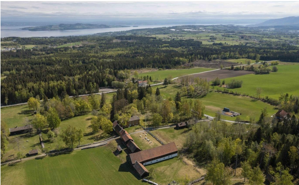
Steinberg med Mjøsa og Helgøya i horisonten.

Vi viser til tidligere utsendt fredningsforslag for Steinberg datert 19. mai 2023 som har vært på høring hos berørte parter og instanser. På grunnlag av dette fatter Riksantikvaren følgende vedtak: