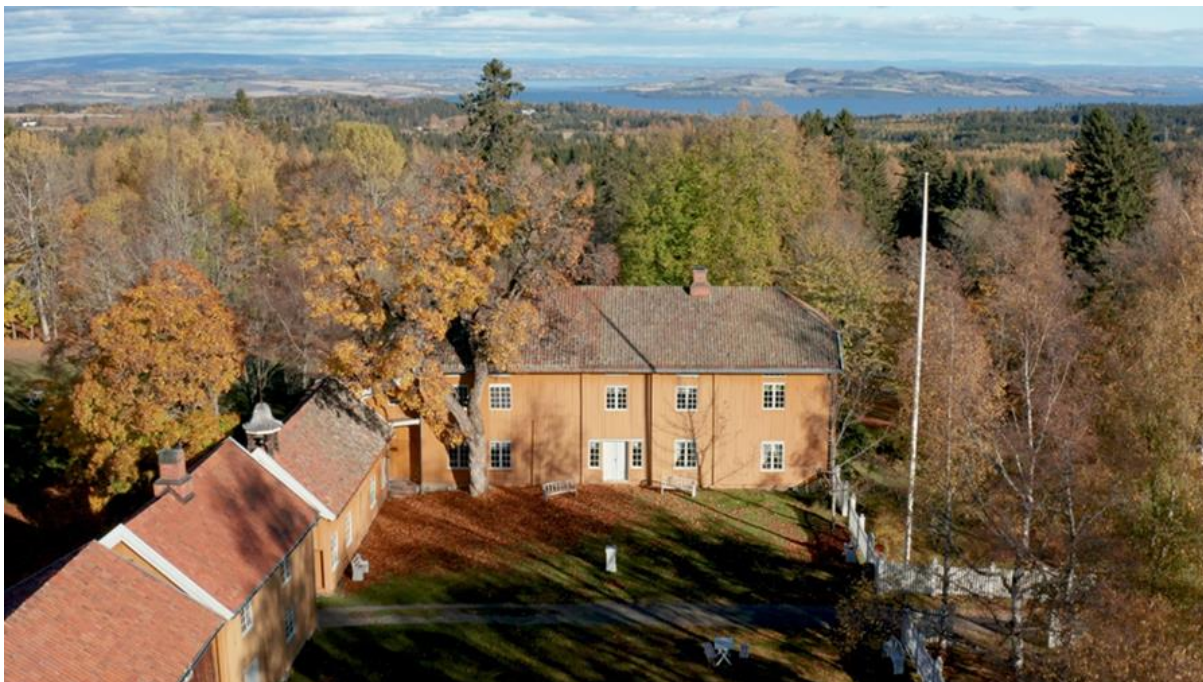
Amtmannsgården Steinberg i vakre høstfarger med Hedemarken og Helgøya i bakgrunnen. Utsikten fra eiendommen var nok en viktig kvalitet ved Steinberg da eiendommen ble lystgård og hovedbygningens første byggetrinn ble satt opp for ca. 250 år siden. De siste hundre årene har vegetasjonen vokst seg til i kulturlandskapet nedover mot Mjøsa og i gårdens park.

familiegravstedet er godt bevart. Også utenfor parken er det mange spor etter bruken av eiendommen som lyststed, med blant annet bevarte utsiktsplasser. Mange spor etter tidligere bruk og drift av gården særlig fra 1700- og 1800-tallet er bevart. De er fortsatt lesbare i kulturlandskapet og viser blant annet steingarder og tufter etter bygninger og anlegg.