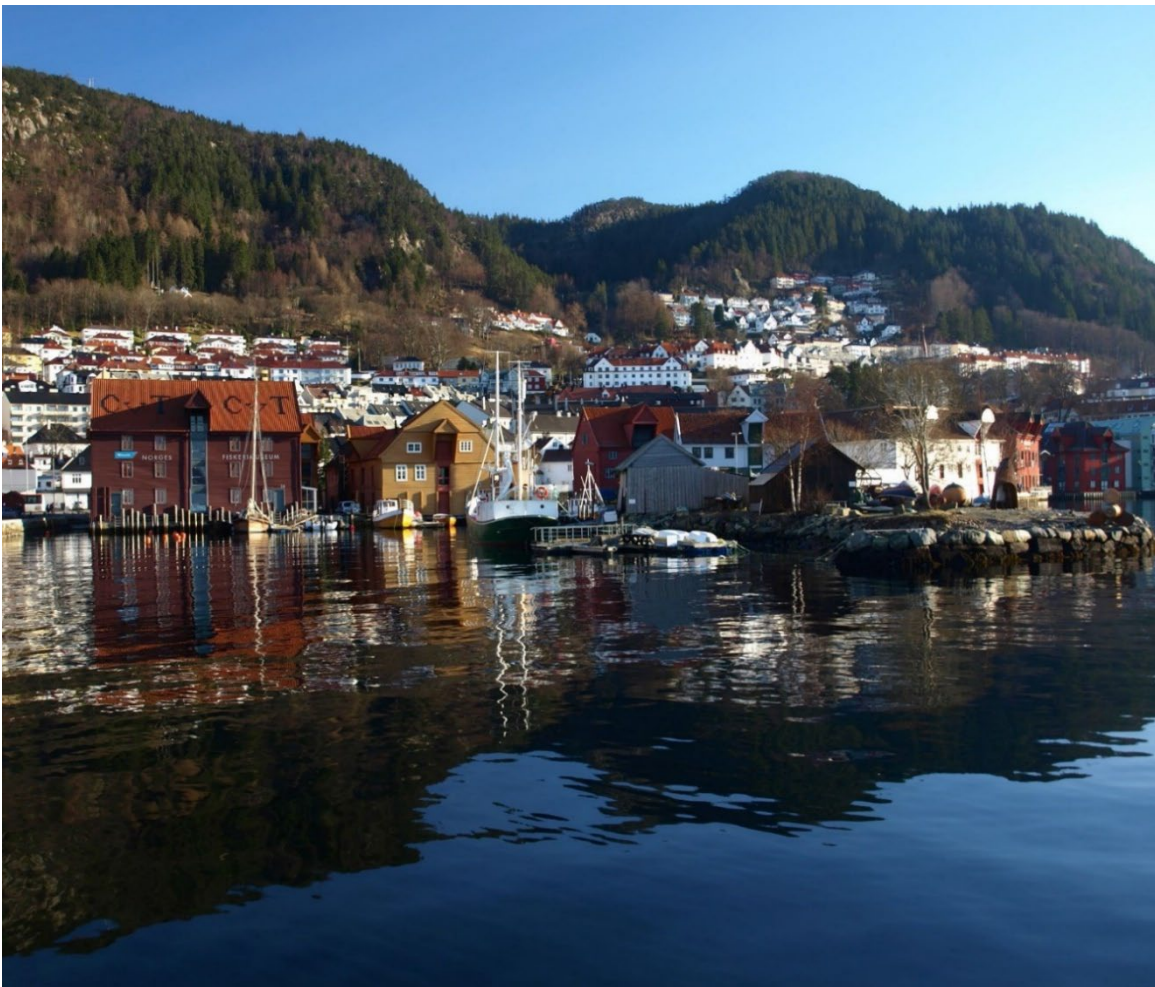
Sandviksbod 12 – 24 sett frå Kristiansholm.