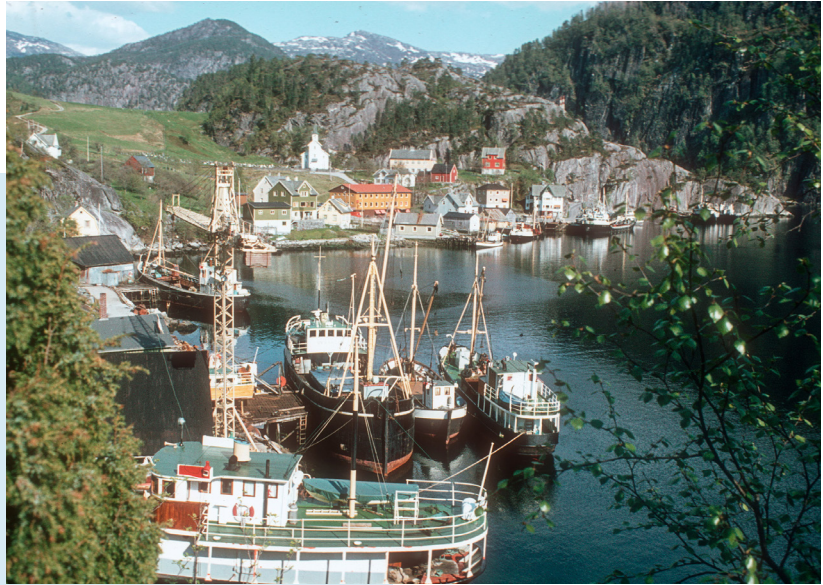
FRAKTEFARTØY – STAMNES, 1977