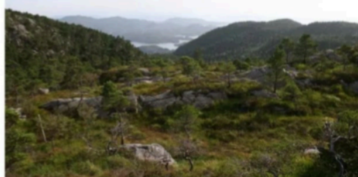
Fra Fanafjellet mot Lysskaret og Lysefjorden.

Fra Kulturminnegrunnlag for Byfjellene Sør, Bergen kommune 2006: