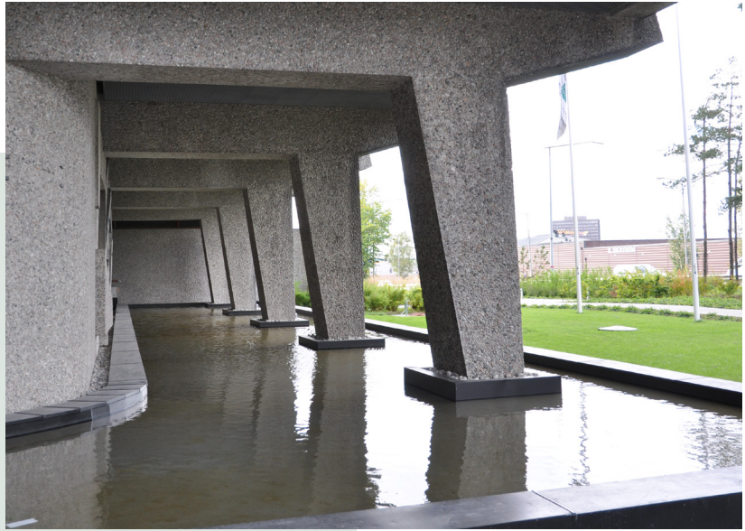
HOTEL 33 var opprinnelig Standard Telefon og Kabelfabriks administrasjonsbygning.