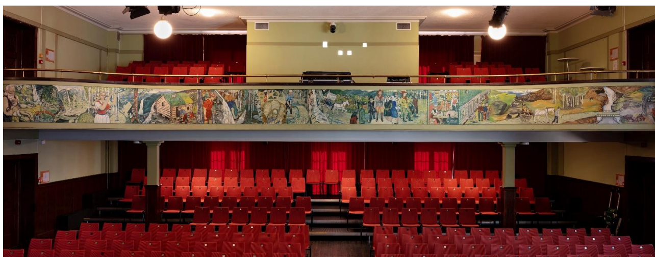
FOLKETS HUS, SAUDA: De mange møte- og forsamlingslokalene, eller «Folkets hus», som ble bygget i Norge, er et synlig bevis på arbeiderbevegelsens viktige posisjon utover på 1900-tallet. Folkets Hus i Sauda ble reist gjennom en omfattende dugnadsinnsats fra arbeiderne, og stod ferdig i 1931. Maleriene i Storsalen ble utført noen tiår senere. Deres symbolske formspråk og innhold avspeiler arbeidernes vilkår og historie, og gir uttrykk for den kraftfulle arbeiderbevegelsen i industrisamfunnet.

Fredningsvedtaket kan heller ikke gi føringer for tiltak som vil være søknadspliktige etter plan- og bygningsloven.