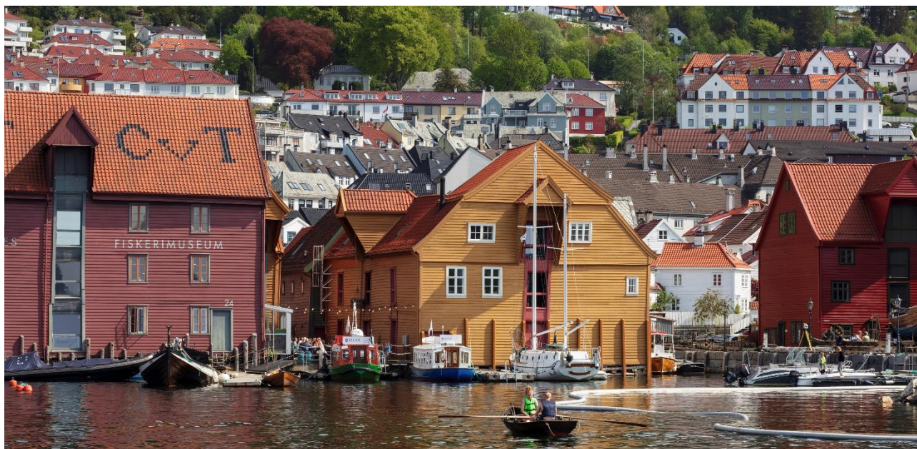
SANDVIKSODENE 12– 24, BERGEN: Sjøhusene er bygd mellom ca. 1672 og 1892 og er knyttet til rollen Bergen som et internasjonalt handelssentrum. Kulturmiljøet er levende minner om vår kystkultur og handelshistorie.

Bevaringsstrategiene skal legge til rette for at et mangfold av kulturmiljø, uavhengig av tidsperiode, blir bevart og brukt som en ressurs i samfunnsutviklingen. Hver av de tematiske bevaringsstrategiene har et tydelig innhold og egne målsetninger, men er åpen nok til å kunne romme ulike kulturmiljøer. I mange av bevaringsstrategiene vil de utvalgte temaene ha sammenfallende interesser med prioriterte tema i fredningsstrategien.