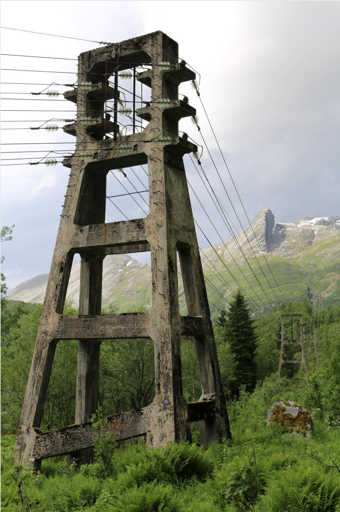
KRAFTLINJEN FYKAN-HAUGVIK, GLOMFJORD: Betongmastene fra 1917 har høy opplevelsesverdi, både som selvstendige objekter og som en del av det større kulturmiljøet knyttet til vannkraft- og industrihistorie i Glomfjord. Staten eier en rekke kulturminner og kulturmiljøer som gir en stor bredde i fredningslisten.