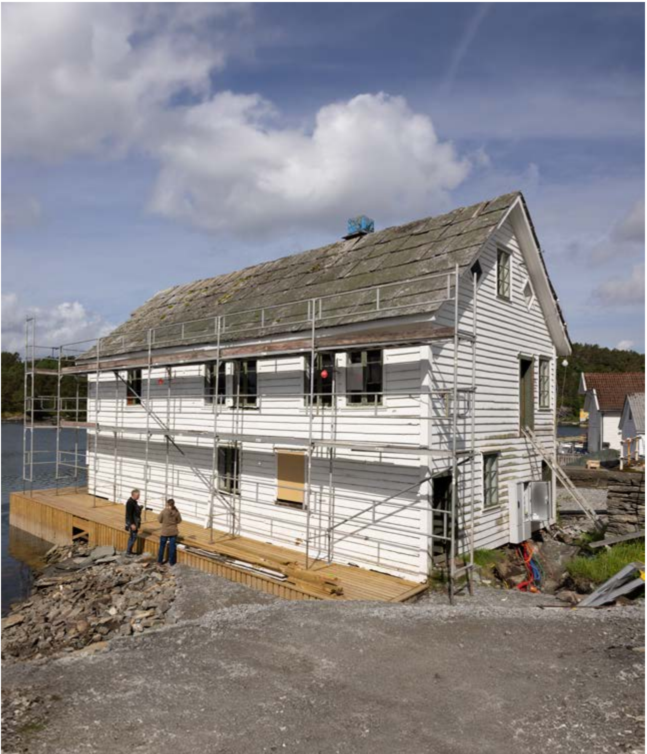
Sjøhuset Vatna i Sveio kommune skal settes i stand etter å ha stått tomt i over 20 år. Skifertaket og vinduene står på listen over tiltak som skal gjennomføres, slik at bygningen kan få bruk som forsamlingshus.