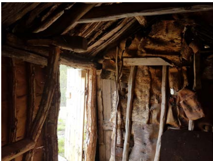
Kaperdalen i Senja: en av de best bevarte markesamsike boplassene i Norge. Det er stor håndverkermangel i Sápmi, noe som gjør det særlig utfordrende å ta vare på samiske kulturminner.

Kompetansekravene må være forståelige og tilgjengelige for håndverkere og bedrifter, og for eiere som skal bestille håndverkertjenester. Kulturmiljøforvaltningen må veilede eiere av fredete kulturminner slik at kompetansekravene er tilpasset det enkelte prosjektets kompleksitet.