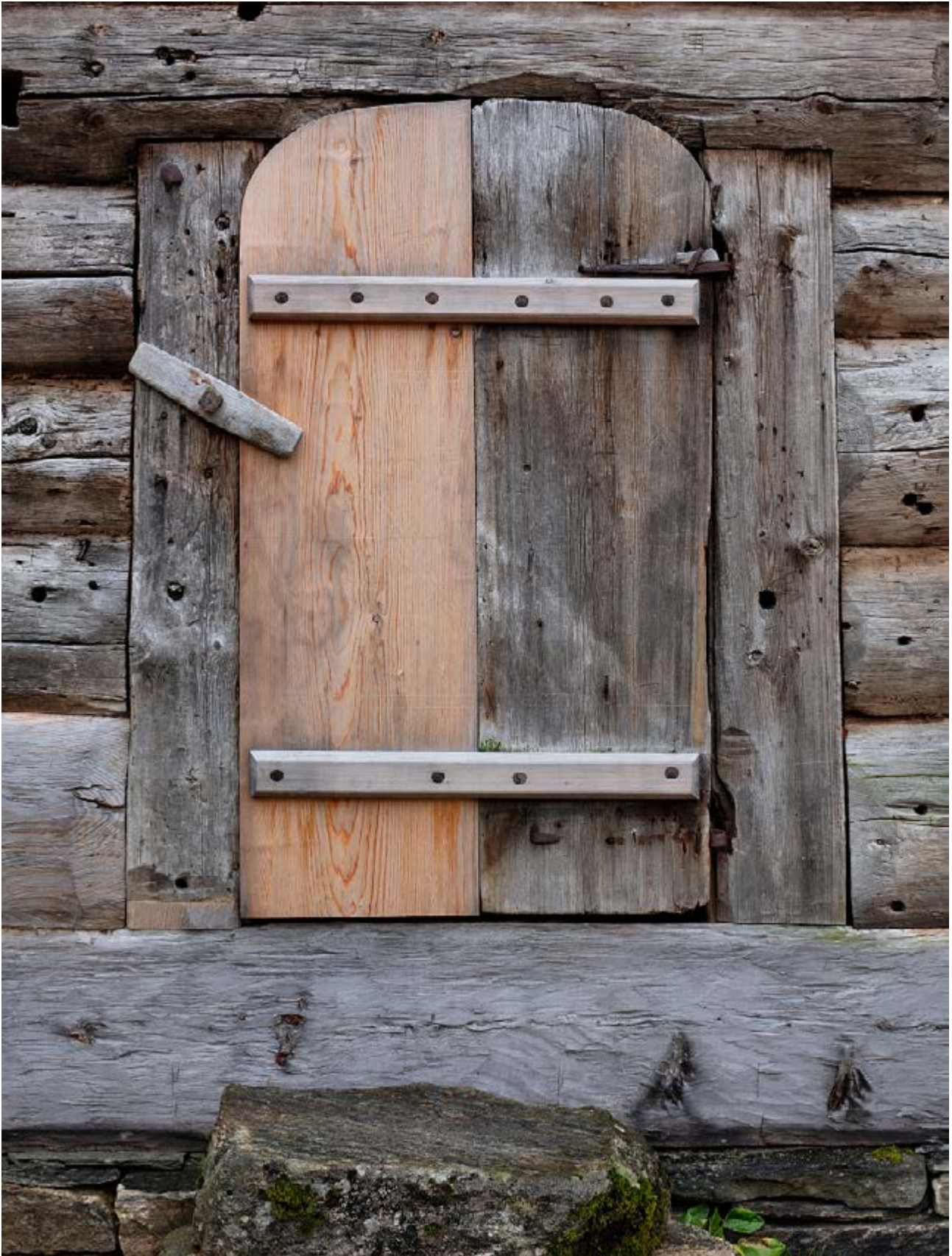
Den gamle røykstua Toskedalstova i Vestland ble demontert på 1960-tallet og lagret på en låve i mange år. Dendrokronologiske undersøkelser har vist at bygningen har bygningsdeler fra rundt 1596. I 2018 ble stua satt opp igjen på gården. De bygningsdelene som det ikke var mulig å bruke på nytt, ble erstattet med kopier utført i samme materialkvalitet og håndverksteknikker, med fokus på lokale materialer.