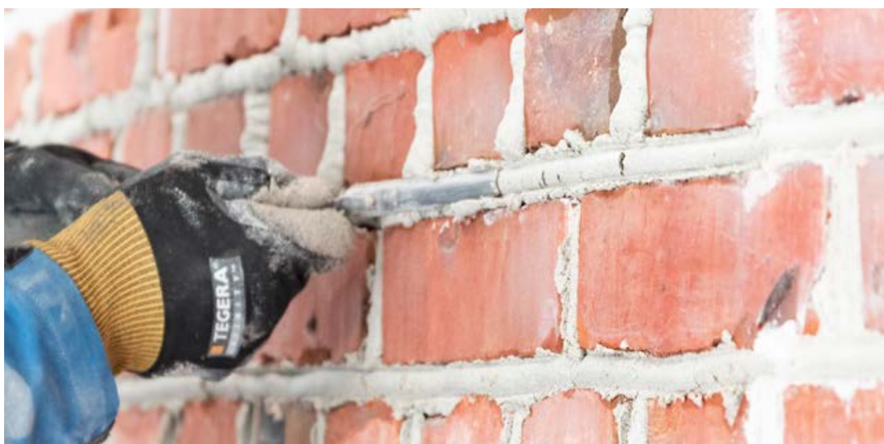
Riktig materialbruk er viktig for en god istandsetting. Her blir fuger i sementmørtel erstattet med nye pøsefuger i kalkmørtel.

Riksantikvaren er klar over at mange mindre bedrifter har begrensede ressurser til å administrere omfattende anskaffelsesprosesser i konkurranser om offentlige midler. Oppdragsgiversiden kan også ha begrensede kunnskaper om anskaffelsesregelverket. I sum kan dette gjøre at offentlige anskaffelser blir en barriere for å nå målsettingene i strategien.