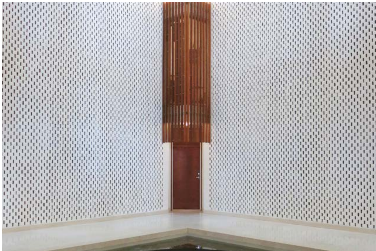
Den tidligere amerikanske ambassaden i Oslo har blitt rehabilitert og fått ny bruk. Detaljer i interiørene, som radiatorkasser, dører og vinduer har blitt istandsatt med høy faglig presisjon.

Hindringer for en god kobling mellom markedet og bedrift kan være at bestiller ikke vet hvilken kompetanse de har behov for. En annen utfordring kan være at en eier ikke finner fram til riktig bedrift eller at bedriftene ikke kjenner til markedet.