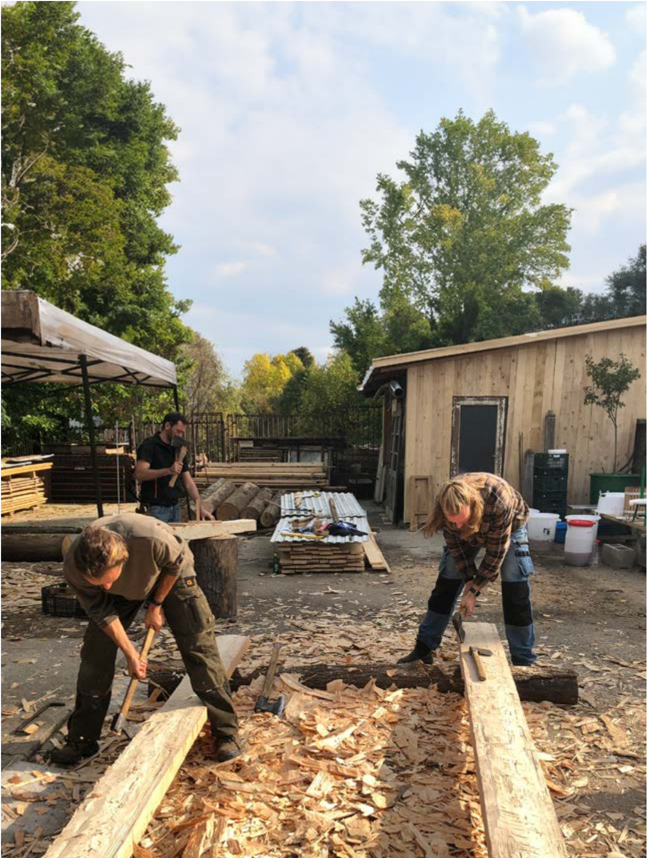
Spretteteljing var på agendaen da slovakiske og norske håndverkere møttes på workshop i trehåndverk i den slovakiske verdensarvbyen Banská Štiavnica i 2022. Behovet for kvalifiserte tradisjonshåndverkere er stort i de fleste land, og det er mye å lære av samarbeid over landegrensene. Denne workshopen var en del av prosjektet Pro Monumenta II, finansiert gjennom EØS-midlene.