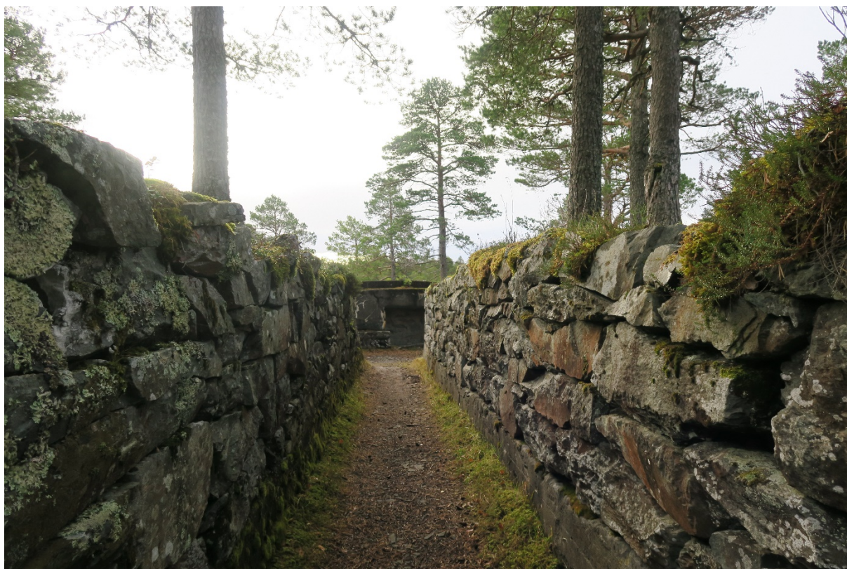
Hegra festning.