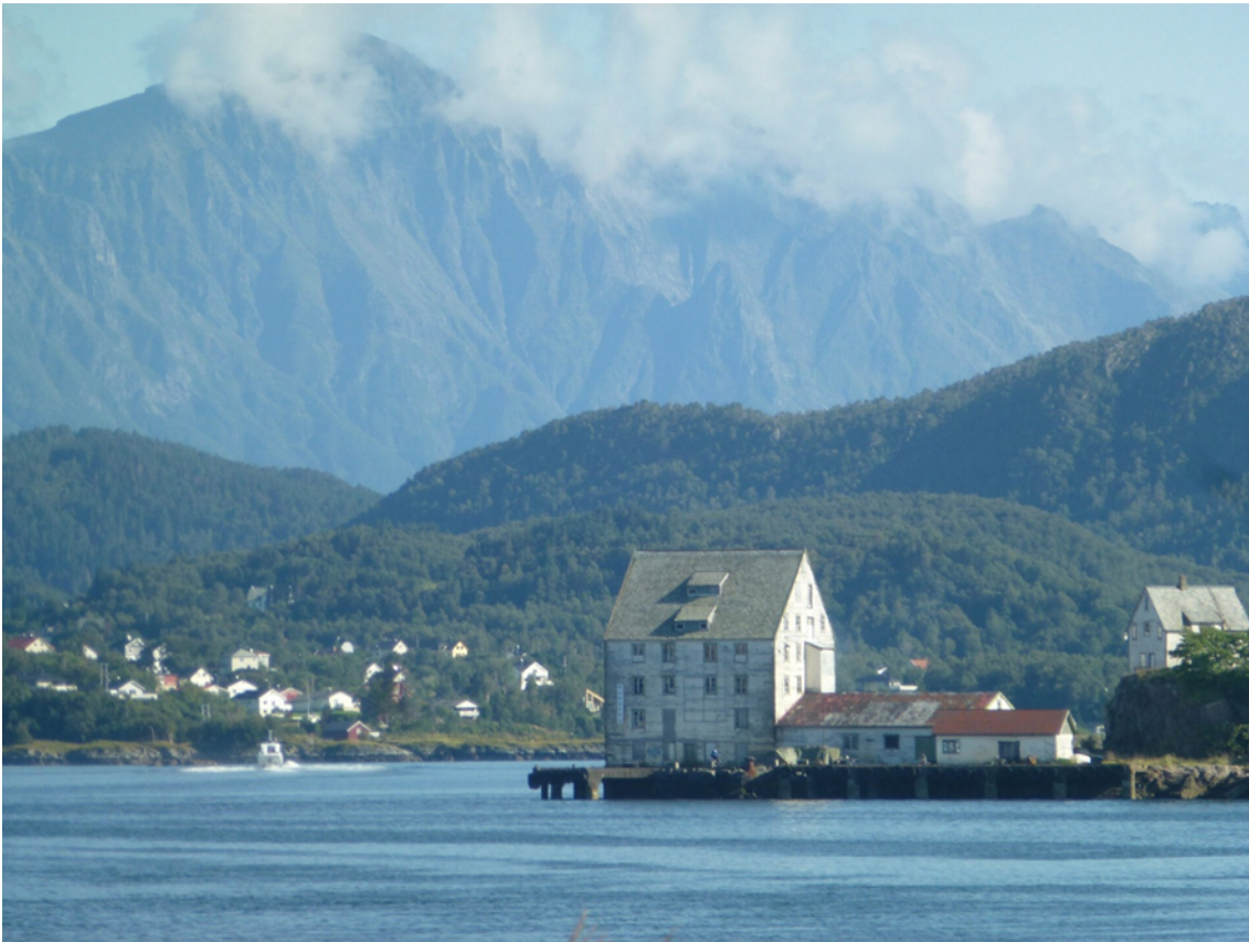
Sjøhuset er eit velkjent landemerke ved innseiinga til Ålesund. Foto: Kjell Andresen, Riksantikvaren, 2012