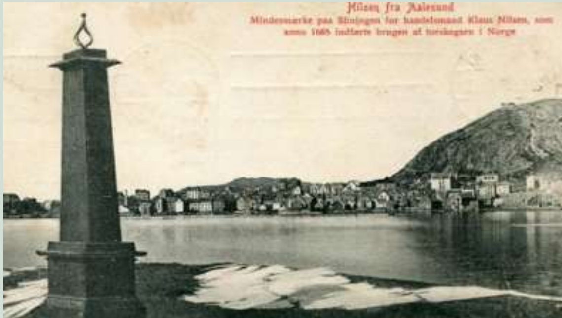
Foto over: minnesmerket før det vart flytta opp til bustadhuset der det står plassert i dag.

Foto til høgre: Slinningsodden sett frå Ålesund rett etter bybrannen i 1904. Slinningsbua var enno ikkje oppført.