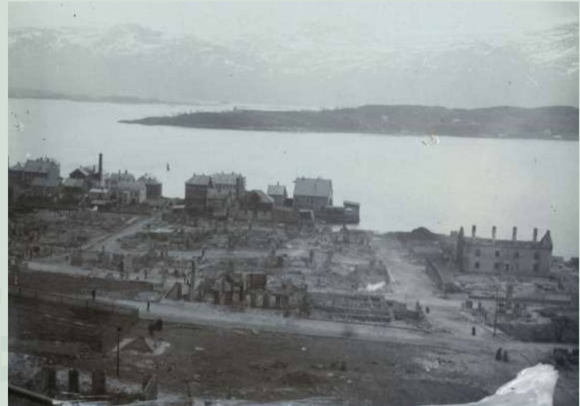
Foto til høgre: Slinningsodden sett frå Ålesund rett etter bybrannen i 1904. Slinningsbua var enno ikkje oppført.

Foto over: minnesmerket før det vart flytta opp til bustadhuset der det står plassert i dag.