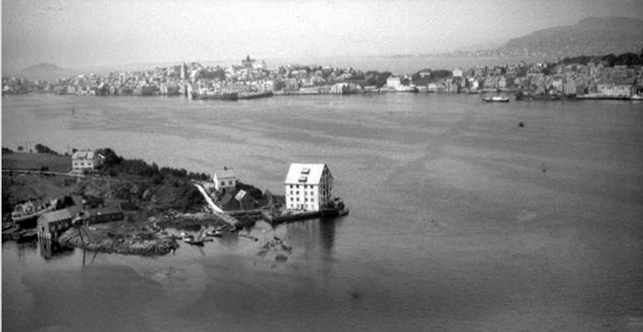
Slinningsbua i 1953. Biletet viser sjøhuset før tilbygget vart oppført.